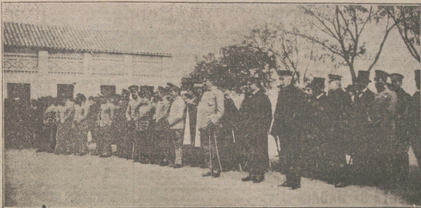
EL MINISTRO DE LA GUERRA EN TOLEDO.—El Sr. La Cierva durante su visita a la Academia de Infantería, presenciando el desfile de los alumnos.

derecho de regir sus propios destinos, será de tal forma que garantice los intereses fundamentales y duraderos de los grandes Estados vecinos, Rusia y Alemania. Es para mí una especial satisfacción el que podamos ir en pos de este objetivo, de pleno acuerdo con nuestros aliados y contando con la aprobación moral de la aplastante mayoría de los representantes del pueblo alemán aquí reunidos, y dará a nuestra actitud en el exterior la necesaria fortaleza.» Kuehlmann añadió: «Sobre la situación militar ya han escuchado ustedes ayer explicaciones detalladas por boca del canciller imperial.