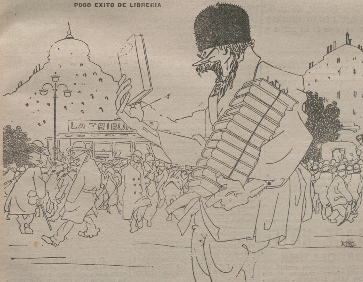
—A título «El pacto de Londres», a pññel