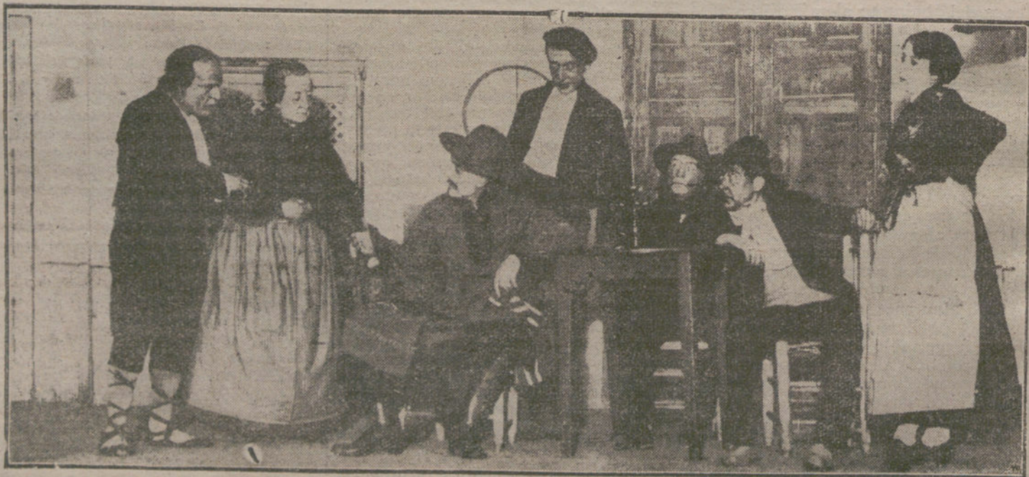
Una escena de «El crimen de la venta», obra estrenada anoche en el Coliseo Imperial.

También en esta cuestión seguiremos, sin apartarnos de ellos, un momento, los principios de una diplomacia firme y moderada, basada en los hechos. Los principios hasta ahora comunicados al mundo por los actuales gobernantes de San Petersburgo se presentan como base adecuada para una reforma de las cosas en Oriente, la cual, haciendo completa justicia al