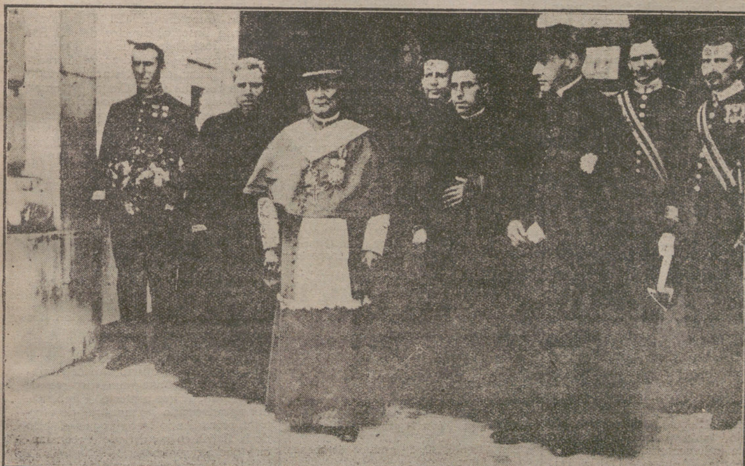
El ilustrísimo señor obispo de Sión, al salir de la capilla pública de Palacio, en la que se ha celebrado una solemne función religiosa para conmemorar sus bodas de plata episcopales.

¿Señalar un impuesto fundado en el abaratamiento que, por efecto de la supresión de los Consumos habrían de tener las subsistencias, cuando éstas se han encarecido hasta lo increíble, es absurdo, irrisorio y de una injusticia que subleva. Pretender á todo trance que lo paguen quienes no tienen para comer, es, además de inadmisibles, peligroso, porque tiene el aspecto de una imposición irritante, de un abuso del poder de los que ponen en el ánimo