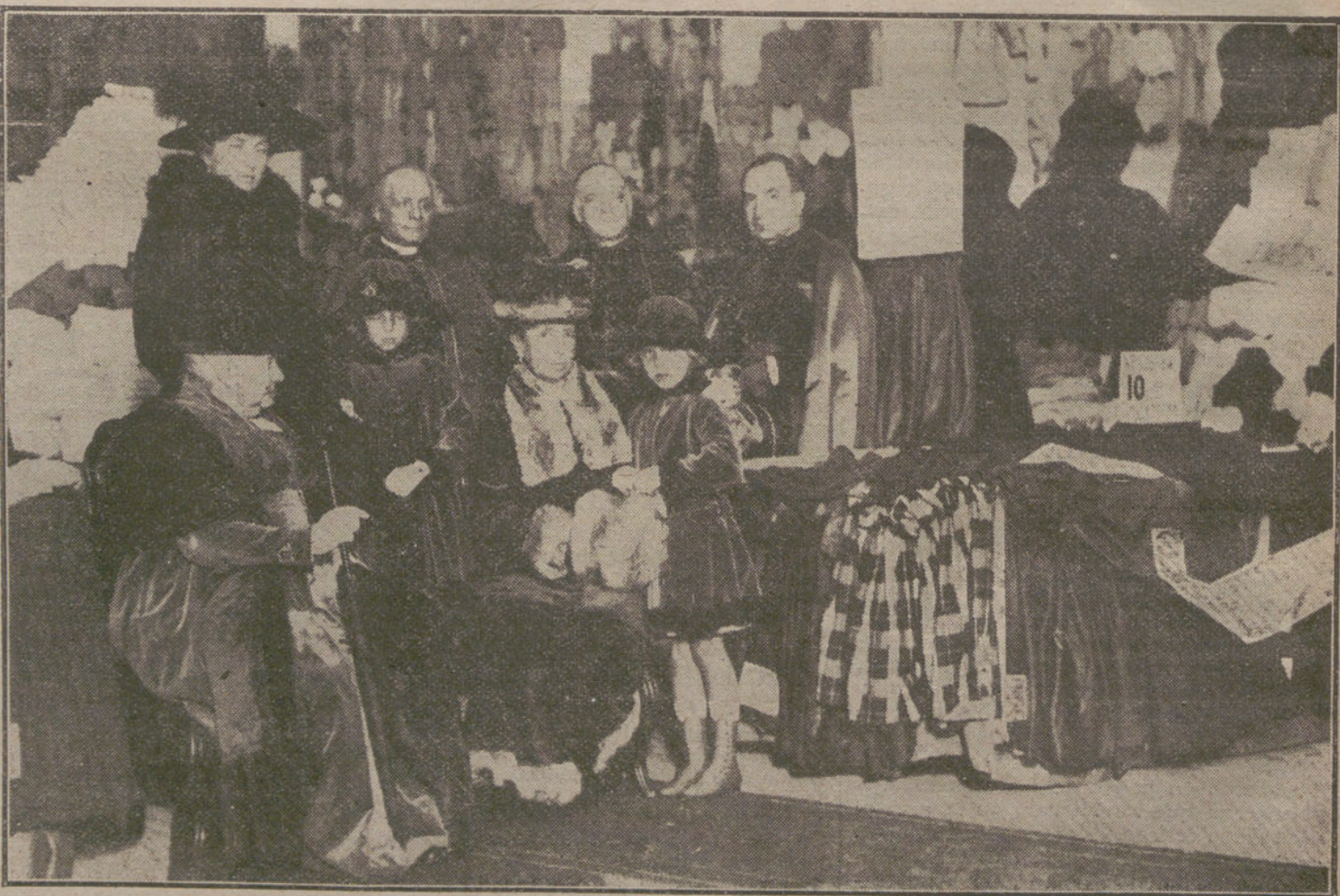
SS. MM. las Reina Doña Victoria y Doña María Cristina, con SS. AA. las Infantitas Doña Beatriz y Doña Cristina e Infanta Doña Isabel, durante la apertura de la Exposición del Ropero de Santa Victoria.

Dijo al corresponsal del diario «Social Demokraten»: «Mientras el Egipto esté bajo el dominio inglés, jamás el mundo tendrá una paz duradera, y mientras el Canal de Suez esté en manos de los ingleses, toda paz será sólo temporal. Las demás grandes Poten-