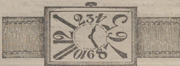
Núm. 8.—Oro de ley 18 quilates, forma rectangular, áncora 15 rubíes, pulsera de cuero fino. Pesetas 100.