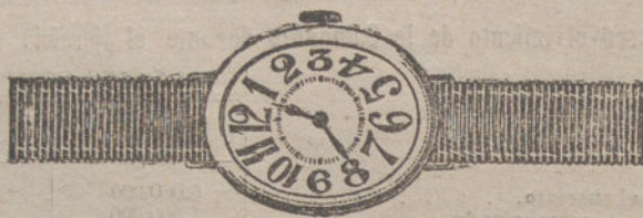
Núm. 7.—Oro de ley 18 quilates, forma ovalada, máquina especial, pulsera de moiré. Pesetas 80.