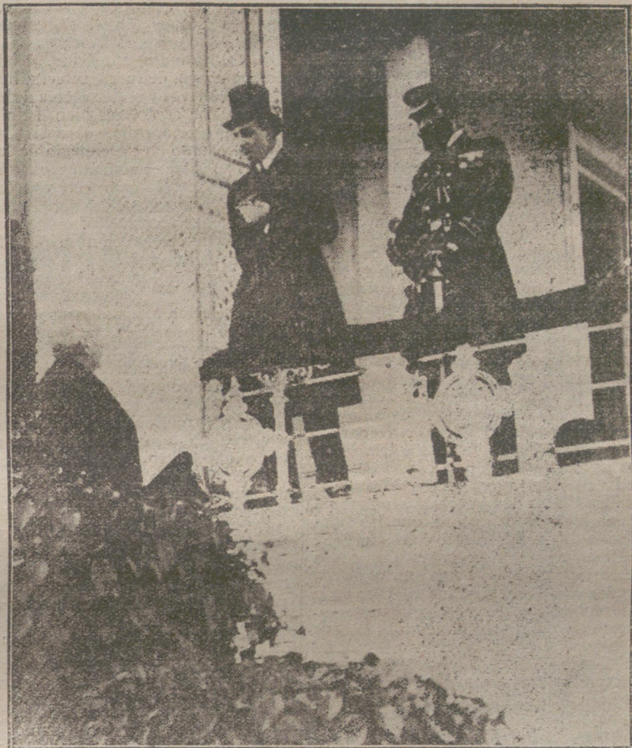
AYER EN EL HIPÓDROMO.—El director de Seguridad informando a S. M. el Rey de la protesta del público con motivo de la carrera «Premio Alcorcón».

Con tan suculentos abonos, la amnistía se ha transformado en un árbol frondoso, y su sombra cobija a estos revolucionarios mixtificadores, que cómodamente se refugian en ella, esperando la lucha electoral. Venga la poda, pues, si quiera sea sólo para dejar al descubierto a los farsantes.