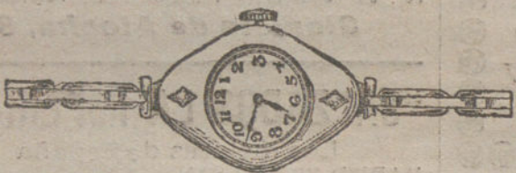
Núm. 2.—Oro de ley 18 quilates, con 2 brillantes, máquina especial, pulsera extensible. Pesetas 165.