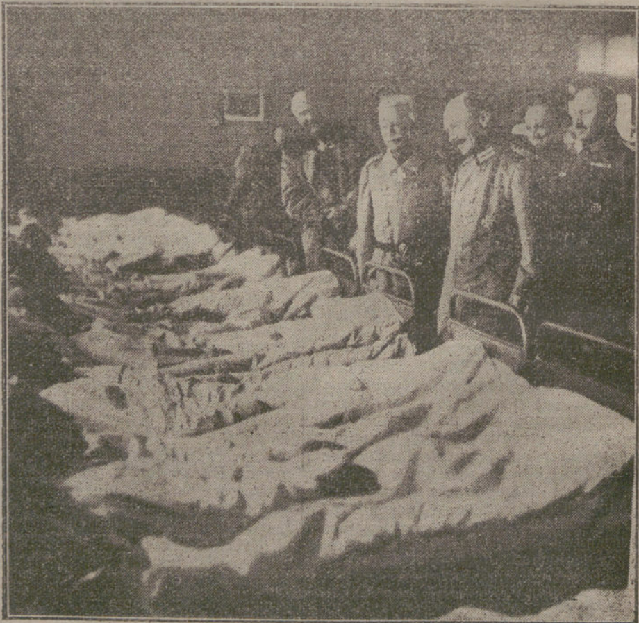
El Rey de Sajonia visitando a los soldados heridos, en un hospital próximo al frente de batalla.

BERLIN (Radiograma de Nauen). El Reichstag ha votado el nuevo crédito de guerra de 15.000 millones de marcos.