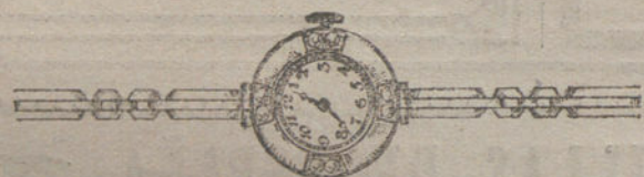
Núm. 6.—Oro de ley 18 quilates, con 8 brillantes sobre platino, pulsera extensible. Pesetas 400.