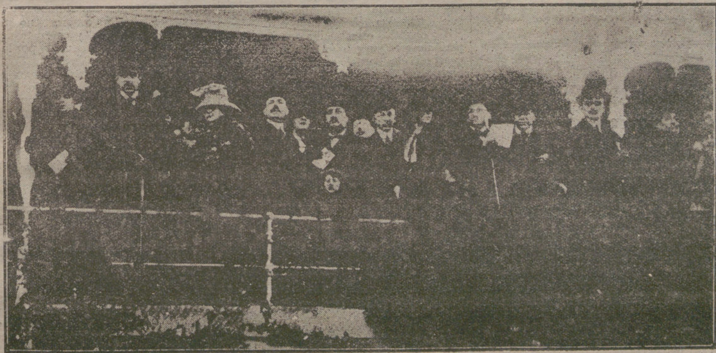
AYER EN EL HIPÓDROMO.—Un aspecto de la tribuna, durante las últimas carreras.

Es igualmente falso que los citados organismos hayan tomado acuerdos contrarios a los coroneles honorarios y que alcanzaban a una elevada personalidad.