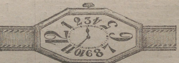
Núm. 10.—Oro de ley 18 quilates, forma «tonneau», facetado, áncora 15 rubíes, pulsera de cuero. Pesetas 125.