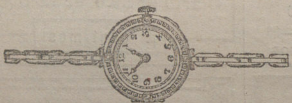
Núm. 4.—Oro de ley 18 quilates, con 4 brillantes y zafiros, áncora de precisión, pulsera extensible. Pesetas 275.