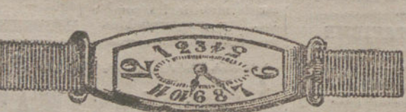
Núm. 12.—Oro de ley 18 quilates, forma «tonneau» alargado, áncora de precisión, pulsera de moiré. Pesetas 175.