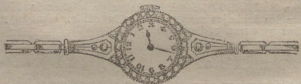
Núm. 16.—Platino con orla y guarniciones de brillantes, áncora de precisión, pulsera extensible. Pesetas 1.200.