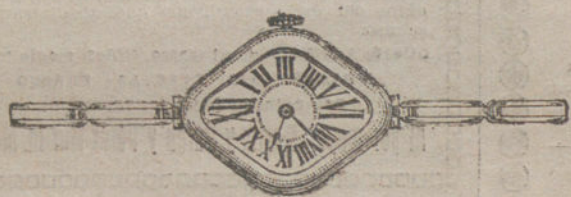
Núm. 1.—Oro de ley 18 quilates, forma rombo, máquina de precisión, pulsera extensible. Pesetas 125.

Garantía efectiva de buena marcha por cinco años