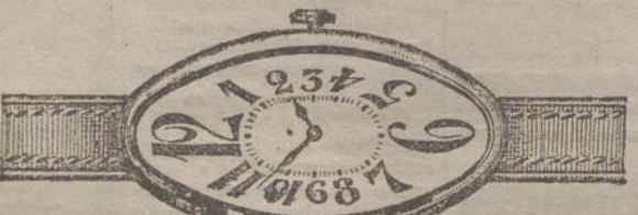
Núm. 11.—Oro de ley 18 quilates, forma ovalada, áncora 15 rubíes, pulsera de cuero. Pesetas 135.