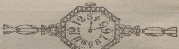
Núm. 17.—Platino con decoración de brillantes y diamantes, áncora, pulsera extensible. Pesetas 1.350.