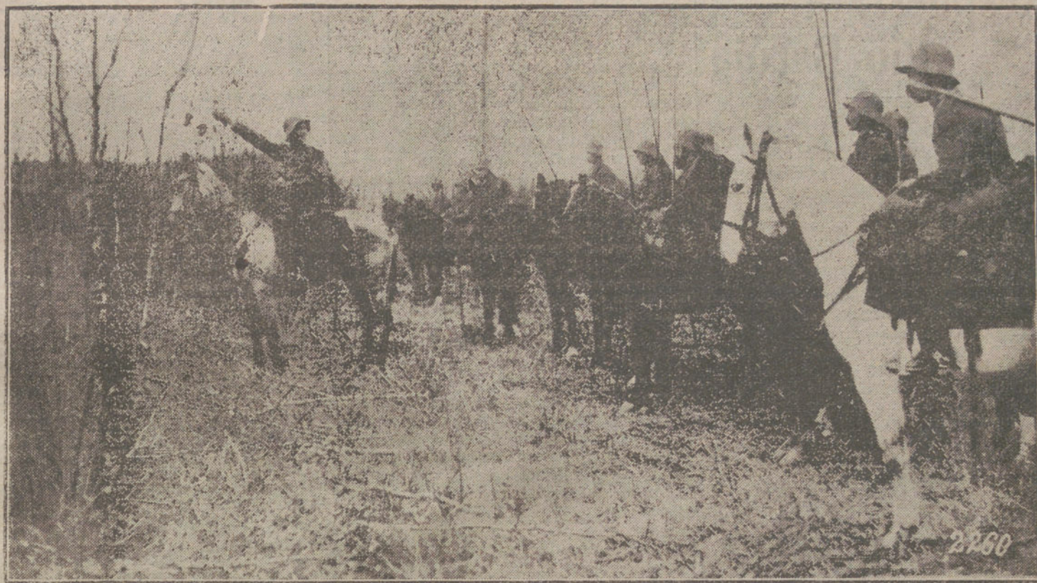
LA LUCHA EN EL FRENTE OCCIDENTAL.—Sección de Caballería alemana preparada para un avance.

cia, por los círculos de expansión y evolución que á través de los años han creado á su alrededor, por sus lecciones, por como han hecho que lo oriental se supere y se entapice, porque han matado «aquello», porque en las estampaciones, en los gestos, en las combinaciones, en el decorado han inducido á una renovación desconocida antes de ellos, y yo, ante todo, soy muy fiel á la memoria de lo que ha sido de algún modo «diciador» de algo.