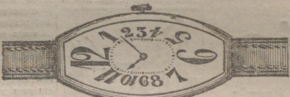
Núm. 9.—Oro de ley 18 quilates, forma «tonneau», áncora 15 rubíes, pulsera de cuero. Pesetas 115.