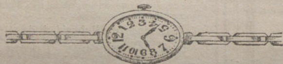
Núm. 5.—Oro de ley 18 quilates, forma ovalada, áncora de precisión, pulsera extensible. Pesetas 375.