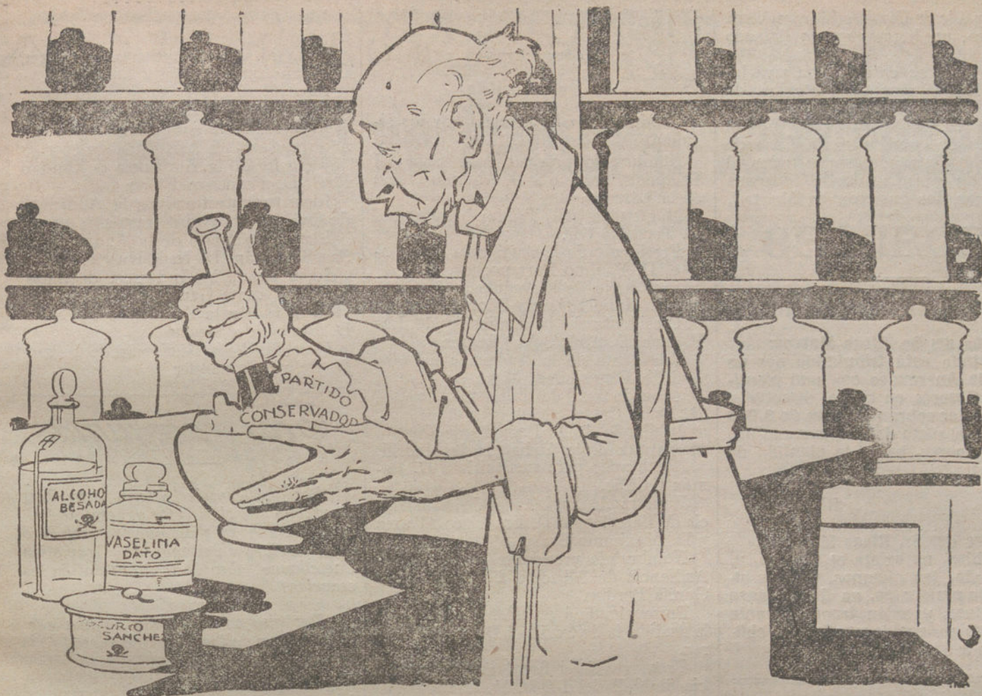
EN LA FARMACIA CONSERVADORA Disolviendo una fórmula.