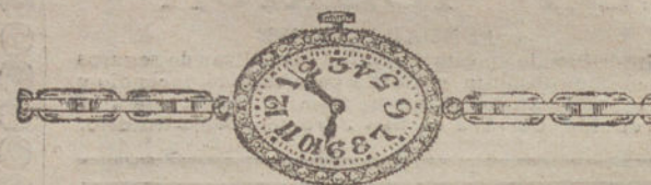
Núm. 13.—Platino y oro de ley con brillantes y diamantes, áncora de precisión, pulsera extensible. Pesetas 625.