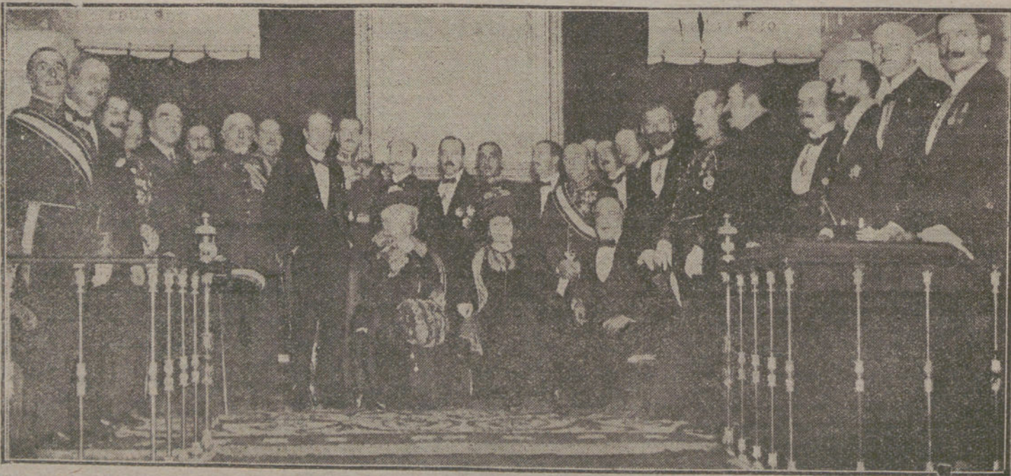
Un aspecto del estrado durante el solemne acto inaugural de la Academia Hispanoamericana, verificado ayer tarde.

Cada vez que el Alto mando alemán adquirió la convicción de que el mantenimiento de la vida de sus soldados tenía para sí un valor más elevado que la posesión de un trozo de pantano, anunciaban nuestros adversarios una victo-