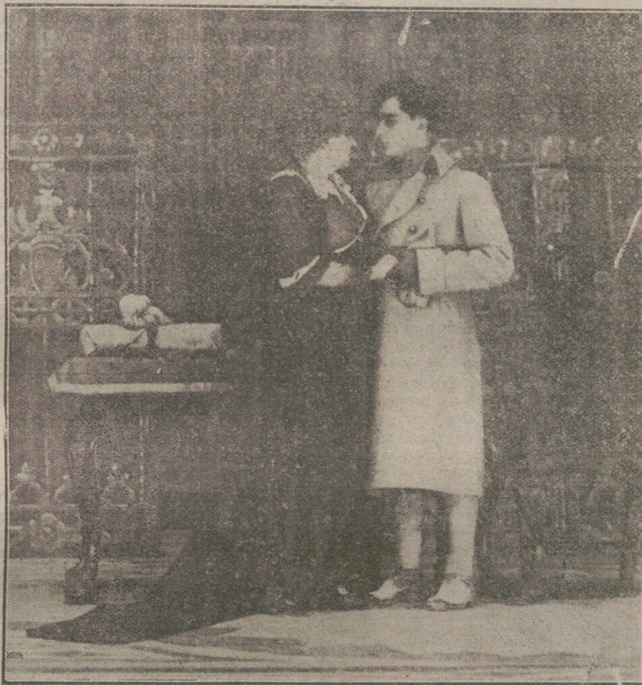
Escena final de «La enemiga», drama estrenado anoche en el teatro de la Princesa.

El prejuicio rutinario de la unidad ha traído muchos contratiempos, hasta que dibujado en el horizonte po-