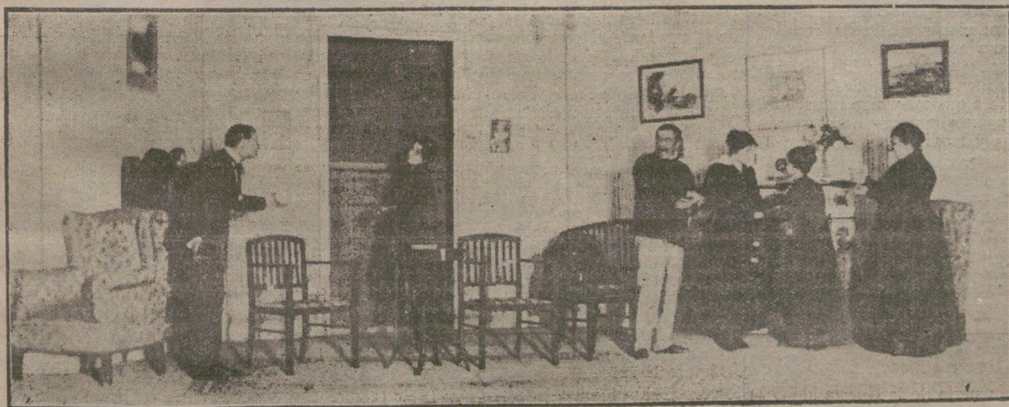
Una escena de «La madrileña», obra que se estrena esta noche en el teatro de Eslava.

Si «La madrileña» es una comedia de caracteres, de dos caracteres por lo menos, el de «ella» y el de «él», no hay duda de que todos sus personajes contribuyen a hacer de la misma una comedia de costumbres españolas—de buenas y malas costumbres—y de ambiente español. Generalizado un poco, creo que puede presentarse como arquetipo de la española a la mujer fuerte en el querer y en el sufrir, y más propensa a la fidelidad conyugal que al adulterio vindicativo, interesado ó placentero. Así es Antonia. Si se dice de ella que es literaria, espejo sin manchas ó vaso de elección, yo diré que he formado a la Antonia de mi comedia con rasgos de mujeres de carne y hueso, a las que he visto sufrir como ella sufre, y