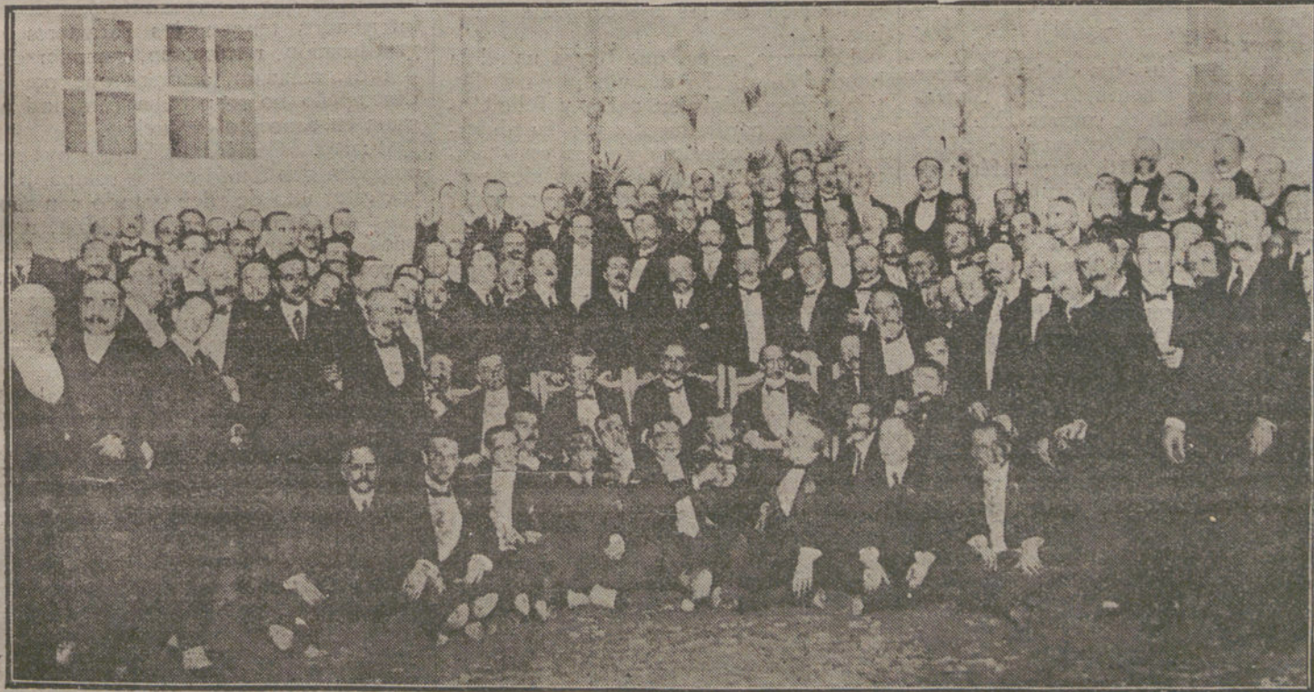
Grupo de asistentes al banquete con que anoche fueron obsequiados en el Ritz los ministros de Hacienda é Instrucción pública por la colonia catalana.