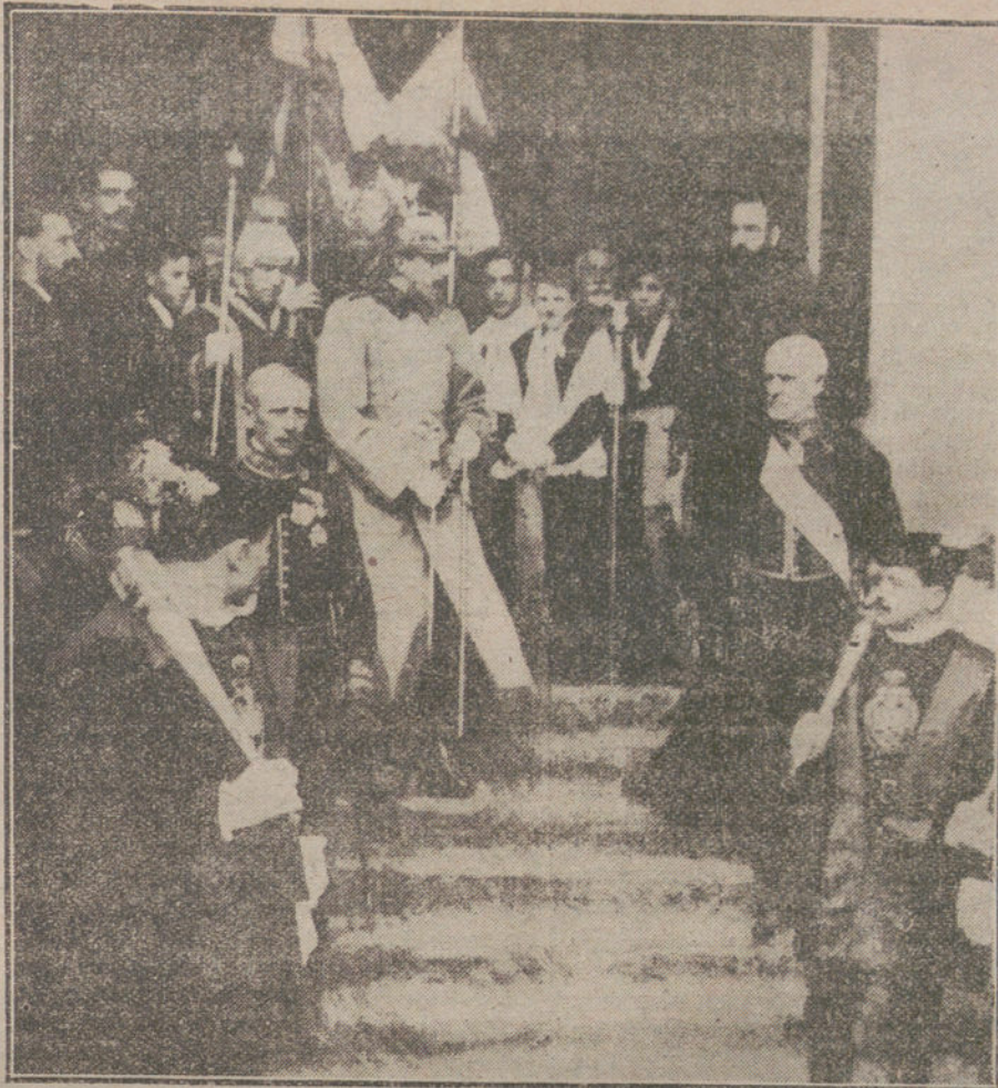
LA SOLEMNIDAD RELIGIOSA DE ESTA MAÑANA.—S. M. el Rey saliendo de las Calatravas, donde se ha verificado una función religiosa en sufragio de los académicos fallecidos.

Esa importante partida de aceite está dispuesta para ser exportada, y