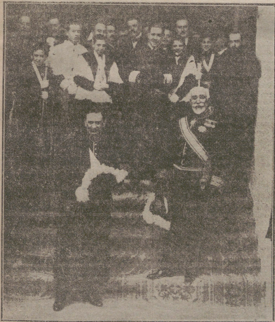
LA SOLEMNIDAD RELIGIOSA DE ESTA MAÑANA.—El presidente de la Real Academia, D. Antonio Maura, y el presidente del Consejo, Sr. García Prieto, saliendo de las Calatravas