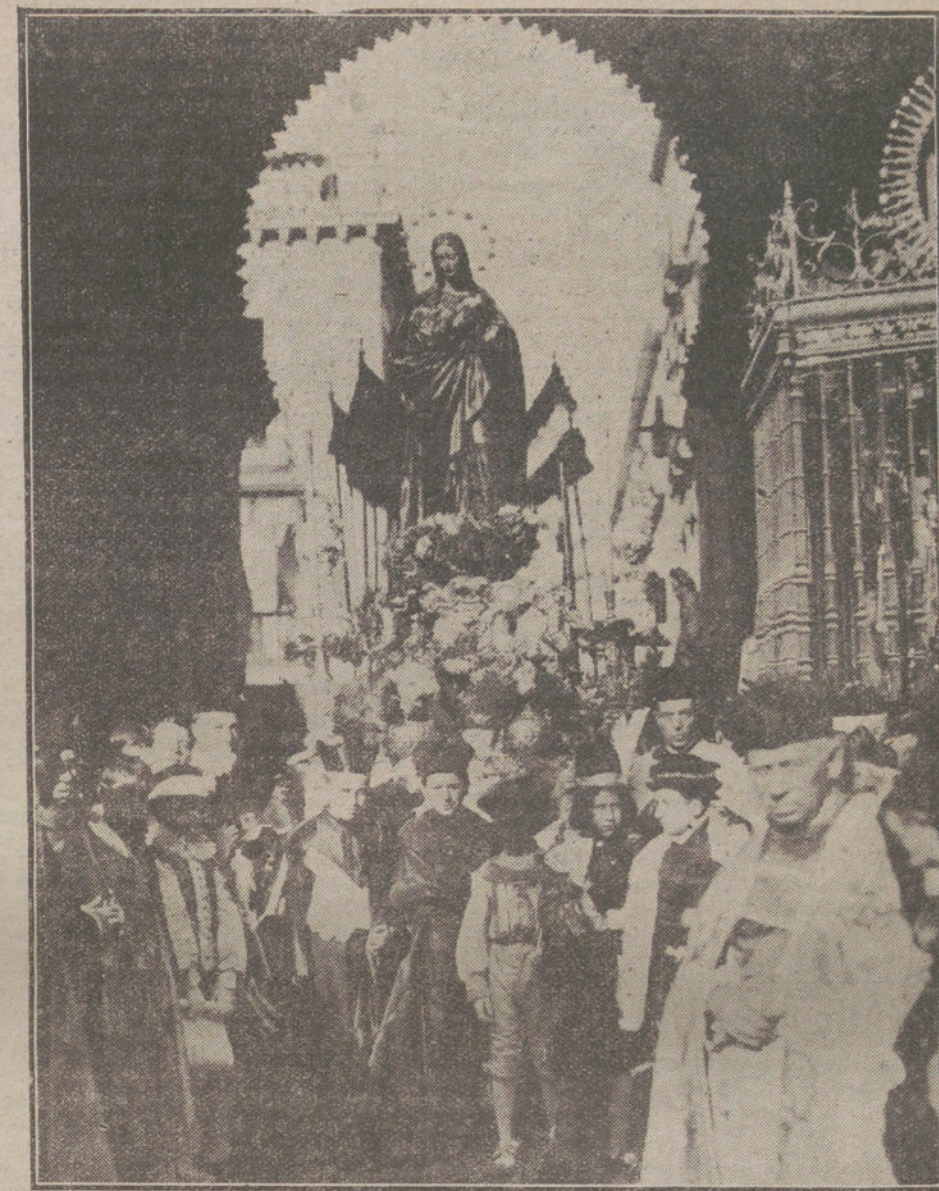
EL CENTENARIO DEL VOTO DE LA CONCEPCION EN SEVILLA.—La procesión a su paso por la tradicional Puerta del Perdón.

«América debe antes informarse bien del estado de cosas en Dinamarca, antes de poder esperar obtener provechos reales de la política emprendida. Un país sin carbón, hierro, aceite, algodón, madera, pastos, abonos y granos, de la extensión de Dinamarca, es imposible pueda sostener por sí misma su industria y agricultura. Como es na-