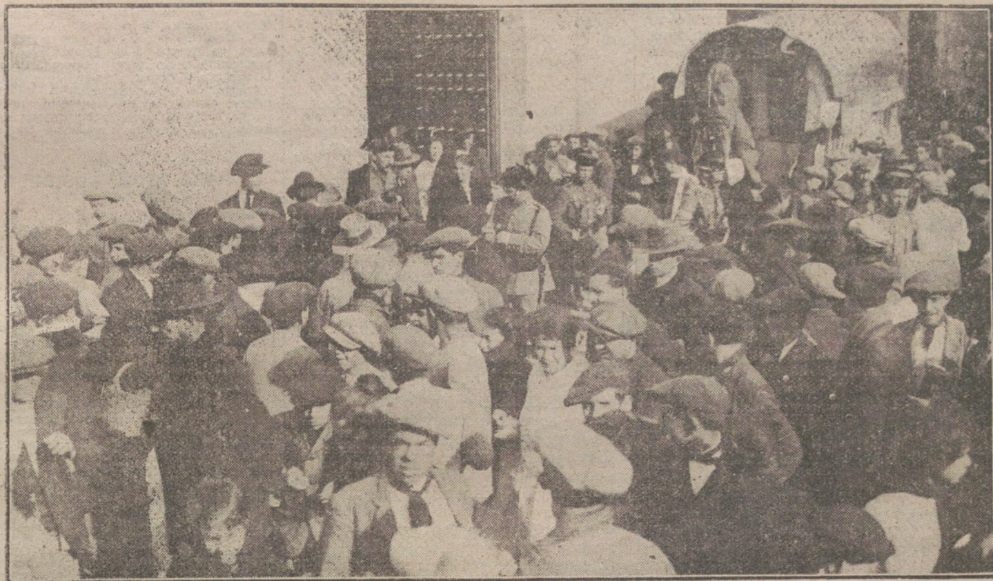
LOS SUCESOS DE SEVILLA.—La Guardia civil despejando los alrededores de la fábrica de Tena, donde los agitadores pretendieron suspender el trabajo.