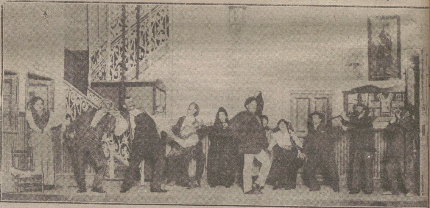
Una escena de «El ascensor», obra estrenada esta tarde en el teatro de la Infanta Isabel.

El diario francés «Matin» escribe: «Los partes oficiales alemanes admitidos ahora por Clemenceau en la Prensa francesa han provocado la intranquilidad en la opinión.