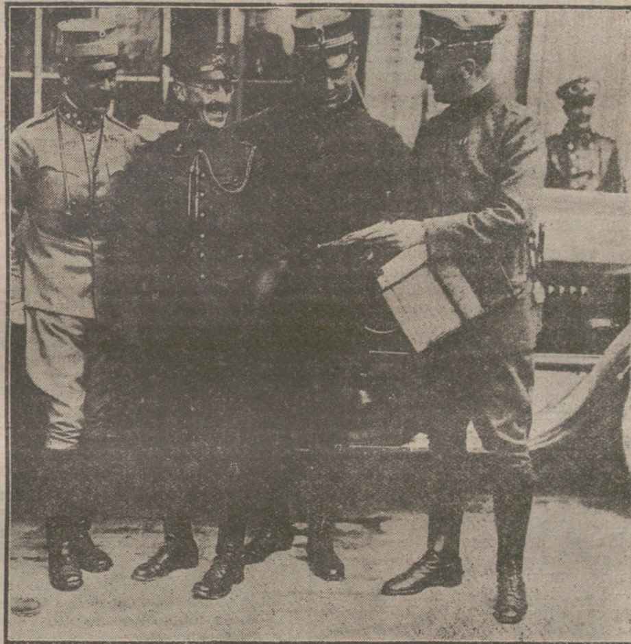
Los agregados militares de los países neutrales en el Ejército alemán durante una visita al frente francés.

He aquí por lo que siempre he confiado bien poco en la acción del regionalismo en Andalucía, y tengo escásima fe en el éxito que alcancen sus predicaciones en nuestra tierra. Se olvida, por los que piensan cosa distinta,