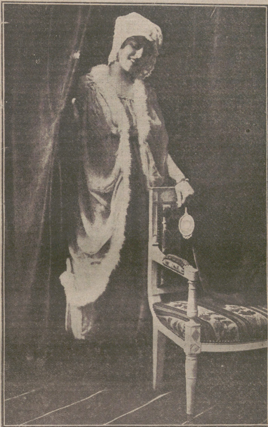
«Deshabillé» de satén, gasa y pluma, modelo de la casa Beryssa.