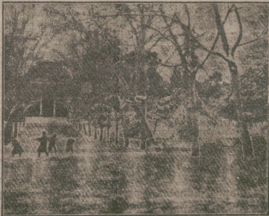
LA NEVADA DE ESTA MADRUGADA.— Un aspecto del Retiro en las primeras horas de la mañana.

Fué rechazada. Entretanto, nuestra respuesta á la Nota del Papa ha definido nuevamente nuestro punto de vista. En el momento en que recibo la noticia de que la tregua convenida con nuestro vecino de Oriente se ha convertido en un armisticio formal, me muestran el discurso del primer ministro inglés. Este discurso es la respuesta del actual Gabinete inglés á la Nota del Papa. Nuestro camino en Occidente está, por tanto, claro. No Lloyd George, sino la Historia, es el juez del mundo. Su juicio podemos esperar hoy, como el 2 de Agosto de 1914 con serenidad.