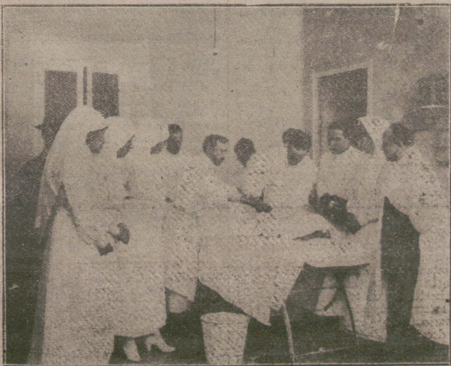
CURSO DE PRACTICAS DE LAS DAMAS DE LA CRUZ ROJA ESPAÑOLA. presenciando una operación en el Hospital Militar de Carabanchel.