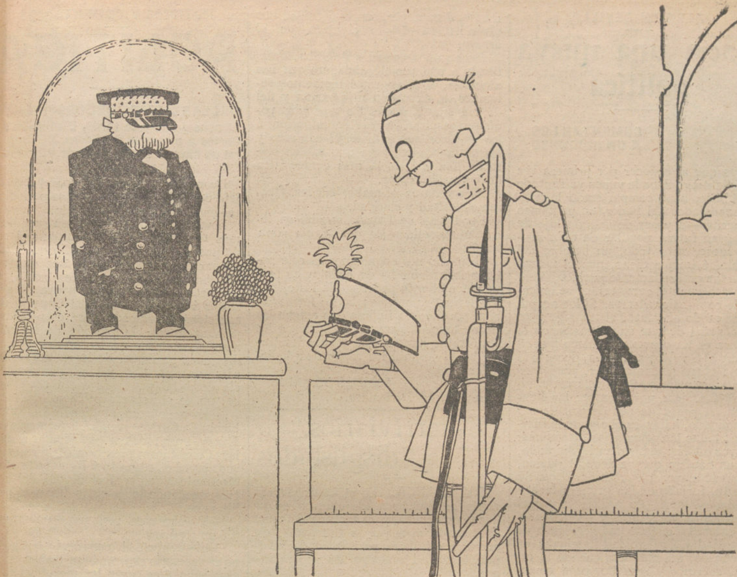
LA ORACION DEL SOLDADO A ti llamamos, á ti suspiramos, en ti confiamos...