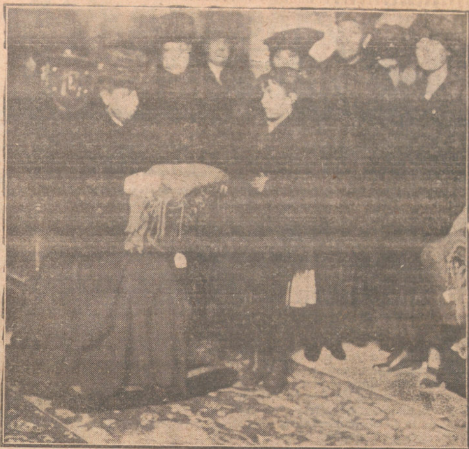
S. M. la Reina Cristina durante el reparto de ropas a los pobres de la parroquia de la Almudena, acto verificado ayer en aquel templo.

El día 16 del corriente la presión enemiga se hizo sentir solamente en la izquierda de los italianos, en el extremo occidental y al final del valle del Brenta; ver el gran esfuerzo se concentró casi