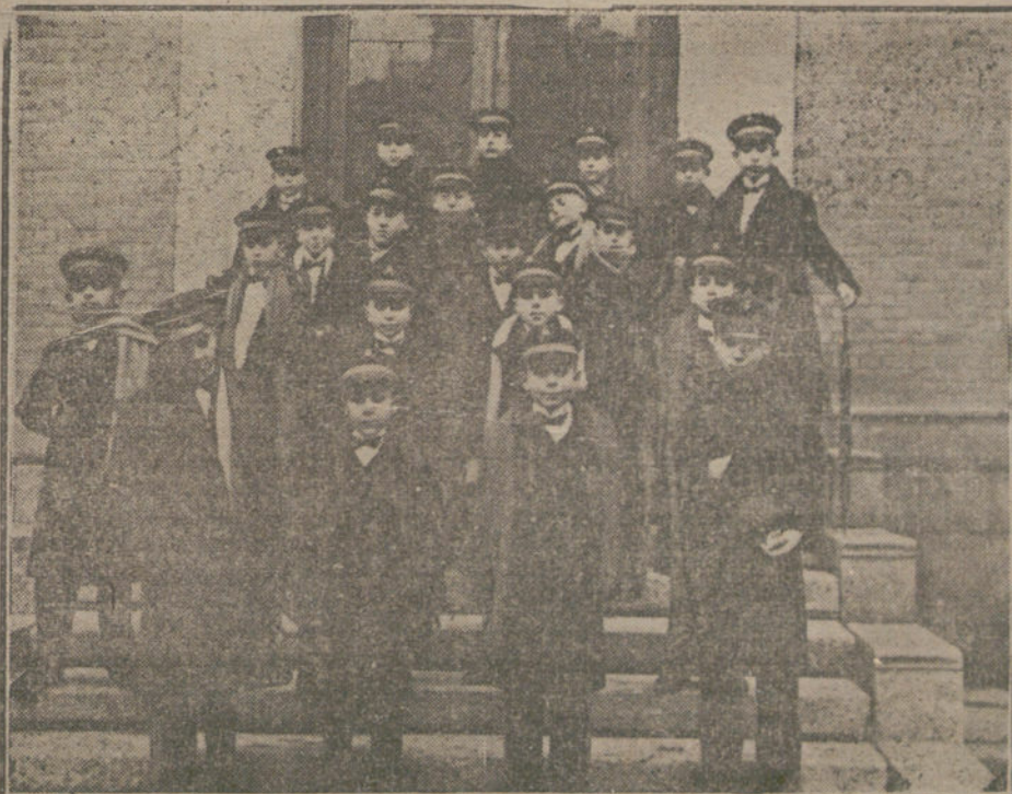
Grupo de niños del Colegio de San Ildefonso que han sacado las bolas de los premios.

Y este sentido, ó de pie, como ustedes quieran, pero importaba mucho al informador descargar su conciencia, hasta el año que viene, en tal día como hoy, si Dios nos da á todos vida y salud, va á dar no el añorado «gordo».