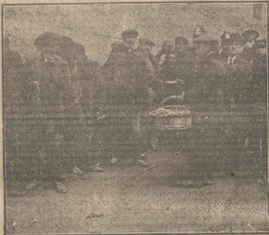
Los primeros puestos de la típica cola.