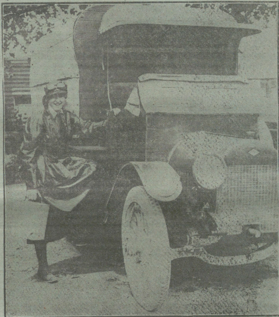
LAS MUJERES EN LA GUERRA.—Una mujer «chauffeur», de las que prestan servicio en las ambulancias de la Cruz Roja en el frente inglés.

He aquí el más grave mal que pesa sobre nuestra acción en Marruecos: la indiferencia con que el pueblo abandona este importantísimo problema que tanto afecta a la independencia y al porvenir de nuestra Patria. Ni los debates del Parlamento, ni las campañas de la Prensa bastaron a mover la conciencia del país. El país parecía no querer enterarse de que estamos obligados a cumplir en África un destino histórico y a defender nuestra propia soberanía