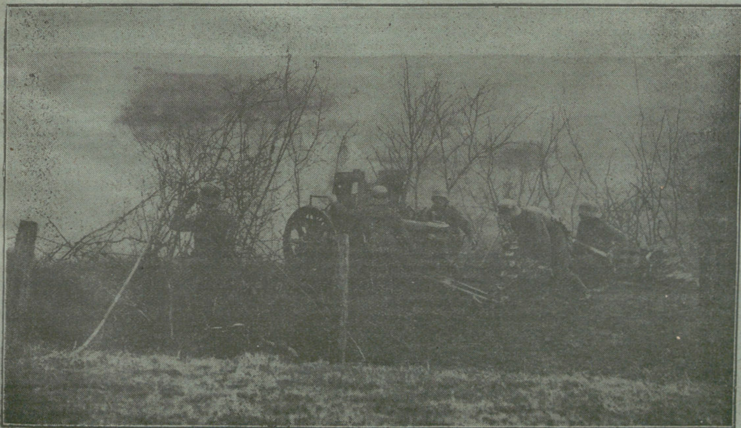
LA GUERRA EN FRANCIA.—Artillería alemana durante un combate en la Champaña.

Jaime.—Tengo la certeza. Que no me amaba, que mi fuego no logró comuni-