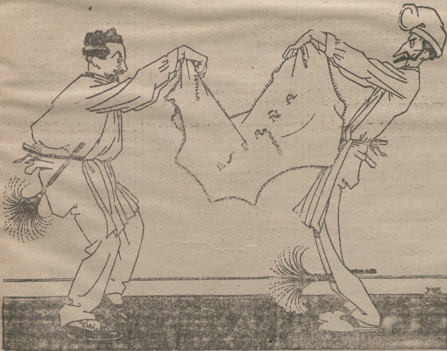
LAS PROPAGANDAS POLITICAS

Se ignora si se trata de un accidente o de un intento de suicidio.