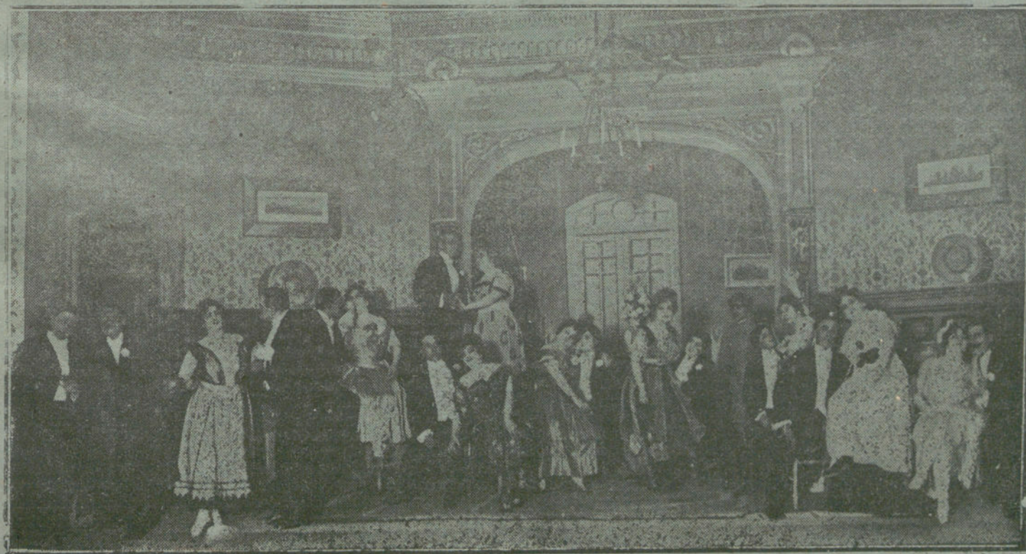
Una escena de «El Torbellino», obra estrenada anoche en el teatro Cómico.

El público celebró primeramente con carcajadas la fuga de «Monterilla»; luego le obsequió con una silba mayúscula, al