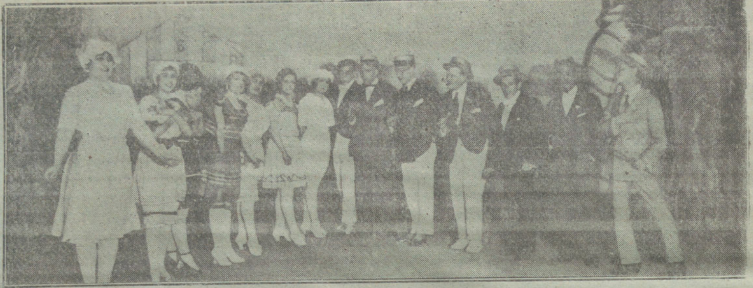
Una escena de «La última astracanada», que se estrenó en el teatro Martín.

A los opositores que no acudan a este segundo llamamiento se les considerará r el Tribunal como excluidos definitivamente de las listas.