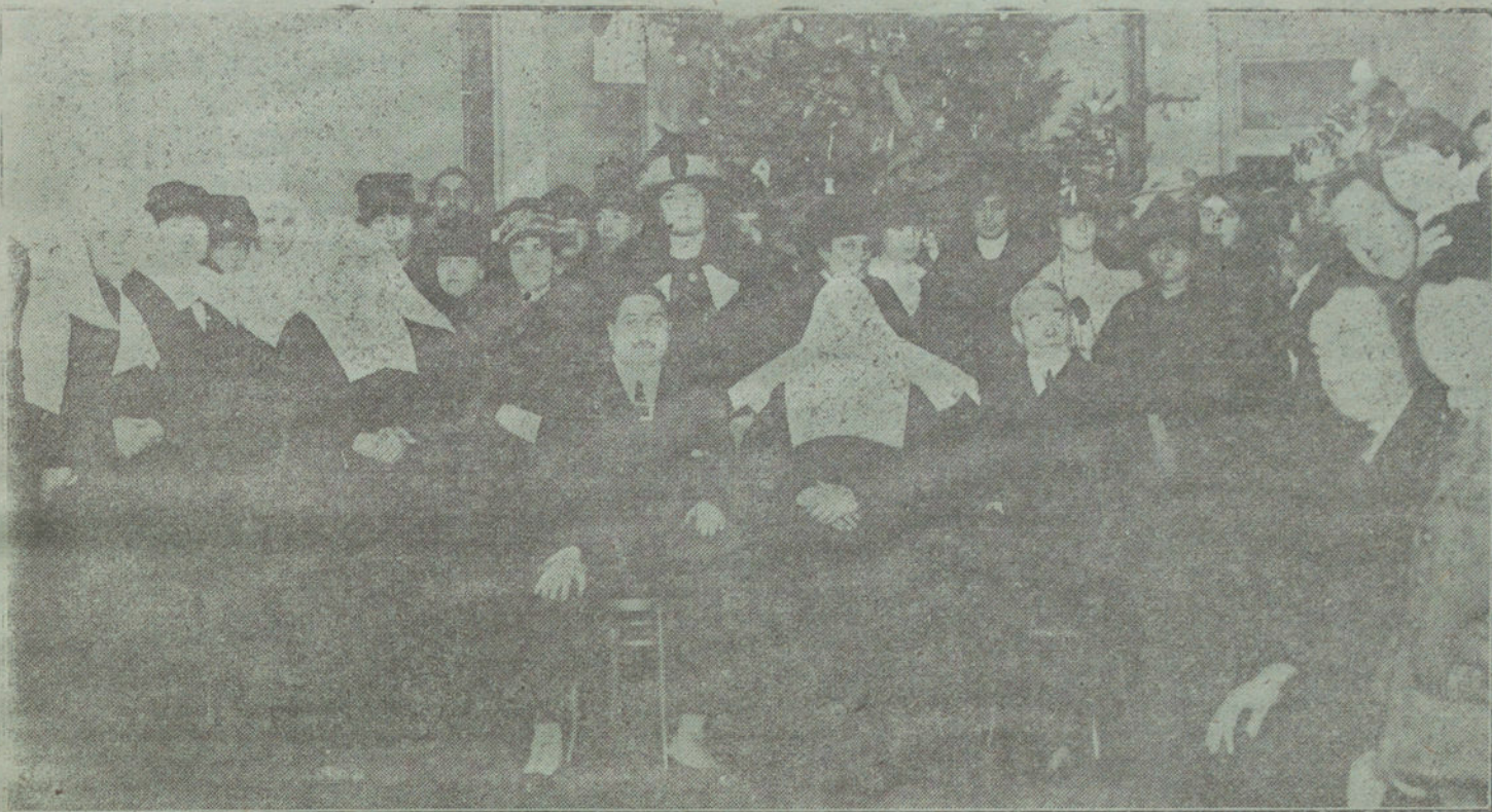
LAS FIESTAS DE NAVIDAD EN SAN SEBASTIÁN. —El alcalde, las otras autoridades locales y señoritas de la aristocracia que repartieron juguetes a los niños del Hospital.

el terreno económico de sus aliados europeos. América renuncia a sus propios empréstitos de guerra, para también cerrarle a la Entente el mercado americano de empréstitos. América, en vista de los acontecimientos en Rusia é Italia, siente temores por su dinero.