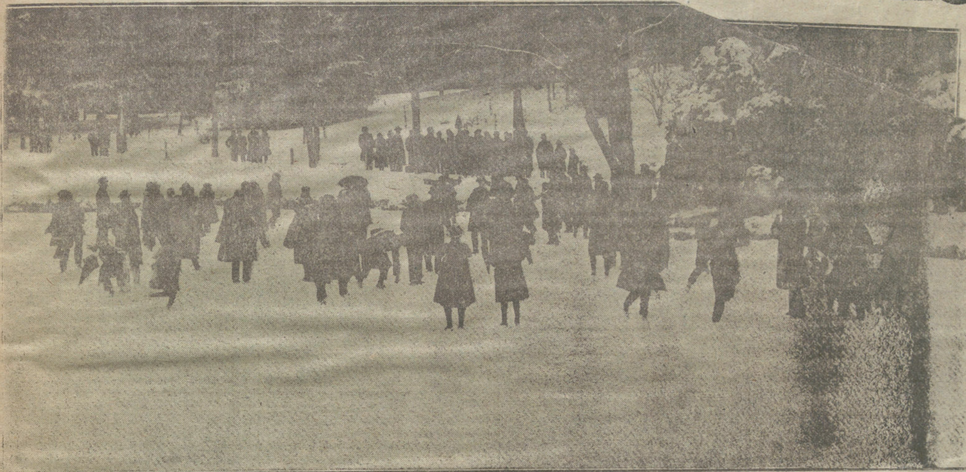
MADRID NEVADO. Grupo de deportistas patinando en el estanque pequeño del Retiro.

El alcalde, al recibir esta mañana a los periodistas, les manifestó que algún periódico, involuntariamente, desde luego ha incurrido en alguna inexactitud al dar cuenta de la recogida de la nieve por los obreros municipales.