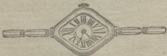
Núm. 1.—Oro de ley 18 quilates, forma rombo, máquina de precisión, pulsera extensible.

Formas modernas, prácticas y elegantes Máquinas de alta precisión. Regulación perfecta Garantía efectiva de buena marcha por cinco años