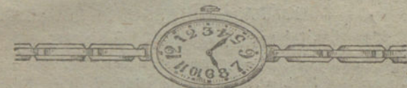
Núm. 5.—Oro de ley 18 quilates, forma ovalada, áncora de precisión, pulsera extensible.