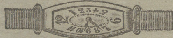
Núm. 12.—Oro de ley 18 quilates, forma «tonneau» alargado, áncora de precisión, pulsera de moiré.