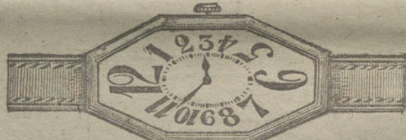
Núm. 10.—Oro de ley 18 quilates, forma «tonneau» facetado, áncora 15 rubíes, pulsera de cuero.