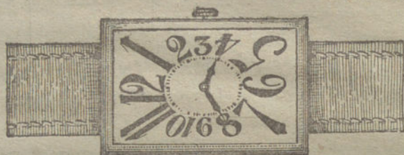
Núm. 8.—Oro de ley 18 quilates, forma rectangular, áncora 15 rubíes, pulsera de cuero fino.