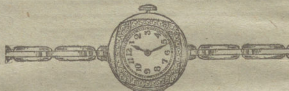
Núm. 14.—Platino con brillantes y zafiros, áncora de precisión, pulsera extensible.