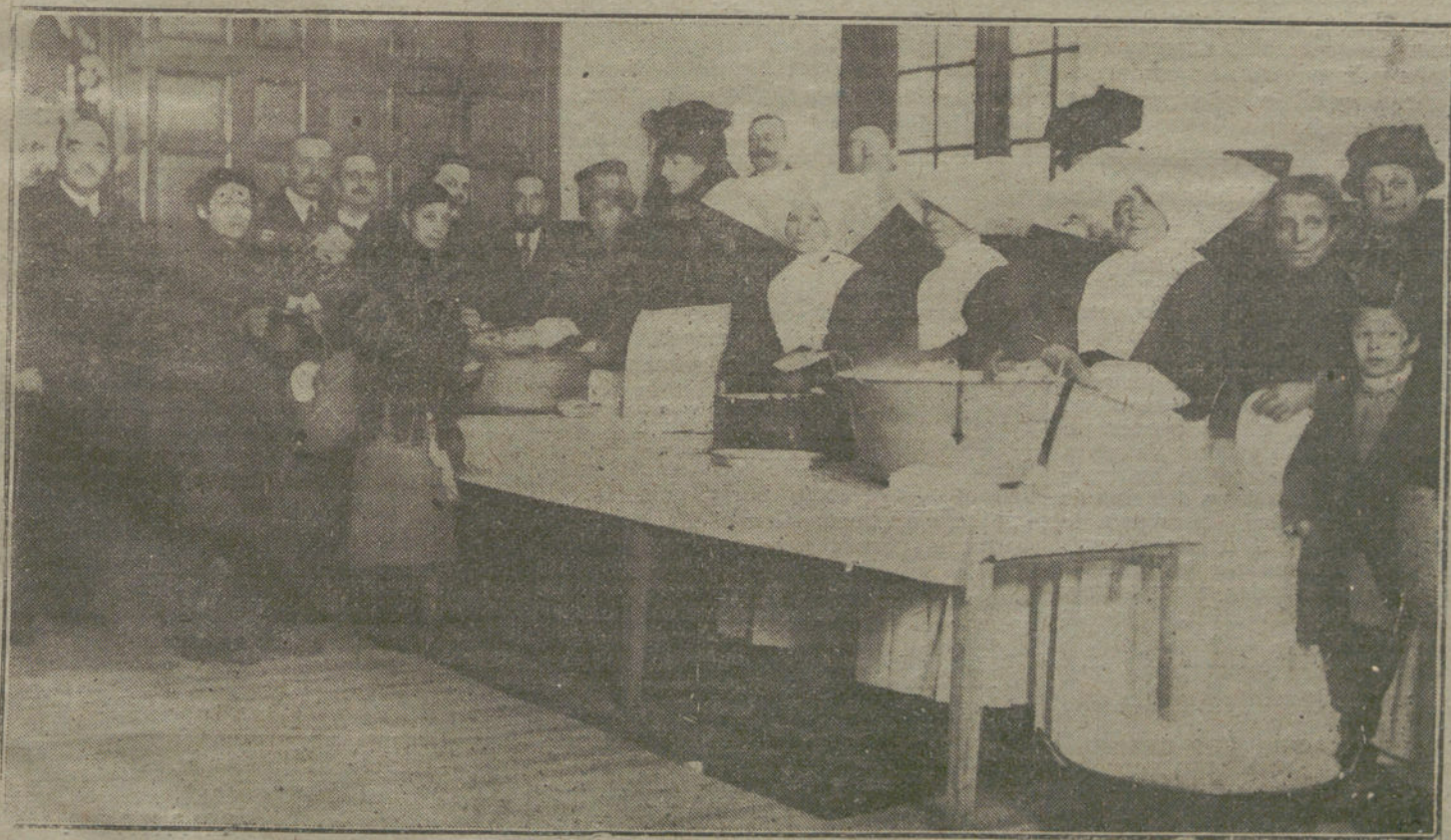
S. M. la Reina repartiendo comidas a los pobres en el Colegio de Santa Isabel.

Pero cuando la historia del genio andaluz es interesante, es a partir de las invasiones. Su incompatibilidad con el genio sombrío de Cartago provoca la emigración en masa de pueblos helenotartésicos, colonizadores de distintos lugares de la Península, antes de la traición de la Corte tartésica de Cádiz. Cádiz, asegura un escritor griego, viste a Melkorte con los atributos del Hércules de Grecia. Tartasia, que repugna a Cartago, acoge a Roma. Vienen patricios a poblar la «pretoria más romana de todas», y Andalucía recibe tales infusiones de sangre latina, que ha de construir una ciudad para los nuestros. Y Andalucía, como si fuera Roma misma, aguanta la enemiga a Roma de su sistema, y se pugna a Celtiberia, y es tan romano su pueblo, que las legiones hacen causa común con él para depone a un pretor puesto por Roma (Longinos) en vez de proteger su rapacidad como en las demás regiones. Es que Roma heredó a Grecia a través de Roma. Las obras del arte romano en el depósito del Guadalquivir, dice un historiador asturiano, están caracterizadas por las mismas influencias que las determinadas du-