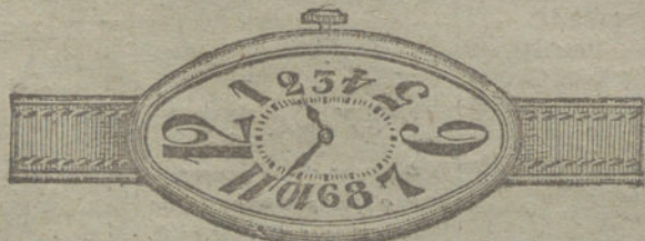
Núm. 11.—Oro de ley 18 quilates, forma ovalada, áncora 15 rubíes, pulsera de cuero.