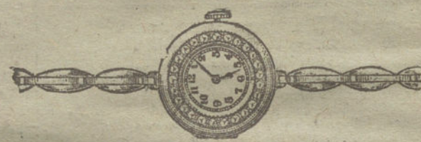
Núm. 15.—Platino con orla de brillantes, áncora de precisión, pulsera extensible.