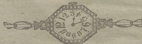
Núm. 17.—Platino con decoración de brillantes y diamantes, áncora, pulsera extensible.