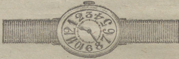
Núm. 7.—Oro de ley 18 quilates, forma ovalada, máquina especial, pulsera de moiré.