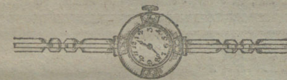
Núm. 6.—Oro de ley 18 quilates, con ocho brillantes sobre platino, pulsera extensible.