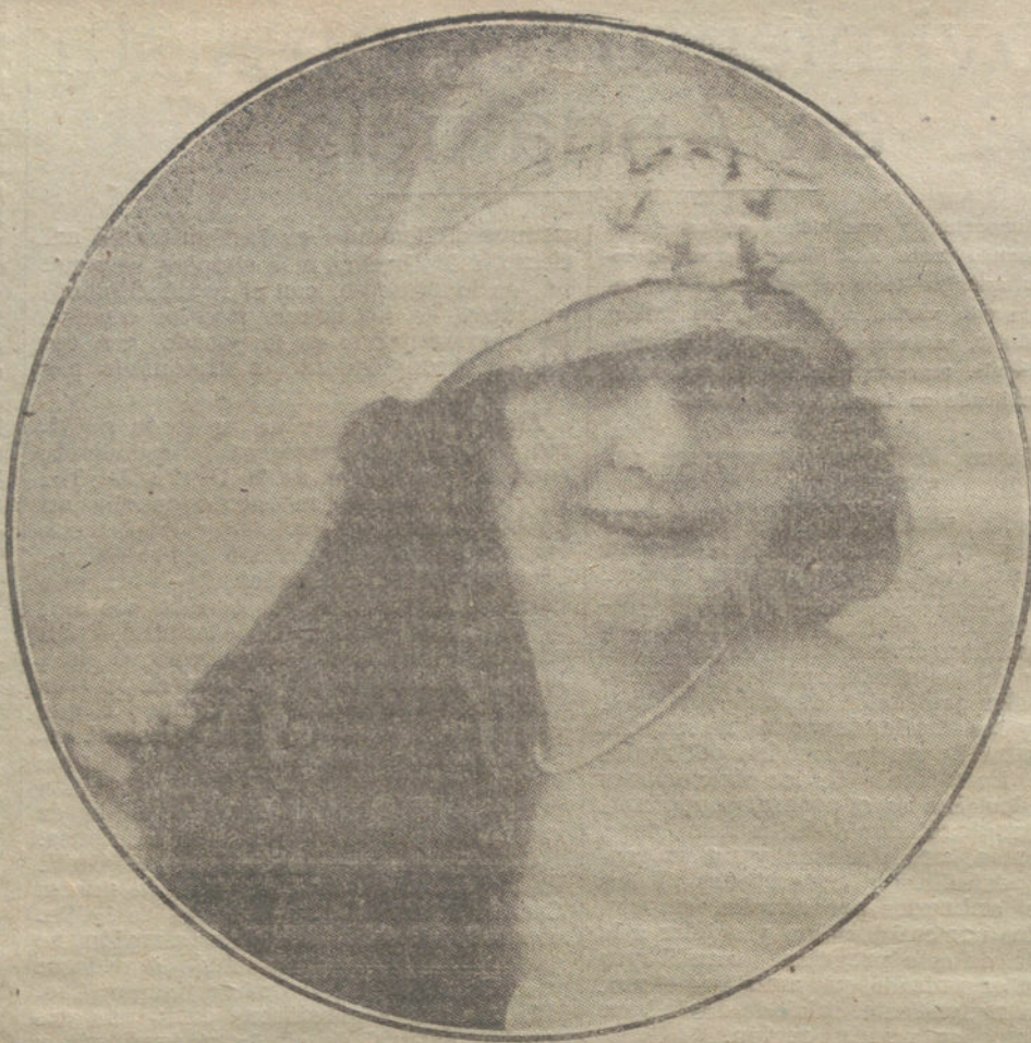
Elegante casquete de raso y gasas de seda bordado a flores en colores fuertes, mo- delo para niñas, presentado por la casa Hélène.