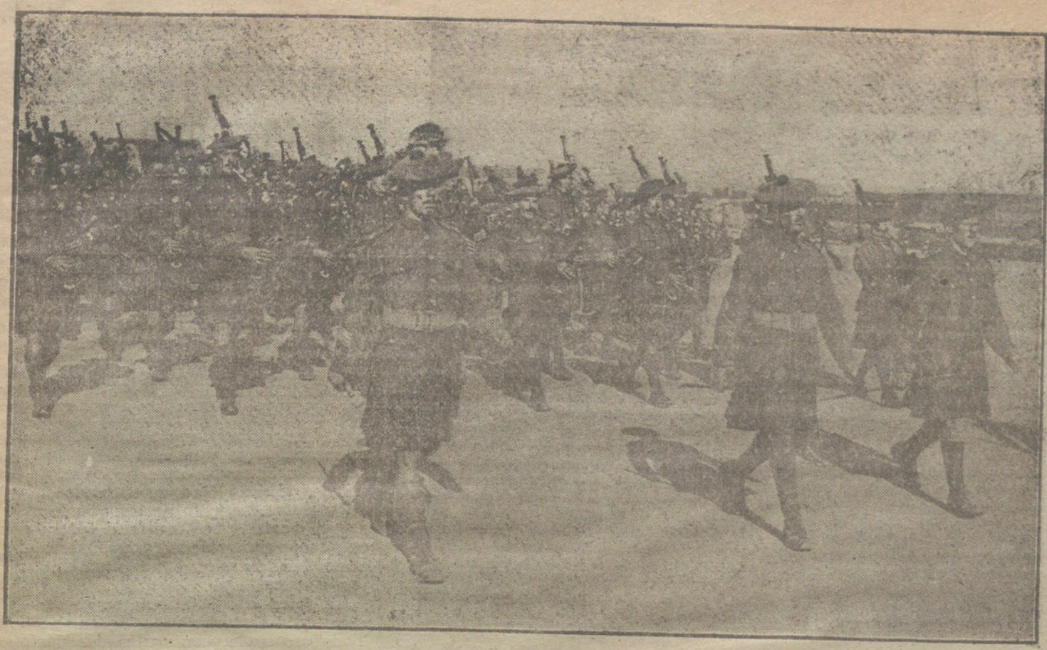
LO PINTORESCO DE LA GUERRA. Gaiteros del Ejército escocés, en marcha hacia las primeras líneas.

Los comisionados salieron persuadidos de que cuando se estudie lo modesto de sus pretensiones, en atención al vital interés de la cuestión, el Sr. Ventosa, como antes el Sr. Bugallal, accederá a adajar un poquito la cuerda que ahora