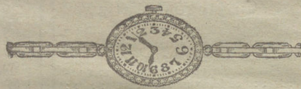
Núm. 13.—Platino y oro de ley con brillantes y diamantes, áncora de precisión, pulsera extensible.