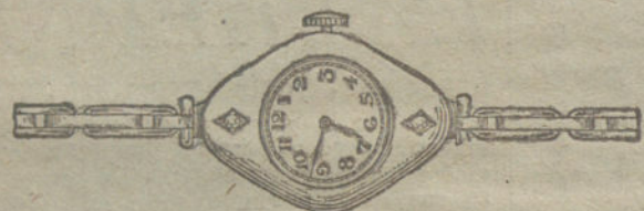
Núm. 2.—Oro de ley 18 quilates, con dos brillantes, máquina especial, pulsera extensible.