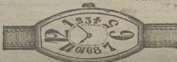
Núm. 9.—Oro de ley 18 quilates, forma «tonneau», áncora 15 rubíes, pulsera de cuero.