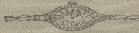
Núm. 18.—Platino con orla de brillantes y guarniciones de diamantes, pulsera extensible.