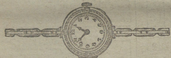
Núm. 4.—Oro de ley 18 quilates, con cuatro brillantes y zafiros, áncora de precisión, pulsera extensible.