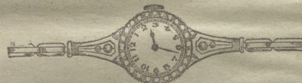
Núm. 16.—Platino con orla y guarniciones de brillantes, áncora de precisión, pulsera extensible.