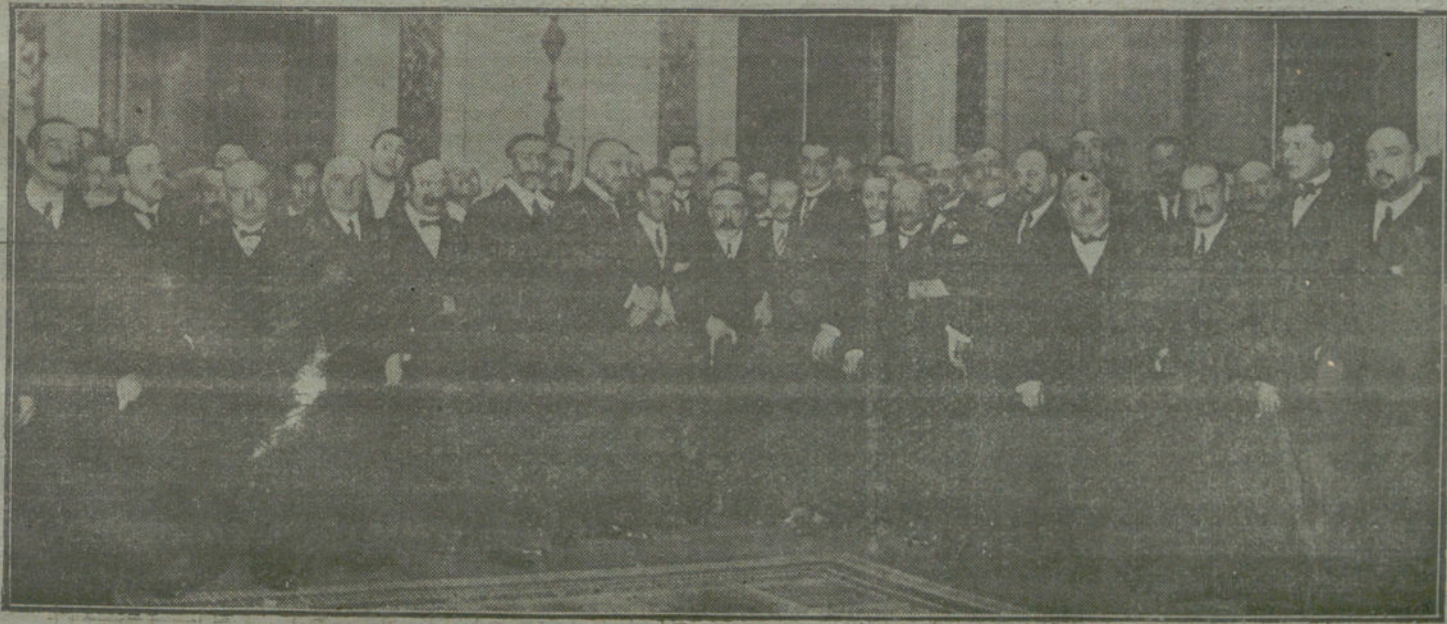
Acto de la constitución del nuevo Ayuntamiento de Madrid.

Otro que mientras haya concejales tan poco escrupulosos como esos liberales de Barcelona; mientras existan políticos traidores que, con la capa de monárquicos, laboran del brazo de los republicanos mientras queden gentes que vendan su conciencia política por un puñado de cargos retribuidos, no podrá decirse que la designación de alcalde es obra del pueblo, sino consecuencia del immoral contubernio de desleales y despechados.