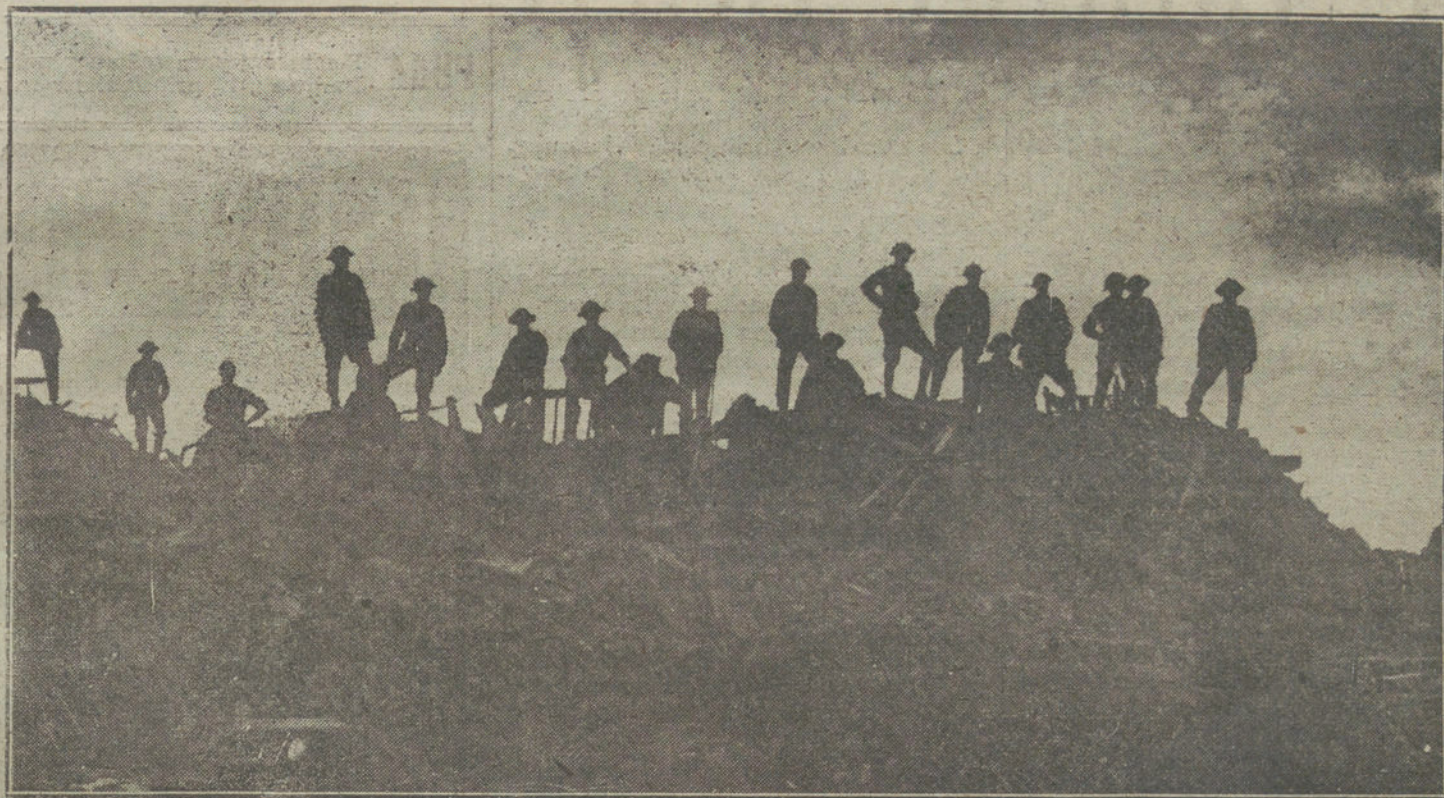
LA GUERRA EN FLANDES. Tropas inglesas sobre unas ruinas convertidas en nueva posición.

cia de la nación, porque se ha plegado mansamente a la ilegalidad del bloqueo inglés, renunciando a comerciar con otros países como Holanda y los escandinavos, y, en cambio, sanciona de modo oficial el riesgo que han de correr las tripulaciones españolas, aventurándose a los peligros de la zona contraboleada por los submarinos alemanes, a la vez que de modo oficial también suma la cooperación de nuestra flota mercante, poniéndose de modo directo al servicio de los aliados.