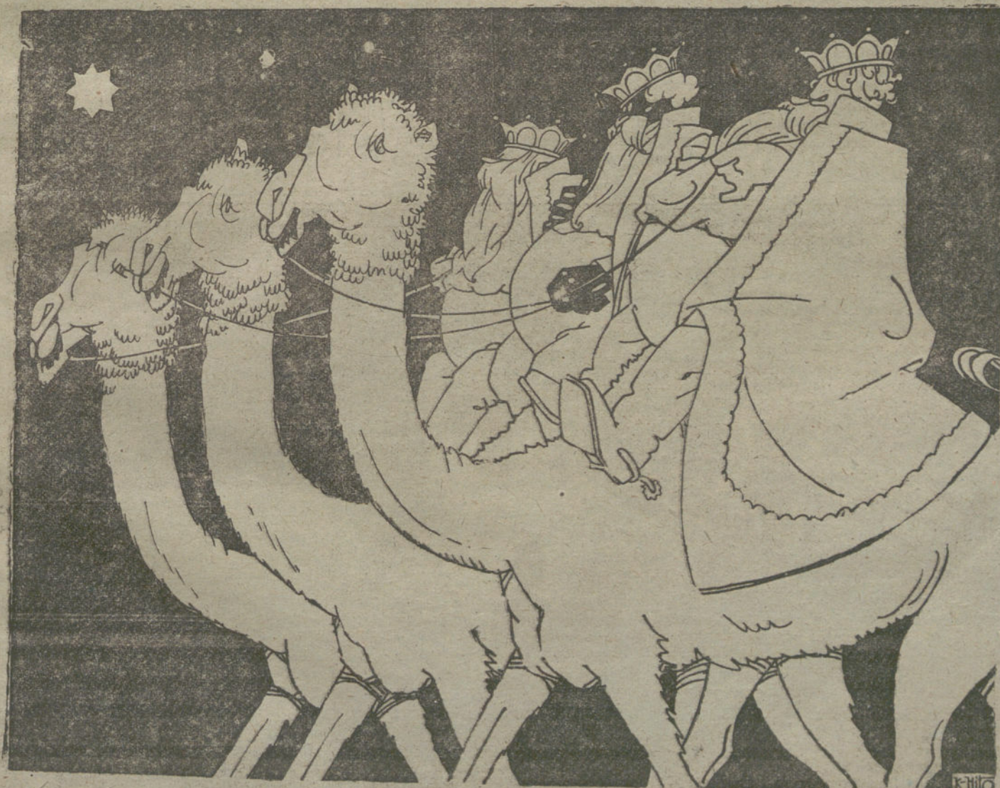
LOS REYES MAGOS VIENEN A TIENTAS

¿Hasta cuándo van a seguir tolerándose los abusos a que somete la Compañía de Electricidad a sus abonados?