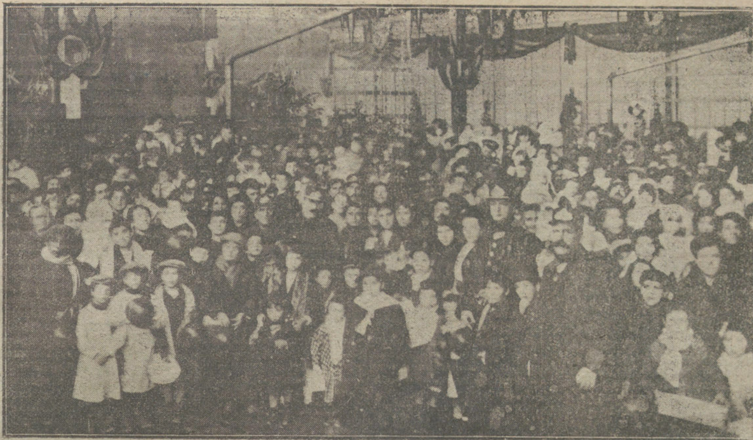
EL DIA DE REYES.—Reparto de juguetes a los hijos de los empleados de la Compañía de tranvías, verificado por la Dirección, según tradicional costumbre.

Marquesas de Castelar, Ciudad Rodrigo, Santa Cristina, Mina, Bendaña, Viana, Rafal, Salar, Peñafiel y Santa Cruz.