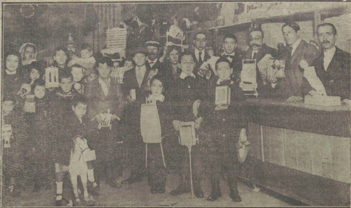
EL DÍA DE REYES.—Reparto de juguetes verificado durante el día de hoy por el Centro de Hijos de Madrid.

En nuestra infancia teníamos que contentarnos con el Guignol primitivo y estacazo y tonto tieso. Mas esas