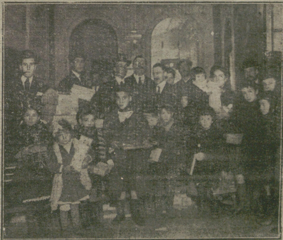
EL DIA DE REYES. Reparto de juguetes verificado esta mañana por iniciativa del Centro Mav.ista en el teatro de Rómulo.

Por lo que se refiere a que la maniobra de los sargentos al pedir que se publique la documentación es hábil, porque de antemano saben que nunca se han lanzado a la publicidad, en el momento de ser hallados, los escritos referentes a una conspiración, incluso porque en los primeros instantes se pueden malograr determinadas gestiones; pero en su día quedará patente que el aserto oficial no es, como se dice, una superchería.