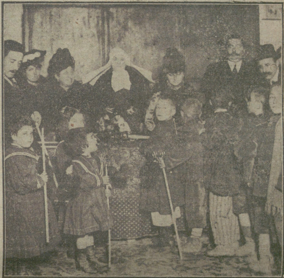
EL DIA DE REYES.—La condesa de San Rafael presidiendo el reparto de juguetes á los asilados de Vallehermoso, verificado ayer tarde.

El incidente de las Juntas de brigadas ha dado lugar á unas medidas enérgicas que toda la nación aplaude con la limitadísima excepción de los agitadores que han visto frustrados sus propósitos. La actitud del Gobierno ha contribuido poderosamente á tranquilizar al país, demostrando, contra lo que pudiera sospecharse por la diversidad de elementos que lo integran, que es un