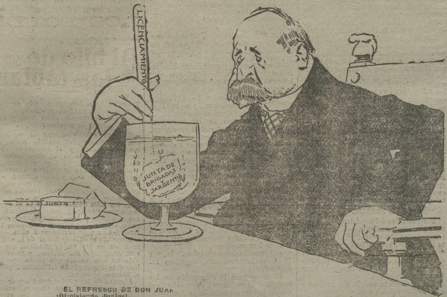
EL REFRESCO DE DON JUAN (Disolviendo Juntas)

El Cuerpo electoral no podrá manifestarse libremente hasta que no desaparezcan todas las fibras de la red que lo tenía preso. Y como la trabazón era compacta y firme no es de esperar que se rompa en tan pocos días. Para el 10 de Febrero está anunciada la proclamación de candidatos.