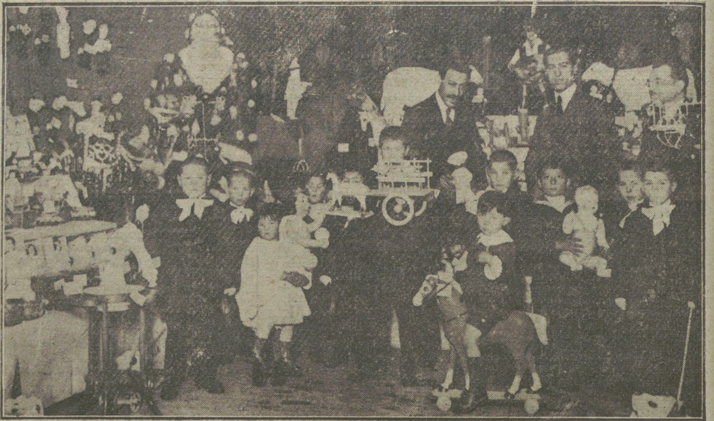
EL DIA DE REYES. Aspecto de los salones del Fomento de las Artes durante el reparto de juguetes verificado ayer tarde en dicho Centro.

OVIEDO. En el teatro Jovellanos se celebró un festival benéfico, organizado por la Juventud maurista, para repartir juguetes y vestidos á los niños que asisten á las clases que sostie-