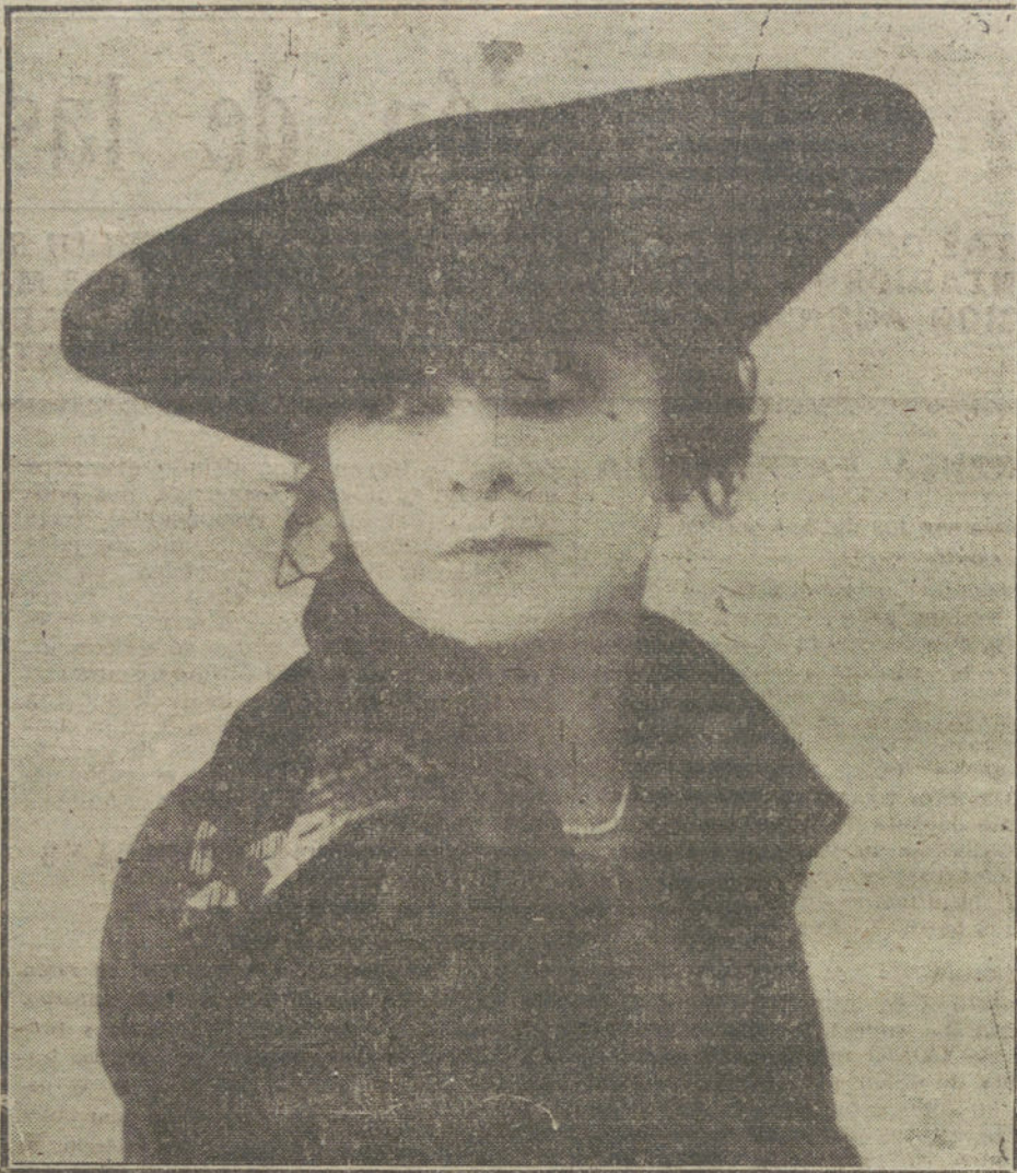
Sombrero de terciopelo negro sin ningún adorno, de forma muy original, modelo de la casa Harlette.