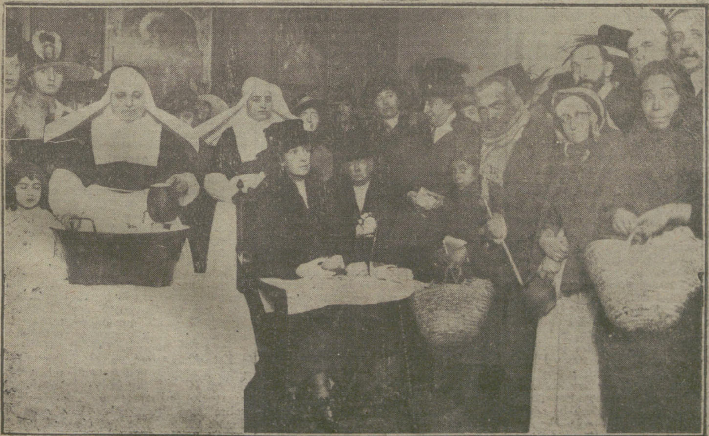
S. M. la Reina Victoria y S. A. la Infanta Doña Isabel repartiendo comidas á los pobres en el Hospital de inválidos «El Carmel»