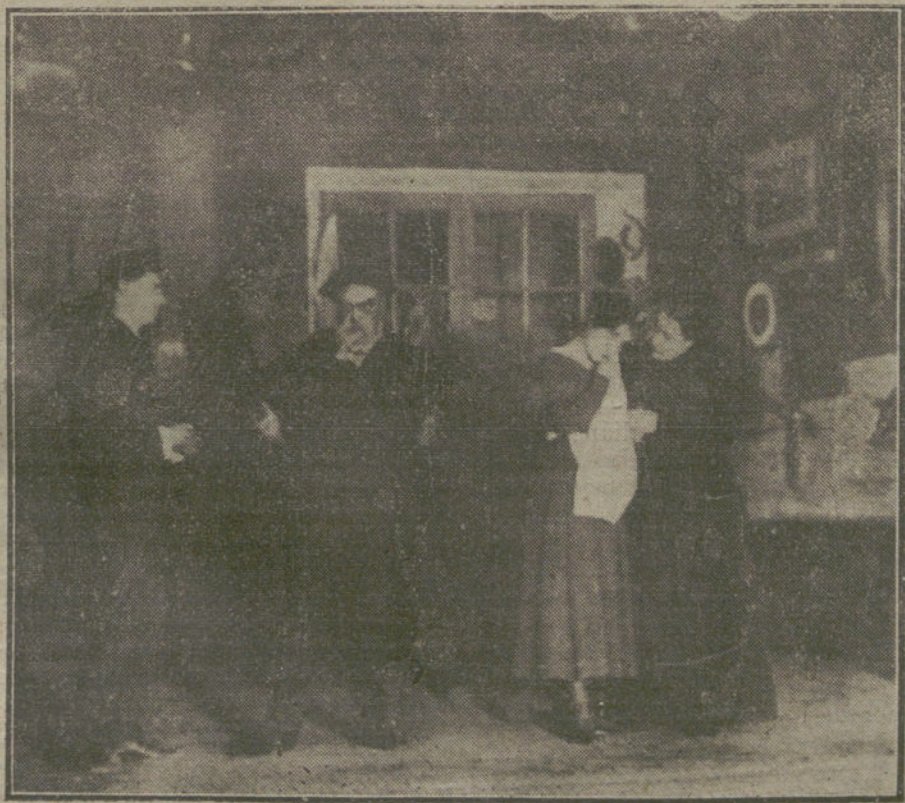
Una escena de «En casa del anticuario», obra estrenada anoche en el teatro de Esclava.