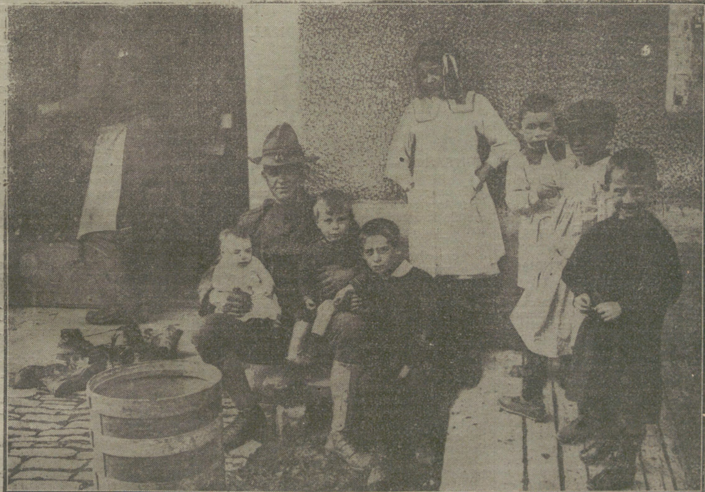
LA GUERRA Y LOS NIÑOS.—Soldado americano en las cercanías de un campamento del Marne, acariciando a niños franceses.

«Es posible velar con frases más patentes el hecho de que aquellas provincias habrán, en lo futuro, de constituir realmente una parte del Imperio británico bajo un nombre u otro?»