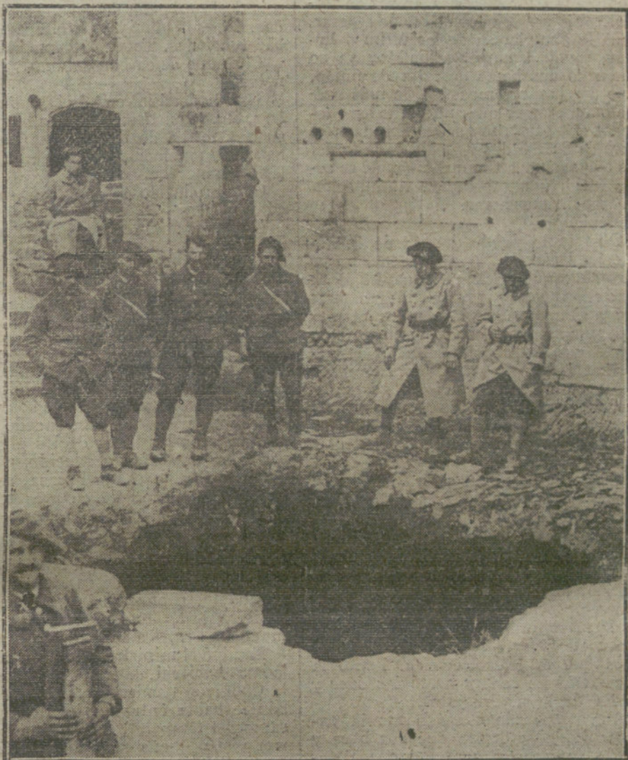
Huero producido por un proyectil en un patio de una casa, en el Aisne.

Somos enemigos irreconciliables de lo caduco, de lo viejo, de lo gastado, de todo cuanto entorpeció el progreso material del país; y esta clara actitud nos hace aparentar en algunos momentos un ministerialismo que rechazamos sinceramente. Ha llegado la ocasión de aplaudir al Gobierno por la entereza demostrada en el asunto militar y por la corrección con que ha procedido en el delicado asunto del decreto de disolución. Cuando llegue el momento de atacarle, tampoco queremos ser los últimos.