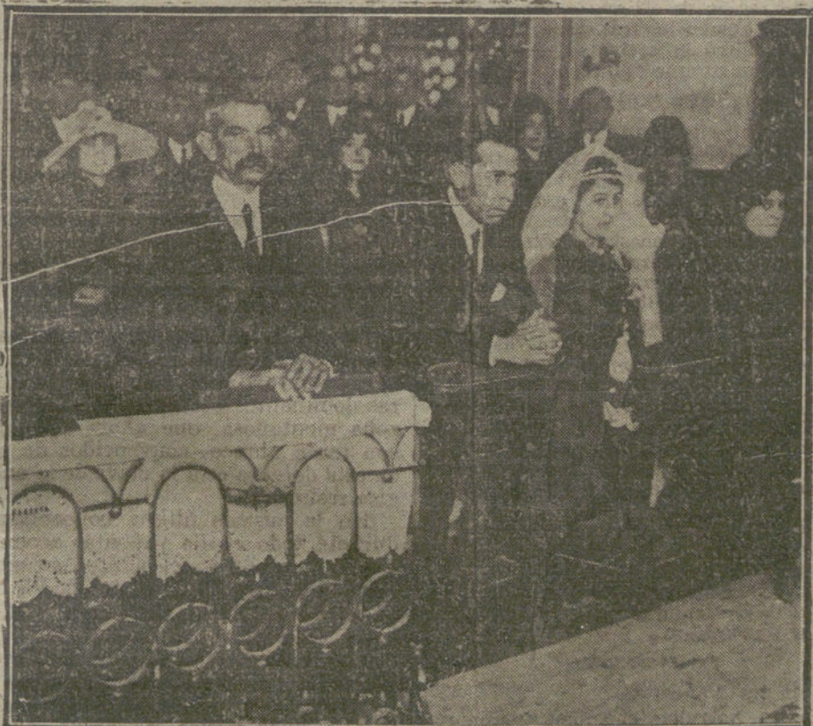
Boda del diestro Celita, celebrada este medio día en la iglesia de Nuestra Señora de las Angustias.

Insólito es decir que deseamos al bravo Celita muchos y venturosos días de felicidad.