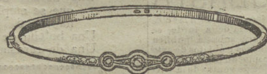
Núm. 3.—Tres brillantes y diamantes.