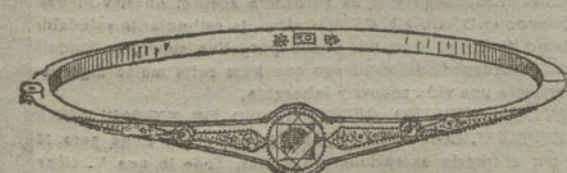
Núm. 18.—Tres brillantes y diamantes.