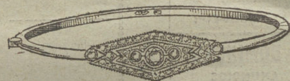
Núm. 9.—Tres brillantes y diamantes.