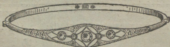
Núm. 10.—Cinco brillantes y diamantes.