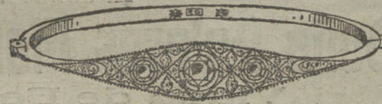
Núm. 14.—Tres brillantes y diamantes.