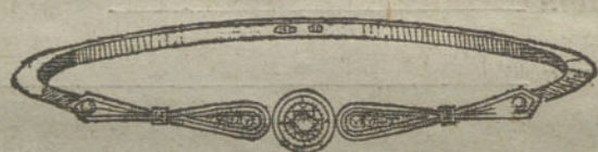
Núm. 8.—Un brillante y diamantes.