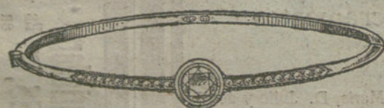
Núm. 16.—Veintiún brillantes.