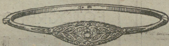
Núm. 7.—Tres brillantes y diamantes.