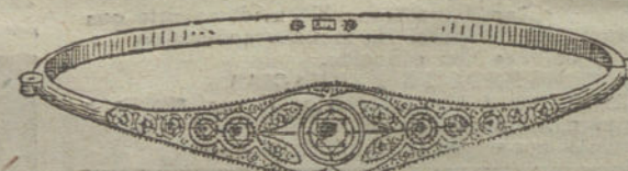
Núm. 12.—Cinco brillantes y diamantes.