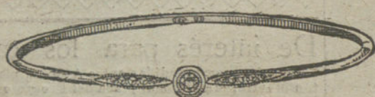
Núm. 1.—Un brillante y diamantes.