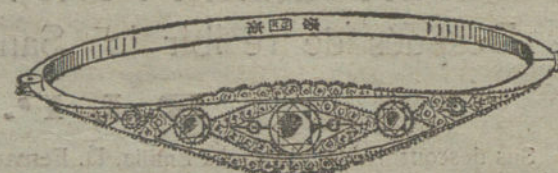
Núm. 17.—Tres brillantes y diamantes.