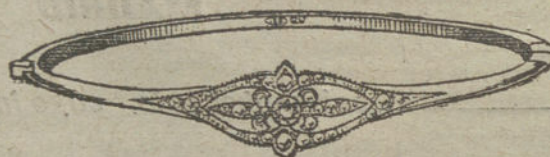
Núm. 5.—Un brillante y diamantes.