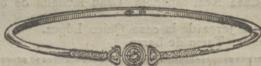
Núm. 2.—Tres brillantes y diamantes.