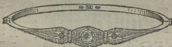
Núm. 13.—Tres brillantes y diamantes.