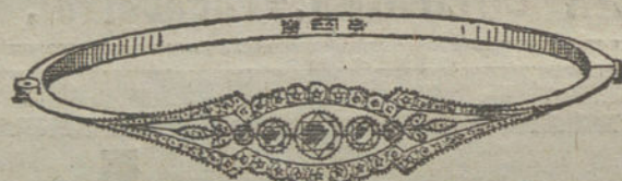
Núm. 11.—Cinco brillantes y diamantes.