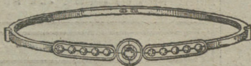
Núm. 4.—Un brillante y diamantes.