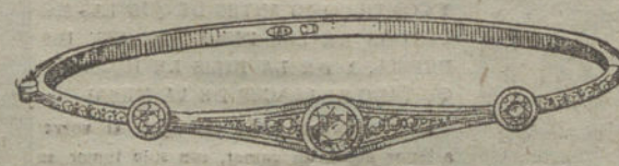
Núm. 15.—Tres brillantes y diamantes.