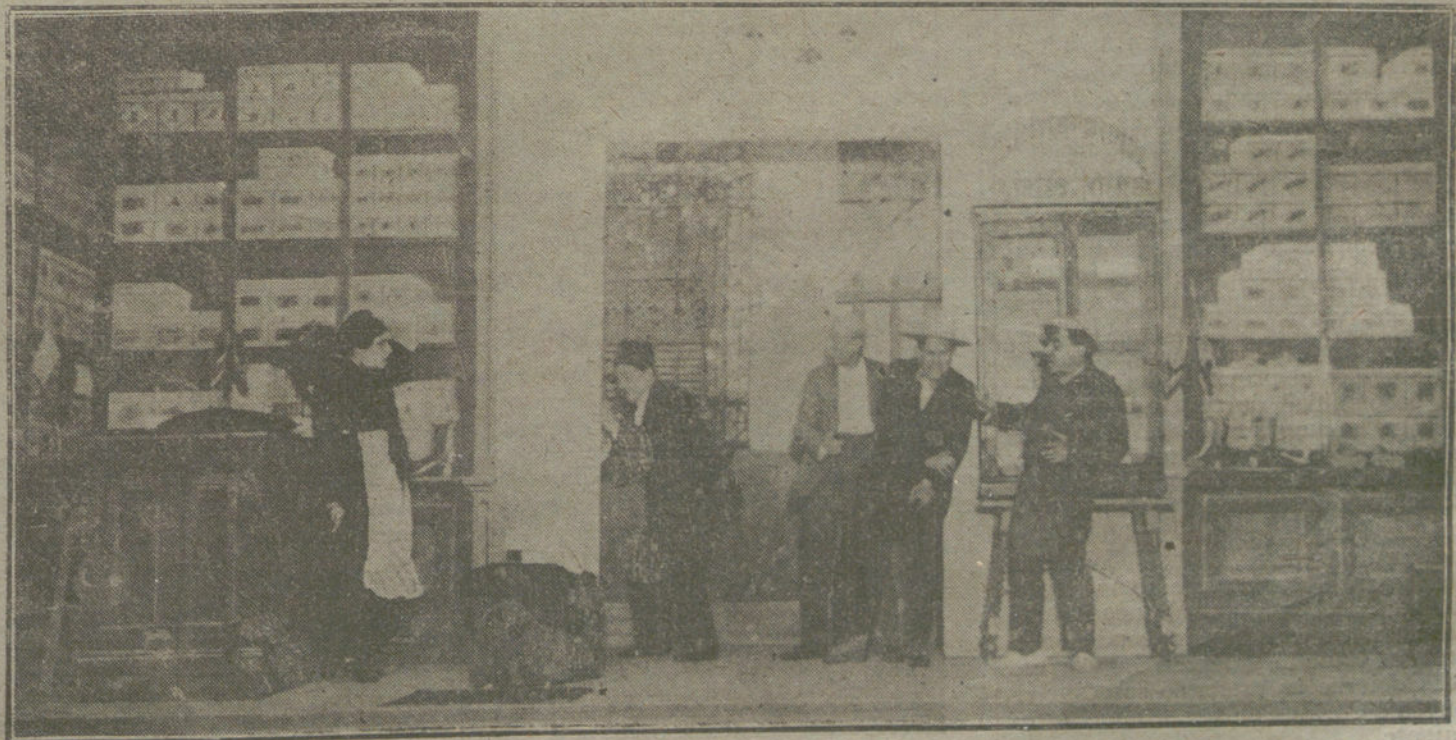
Una escena de la comedia «A tiro limpio», estrenada ayer en el teatro Infanta Isabel.

La sociedad aristocrática madrileña se ha dado cita para esta noche en el teatro Real, cuya reapertura promete ser solemne y brillantísima, no sólo por la calidad de público que seguramente ha de acudir, sino por el mérito é importancia de los artistas que han de cantar «Tristán é Iseo», la famosa obra del glorioso Wagner.