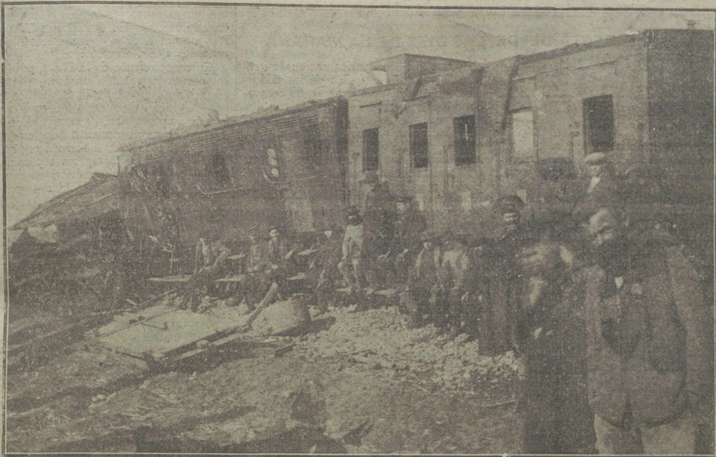
LA CATASTRÓFE FERROVIARIA DE MEDINA.—Restos del tren correo de Salamanca después de la explosión, que trece muertos y veinticinco heridos.

objetivos. Un aparato alemán tuvo que aterrizar averiado. De los nuestros falta uno.