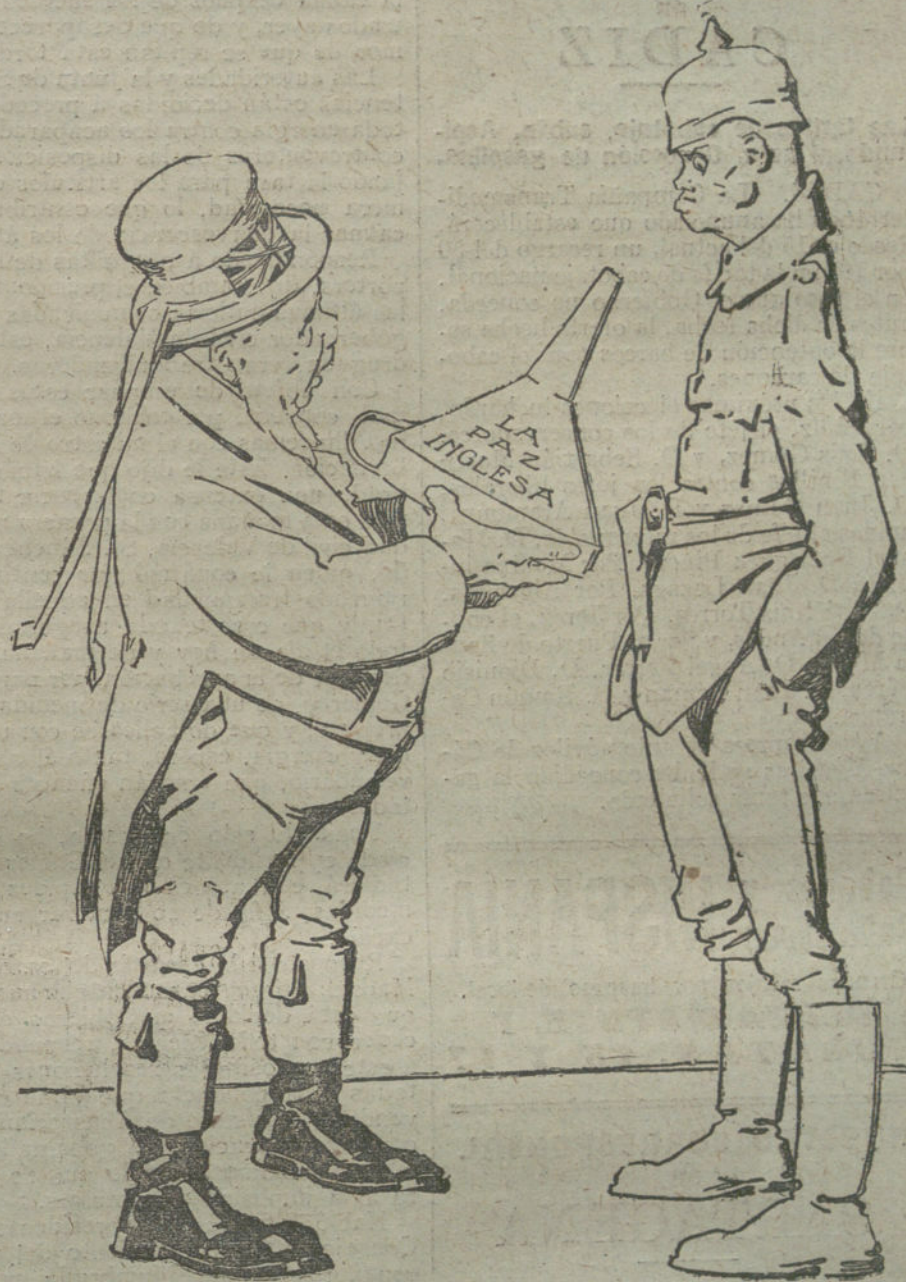
LA GENEROSIDAD DE JHON BULL. —¡Estas son mis proposiciones de paz!

A diversos vendedores que pretendían expender los productos a precios superiores de los fijados en la tasa, les pisotearon las mercancías, registrándose diversos incidentes.