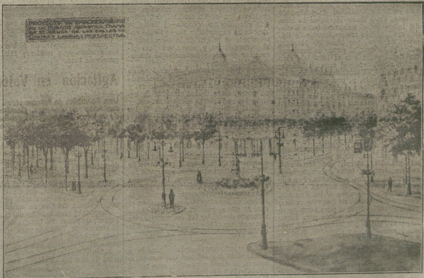
LAS REFORMAS DE BARCELONA.—Proyecto de uno de los edificios actualmente en construcción, y proyecto de aquel Ayuntamiento para transformar el cruce de las calles de Cortes y Lauria en una gran plaza.

España no tiene voz; es muda, como la esfinge que junto a las pirámides muestra su ceño hierático, aburrida de tanto presenciar el ir y venir de las indolentes caravanas. Es que en esta hora de las reivindicaciones, de las res-