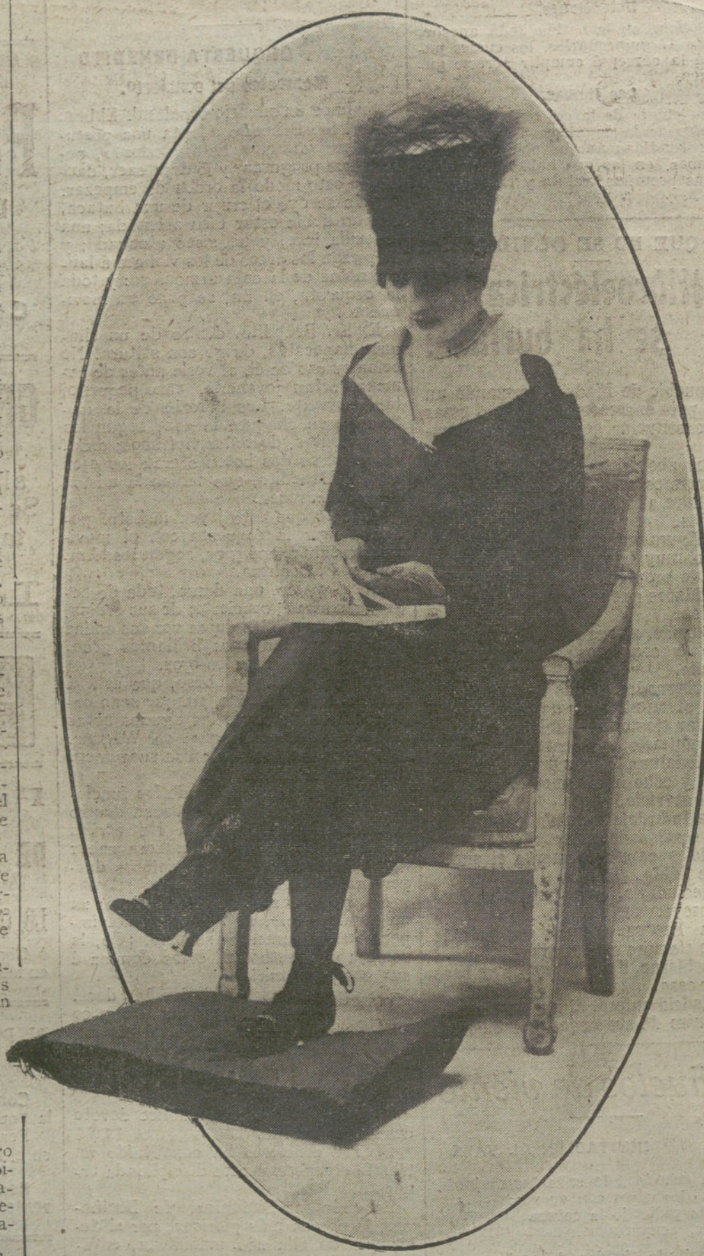
Modelo de «toilette» elegantísima, en la que destacan unas originales medias bordadas en oro, creación de la casa Gastineau.

perros extraviados, recaudan media docena de reales, con los que viven al día, sin trabajar.