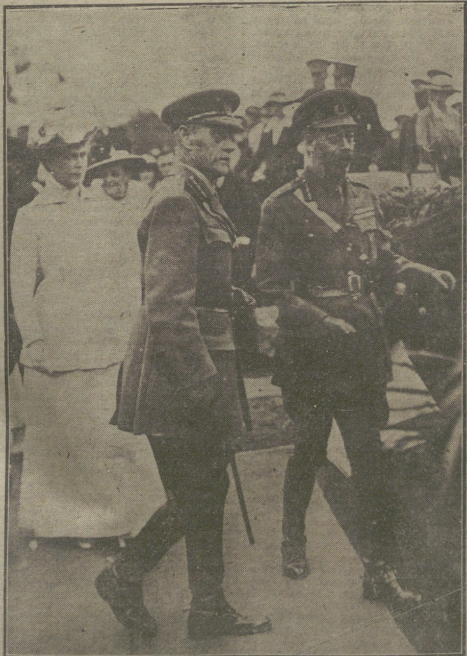
LOS REYES DE INGLATERRA á su llegada á un campamento de instrucción de marinería.