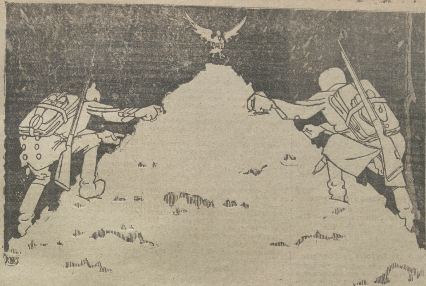
La cuesta de Enero.

Gran surtido en géneros de punto y paraguas. Fábrica de cuellos, puños y camisas a medida. Precio fijo.