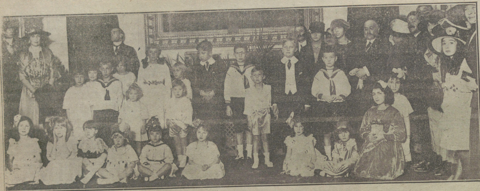
S. M. la Reina Victoria, sus augustos hijos, SS. AA. los hijos de los Infantes D. Carlos y D. Fernando y varios niños de los que tomaron parte en la fiesta infantil verificada ayer en el Ritz á beneficio de la Cruz Roja.