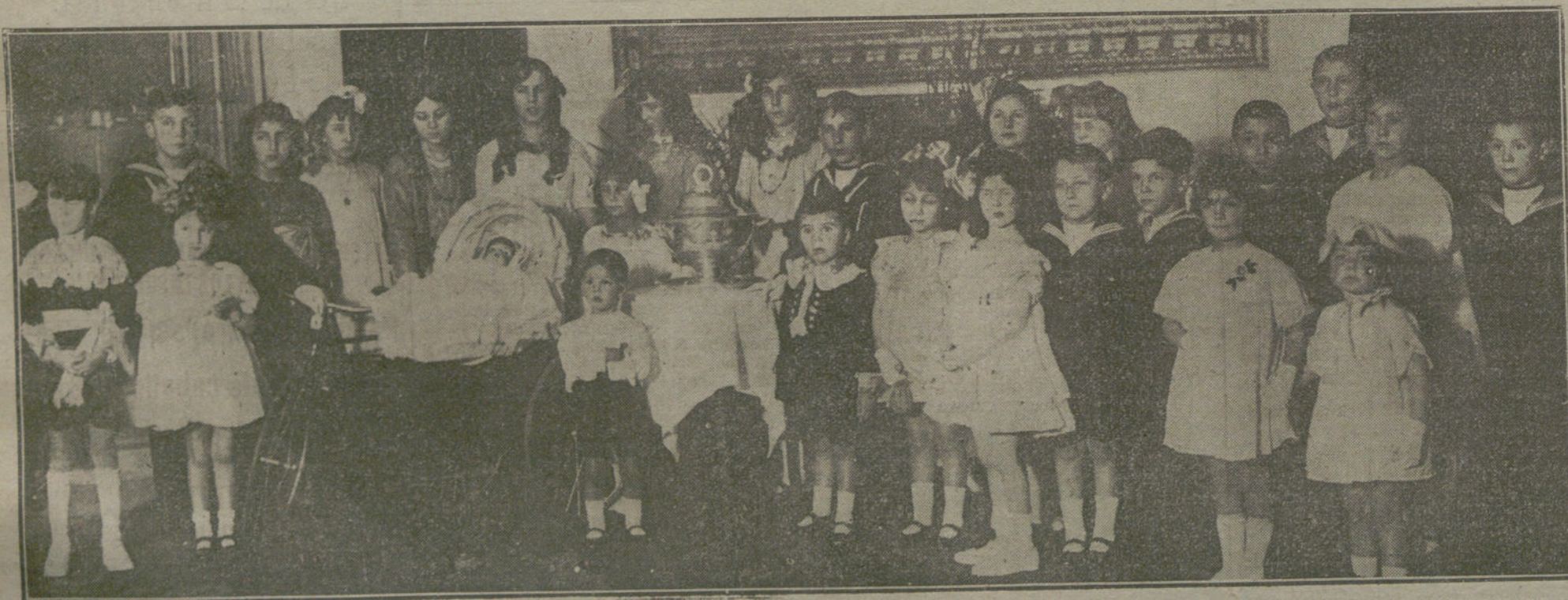
Aspecto de la Tómbola infantil, organizada ayer tarde en el Ritz á beneficio de la Cruz Roja.—(Fot. VIDAL).