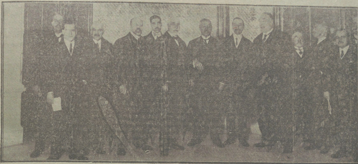
El ministro de Fomento, D. Antonio Maura, el vizconde de Eza y demás personalidades que han presidido la inauguración de la Asamblea Nacional de Ferrocarriles, verificada esta mañana. (Fot. VIDAL.)

Ambas bodas se celebrarán el día 31 en la iglesia de San Manuel y San Beltrán.