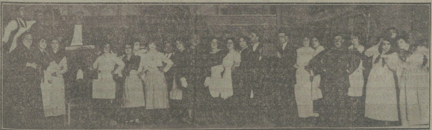
Una escena del sainete «Todo el mundo en contra mía», estrenado anoche en el teatro de Apolo.

La Prensa francesa hace constar que la caja de depósitos fué ya abierta el 6 de Enero, y que hasta ahora se carece aún de un informe oficial francés. Entretanto, continúan practicándose en París detenciones, y el Gobierno trabaja, exactamente lo mismo que en el proceso Dreyfuss, con todos los medios á su alcance. El diario de París «Heure» anuncia que en Francia ha comenzado una gran batalla política, en comparación con la cual el proceso Dreyfuss carece de importancia. El «Journal du Peuple» comunica que Caillaux ha sido detenido porque estaba en situación de aplastar á sus acusadores mientras estuviera en libertad. El periódico «Veritas» formula esta pregunta: «¿Tiene el Gobierno pruebas ó las fabrica?»