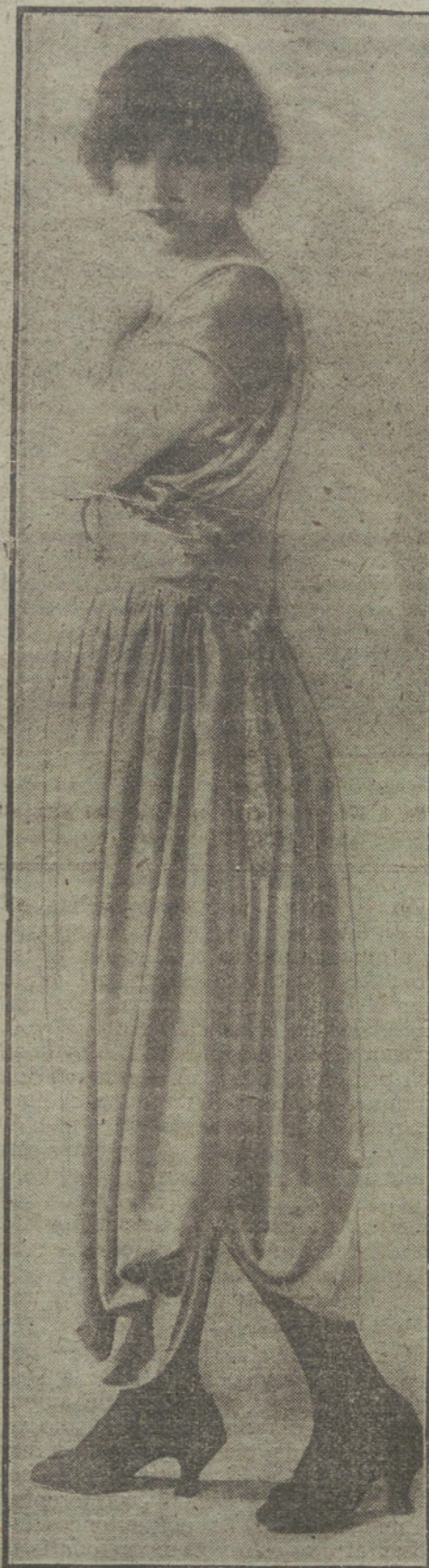
Traje de sociedad, confeccionado en raso blanco y amarillo con adornos de plata, por la casa Martial.