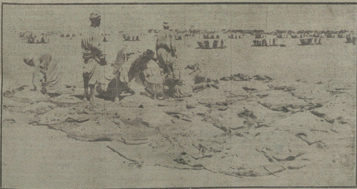
LA GUERRA PINTORESCA. Alrededores de un campamento militar en Palestina.

Ataca a las oligarquías imperantes y dice que se ejercerán con toda eficacia los derechos de ciudadanía, sin temores.