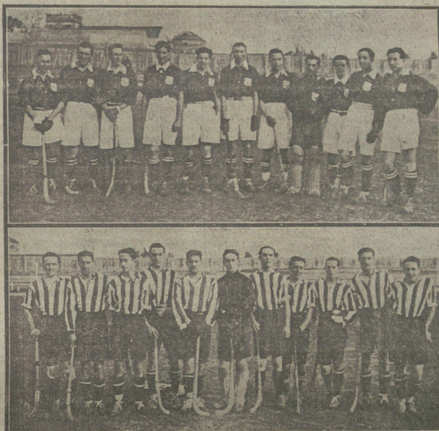
Los equipos de hockey de San Sebastián y Madrid, que están jugando en la corte reñidos partidos.

El marqués de Alhucemas, con patriótica, democrática y liberal solicitud, quiere hacer abortar el movimiento que con insanos fines se viene preparando. Otro Gobierno cualquiera, menos amante de las ideas liberales, en esta ocasión hubiera extremado los rigores, como no hace muchos meses acontecía con los señores Romanones y Dato. En momentos menos críticos se suspendieron las garantías, se privó de libertad a la