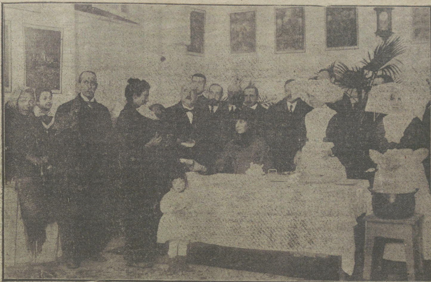
S. M. la Reina Victoria entregando comida a los pobres en el Asilo del Sagrado Corazón, acto verificado esta mañana.

límites de las atribuciones a ellas concedidas. Con ello se ha logrado por vez primera en esta guerra trascendental, encontrar las bases para el establecimiento de la paz.