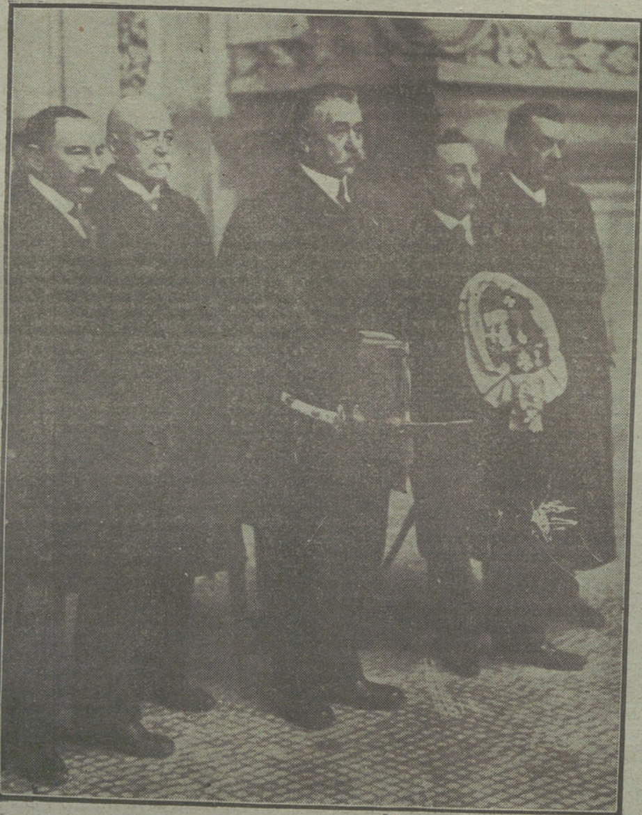
AL MARGEN DE LA GUERRA.—Entregá las autoridades municipales de los regatos que el Japón ha hecho á la ciudad de Verdun.

Su haber ha aumentado de 465 millones de marcos á fines de 1916, á 726 millones de marcos á fines de 1917. El movimiento total ascendió á 97.146 millones de marcos, ó en comparación con el año anterior, 33.664 millones más, es