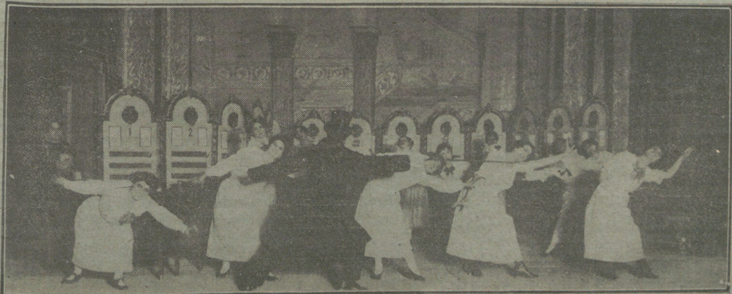
Una escena de «La duquesa del Tabarín», que esta noche se representará, en italiano, en el teatro de Price.

Se ignoran las causas de tan fatal resolución.