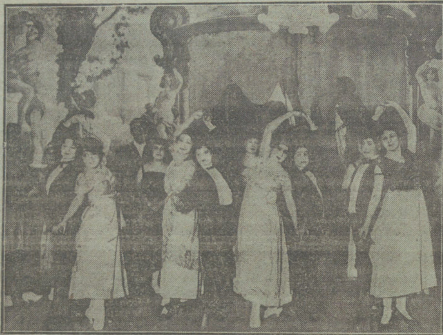
Una escena de «El secreto de Venus», que se estrenó anoche en el teatro de Martín.

Y termina diciendo lo siguiente: «Si la gravedad de los momentos y las razones que os hemos expuesto os convencen de la conveniencia que nos