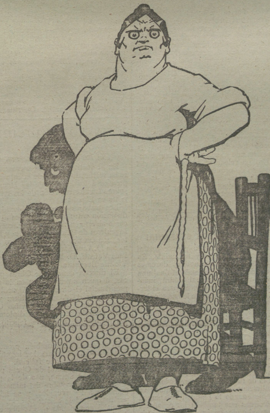
CAMBIO DE PAPELES

El diablito de la confusión y del enredo menea los trebejos todos de la comedia española. En haciéndose famoso por un concepto cualquiera un español, se le llama ya de todas partes, suponiéndole hábil para todos los menesteres. No me espantaría yo que el mejor día nombrasen á Caja presidente de la Sociedad de zapateros madrileños, ó á Maura presidente del club tauromáxico de la villa y corte. Mas tamañas y tan ridículas confusiones, que darían que reír, pero que veríamos harto disculpadas entre gentes de cleta y de trapío, no hallan disculpa ni justificación en una Aca-