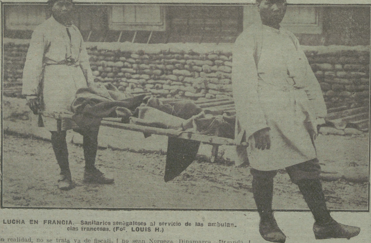
LA LUCHA EN FRANCIA.—Sanitarios senegaleses al servicio de las ambulancias francesas.

En Brest-Litowski ha proseguido el día 21 la Comisión alemana de Asuntos económicos las deliberaciones, comenzadas el día 20, con los representantes rusos. Los trabajos preliminares para nuevas sesiones de las Comisiones económicas, fueron encomendados a una Subcomisión, que ya en la tarde del día 21 comenzó su labor. Los días 20 y 21 han tenido ya lugar las primeras deliberaciones oficiales de las Comisiones de derecho germanorusas. En detalle se trató y formuló lo siguiente: Terminación del esta-