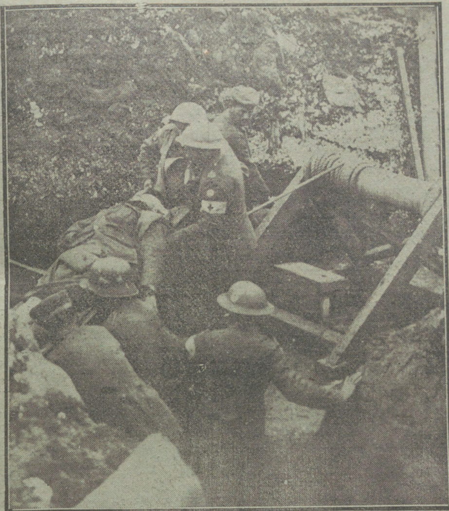
LA LUCHA EN FRANCIA.—Soldados franceses extrayendo heridos de las trincheras, después de una acción.

dirigidas contra la injusticia en el reparto de las escasas existencias de carne. La Delegación manifestó que los obreros ingleses habían llegado ya al límite de lo que podían resistir, y que no estaban en situación de trabajar diariamente catorce horas, comiendo nada más que pan seco. El alcalde prometió hacer todo lo que pudiera para remediar la situación.