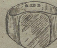
Núm. 14.—Gramos 16. Ptas. 60.