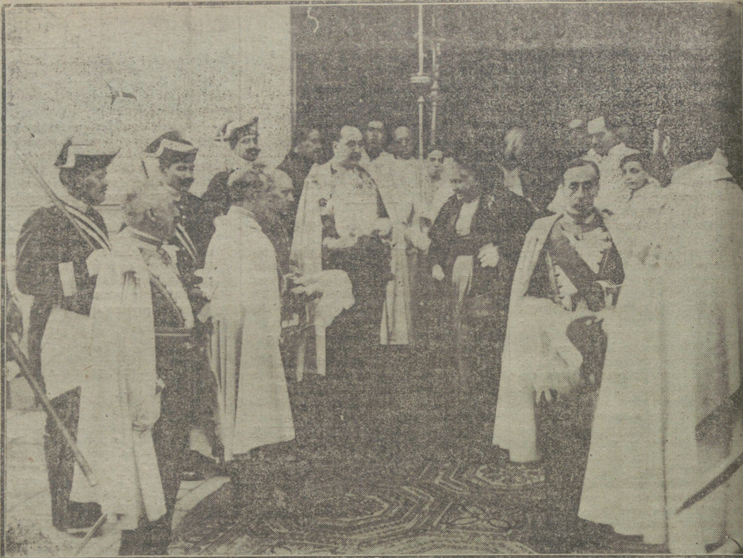
S. A. la Infanta Doña Isabel saliendo de la iglesia del Buen Suceso, donde se ha celebrado esta mañana la fiesta religiosa del Real Cuerpo Colegiado de Caballeros Hijosdalgo de la Nobleza de Madrid.

Con motivo del santo de Su Alteza la Infanta Doña Paz, la Corte ha vestido de media gala.