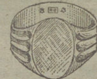
Núm. 8.—Gramos 11. Ptas. 41,25.