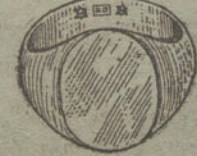
Núm. 15.—Gramos 20. Ptas. 75.

Factura de garantía en todas las compras