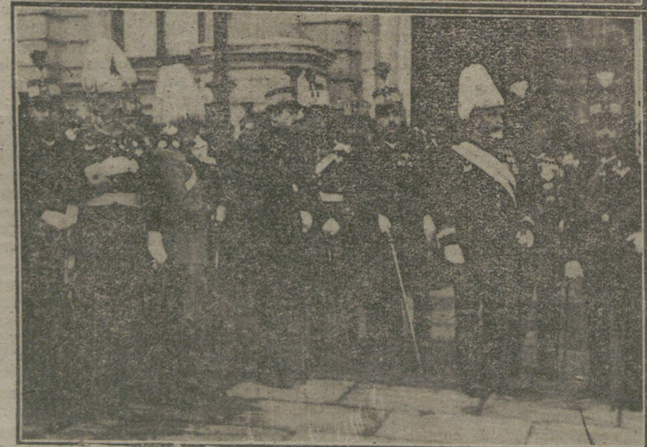
EL SANTO DEL REY. La representación del Ayuntamiento de Madrid y las Comisiones militares saliendo ayer de la recepción celebrada en Palacio.