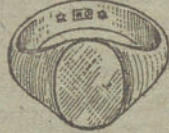
Núm. 2.—Gramos 6. Ptas. 22,50.