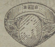
Núm. 7.—Gramos 10. Ptas. 37,50.