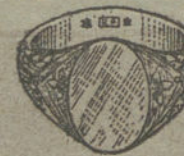
Núm. 13.—Gramos 14. Ptas. 52,50.