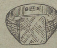
Núm. 10.—Gramos 12. Ptas. 45.