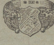
Núm. 11.—Gramos 12. Ptas. 45.