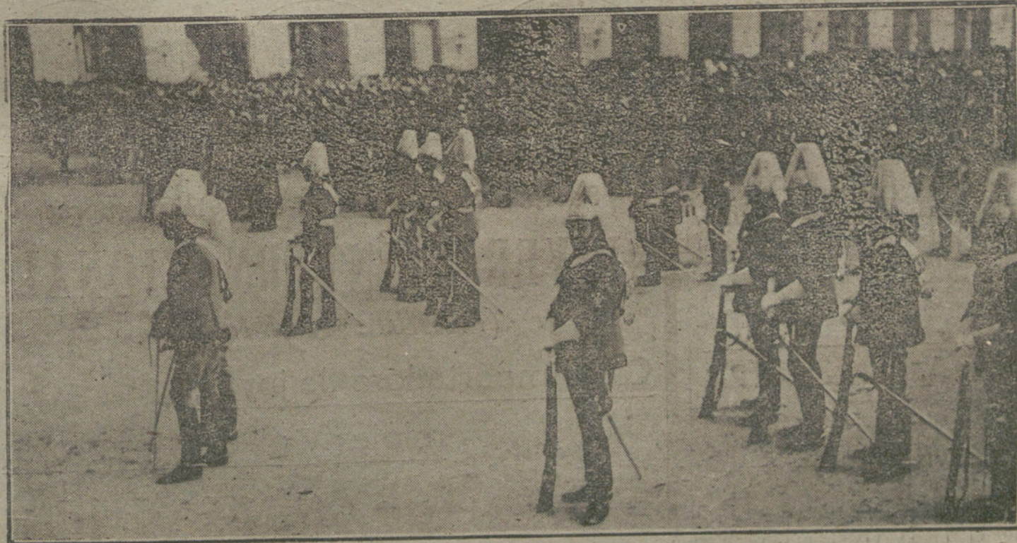
EL SANTO DEL REY.—Las tropas formadas en la plaza de la Armería durante el acto de la recepción.

Apenas transcurre un día sin que se dé cuenta de hundimientos de barcos navegando en convoy, y hasta de los que van fuertemente escoltados. Se nota incluso que de un mismo convoy son torpedeados varios barcos, mientras an-