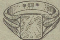
Núm. 3.—Gramos 7. Ptas. 26,25.