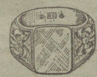
Núm. 9.—Gramos 11. Ptas. 41,25.