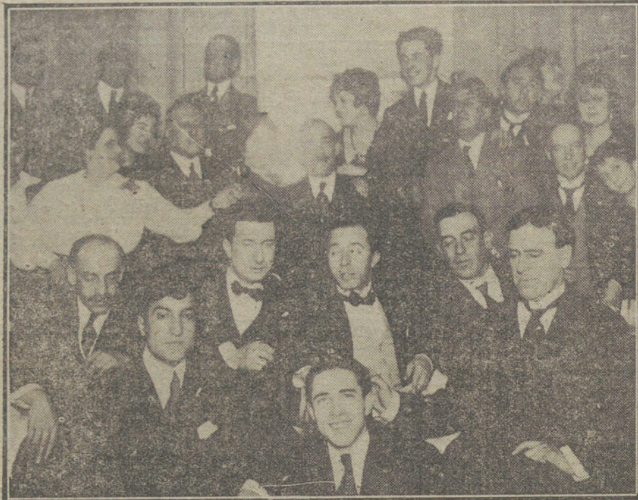
Grupos de artistas y escritores madrileños, relacionados con el teatro de Eslava, que ayer se reunieron en íntimo banquete regionalista.

Los cuerpos de los dos ex ministros fueron expuestos ayer al público, desfilando ante ellos numerosísimo público.