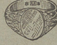
Núm. 12.—Gramos 13. Ptas. 48,75.