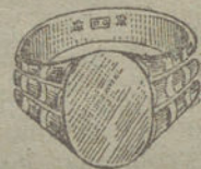
Núm. 4.—Gramos 8. Ptas. 30.