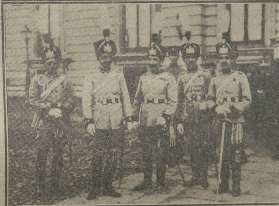
EL SANTO DEL REY.—Las Comisiones eclesiásticas, presididas por los Obispos de Segovia y Plasencia, y el coronel y oficiales del regimiento de Caballería Reina Victoria, de Valencia, del que es coronel honorario S. M. la Reina, saliendo de la recepción celebrada ayer en Palacio.