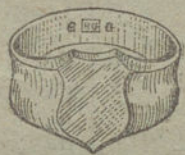
Núm. 5.—Gramos 8,5. Ptas. 31,90.