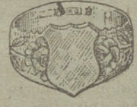
Núm. 6.—Gramos 9. Ptas. 33,75.