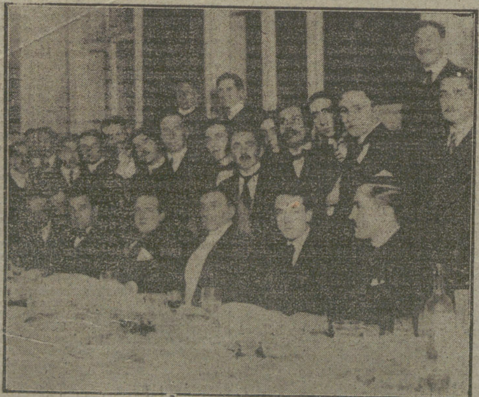
Mesa presidencial del banquete ofrecido anoche al joven poeta catalán José María «Sagarra» por el éxito conseguido con su primera producción teatral «Pondalla» estrenada recientemente en Barcelona

También en Inglaterra, señores, se habló por entonces de un modo muy distinto que hoy. Basta recordar un solo testigo clásico, que no es otro que el célebre historiador y escritor inglés, Thomas Carlyle, que en una carta al «Times» escribía en Diciembre de 1871 lo siguiente: