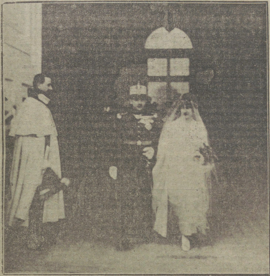
La hija del marqués de Cubas y el hijo del duque de Hornachuelos, que ayer contrajeron matrimonio, saliendo de Palacio de ofrecer sus respetos a los Reyes.

«Ningún pueblo ha tenido un vecino tan malo como tuvo Alemania durante los últimos cuatrocientos años en Francia. Alemania estaría loca si no pensara en levantar un muro entre ella y su vecino (observo que no he repetido las expresiones muy duras que Carlyle empleó entonces contra Francia), levantar un muro en cuanto tenga ocasión.» No sé de ninguna ley de la Naturaleza y de ningún acuerdo del Parlamento celestial, según los cuales, Francia, como única entre todos los seres terrenales, no estuviera obligada a devolver una parte de los territorios robados, si los propietarios a quienes se los arrebató tienen ocasión favorable para recuperarlos.