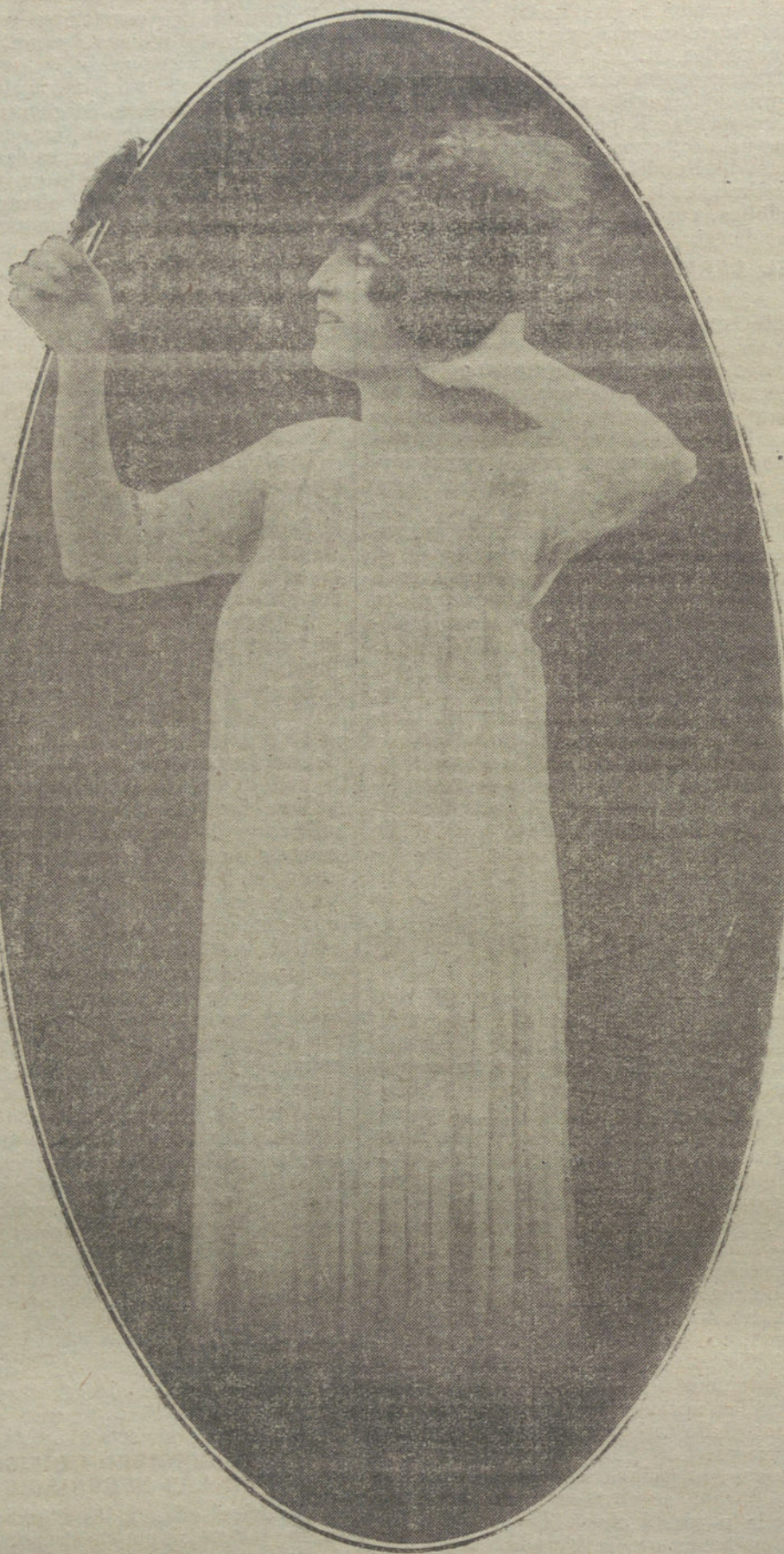
Elegante bata plisada, creación de la maison Pichon.