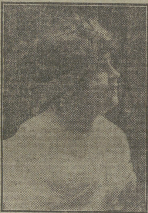
ADELA CALDERON.—Notable actriz que actúa con gran éxito en el teatro Goya, de Barcelona.

cumpleaños del marido, y dará un té... Estamos invitadas... Niní.—¿Qué aficionados son esos señores a adornarse con plumas ajenas. Luisita.—Pues yo que tú no se lo daba; que compraran uno... Y luego con lo que le hizo el «coronel» a papá... Doña Amalia.—No hay más remedio, hijas... Rufino, ven conmigo... ¿Adónde estarán mis tarjetas? Niní.—En el primer cajón de la cómoda, mamá. ¿Qué te parece doña Paulita? Doña Amalia.—Como siempre, una chismosa. (Vase con Rufino derecha.) Niní.—Parece que Sinesio no te mira con malos ojos. Luisita.—Por Dios, Niní, si es un fachal... Doña Amalia (dentro).—Niñas, venid a arreglar el juego para que lo lleven en seguida. Luisita.—Sí, a ver si nos rompen una taza como el año pasado. ¡Ay, qué rabia, qué rabia y qué rabia...! (Vase derecha.) EPILOGO (Escalera de los pabellones. Momento final de la escena anterior. Doña Paulina, Candida y Sinesio bajando los escalones.) Doña Paulina.—¿Te has fijado qué trajes más feos? Candida.—Cursilísimos, mamá. Sinesio.—Pues Luisita está muy mona. Doña Paulita.—Quita allá!... Sólo falta que te gustara esa crinola... Estudia y déjate de bobadas y de mirar a cursis como esa. Sinesio.—¿Qué se le va a hacer!... (Resignado.) (Aparte.) ¡Allí la llaman guapísima...; el mundo es así! Mazipintré.