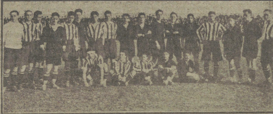
Un detalle del partido de foot-ball, jugado ayer tarde entre los equipos Athletic y Racing, de Madrid.

Cuerpo representativo de la Lituania, único Cuerpo de esta clase, de cuya composición somos, por decirlo así, completamente responsables, pues respecto á los Cuerpos representativos históricos nadie puede hacernos responsables de su composición, ha sido compuesto, en verdad, sensata y honradamente, de modo que una representación del pueblo lituano ha sido anhelada en todas sus capas y tendencias, dentro de lo posible. La conclusión que puedo sacar de esto es que deben ustedes tener confianza en que nosotros, donde sigamos laborando, lo hagamos á base de lo que sirvió de norma para la composición del Cuerpo representativo de Lituania.