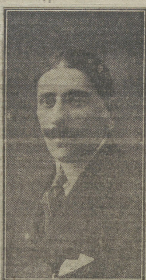
El notable escritor Alejandro Ber, que ha obtenido gran éxito con su libro reciente «El caso del periodista español».