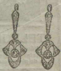
Núm. 2.—4 brillantes y diamantes.