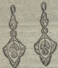
Núm. 1.—4 brillantes y diamantes.

Brillantes de primera calidad :-: Diamantes Rosas de Holanda MONTURAS DE PLATINO FINO Y ORO DE LEY 18 QUILATES CONTRASTADO