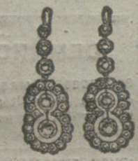
Núm. 7.—10 brillantes y diamantes.