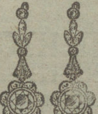
Núm. 18.—6 brillantes y diamantes.