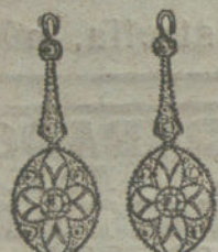
Núm. 3.—4 brillantes y diamantes.