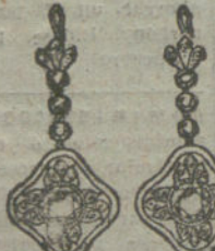
Núm. 10.—8 brillantes y diamantes.