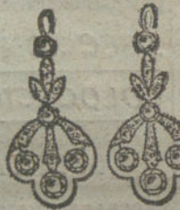
Núm. 8.—10 brillantes y diamantes.