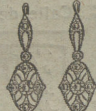
Núm. 4.—4 brillantes y diamantes.