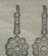
Núm. 12.—24 brillantes y diamantes.