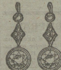
Núm. 24.—12 brillantes.