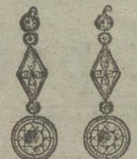
Núm. 17.—8 brillantes y diamantes.