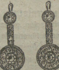
Núm. 6.—4 brillantes y diamantes.