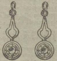
Núm. 13.—4 brillantes.