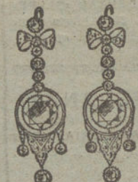
Núm. 19.—20 brillantes y diamantes.