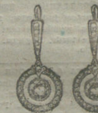
Núm. 11.—4 brillantes y diamantes.