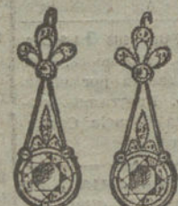
Núm. 21.—8 brillantes y diamantes.