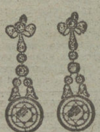
Núm. 20.—12 brillantes y diamantes.