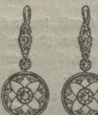
Núm. 5.—4 brillantes y diamantes.