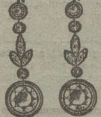
Núm. 22.—8 brillantes y diamantes.