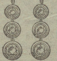
Núm. 14.—6 brillantes.