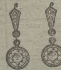
Núm. 23.—12 brillantes.