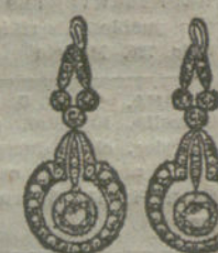
Núm. 9.—8 brillantes y diamantes.