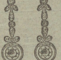
Núm. 16.—6 brillantes y diamantes.