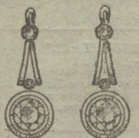
Núm. 15.—6 brillantes.