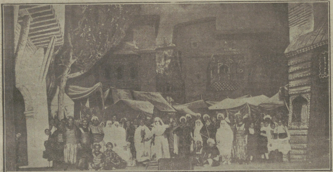
Una escena del acto primero de «La Llama», ópera de Usandizaga, estrenada en San Sebastián con mucho éxito.

Si la delegación del Sr. Holubowicz poseía todavía, como antes, la representación del Secretariado de Kief, su