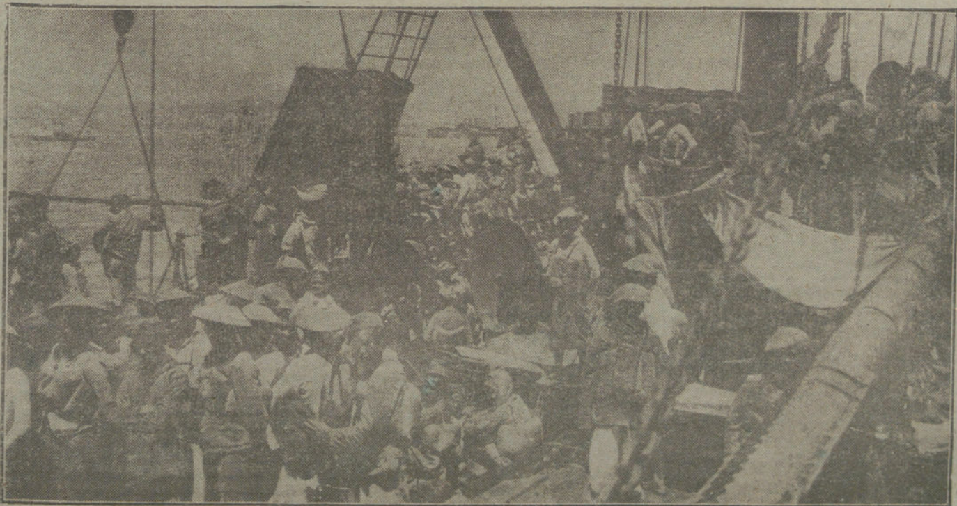
Niños del Tonkín y de Anam, embarcando en un transporte francés con destino a los campos de batalla de Francia.