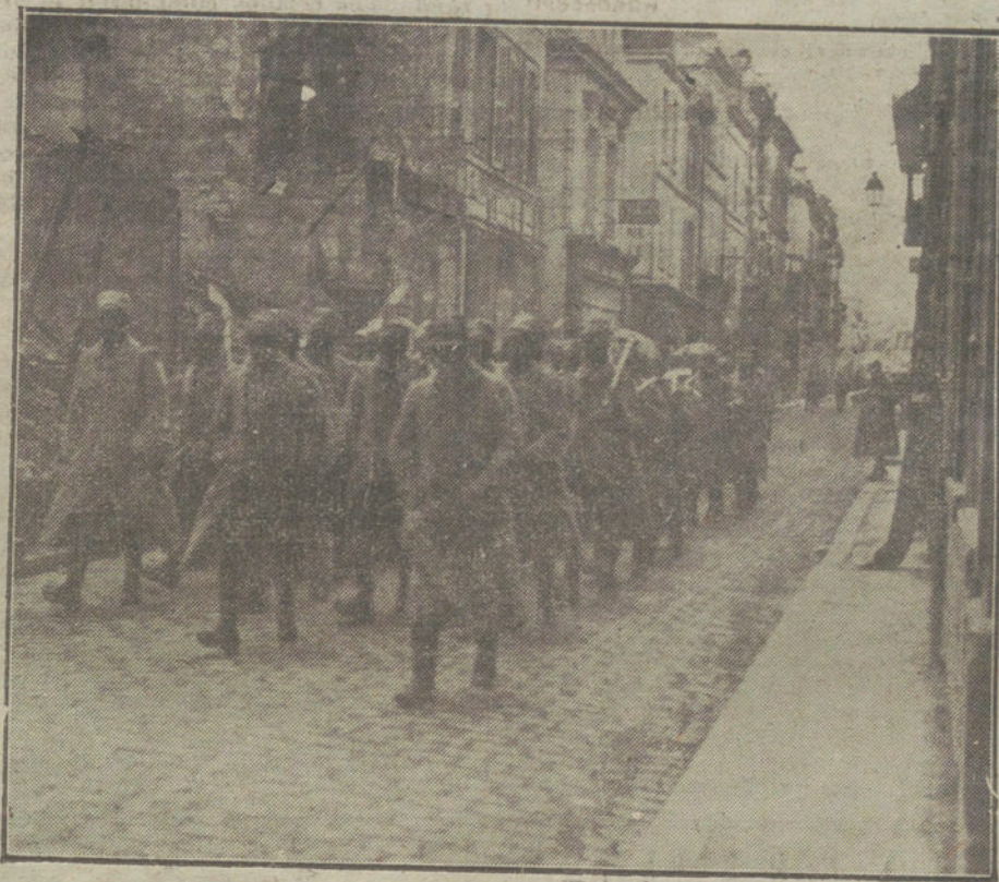
Senegaleses, al servicio de Francia, marchando a construir defensas en una localidad del frente.