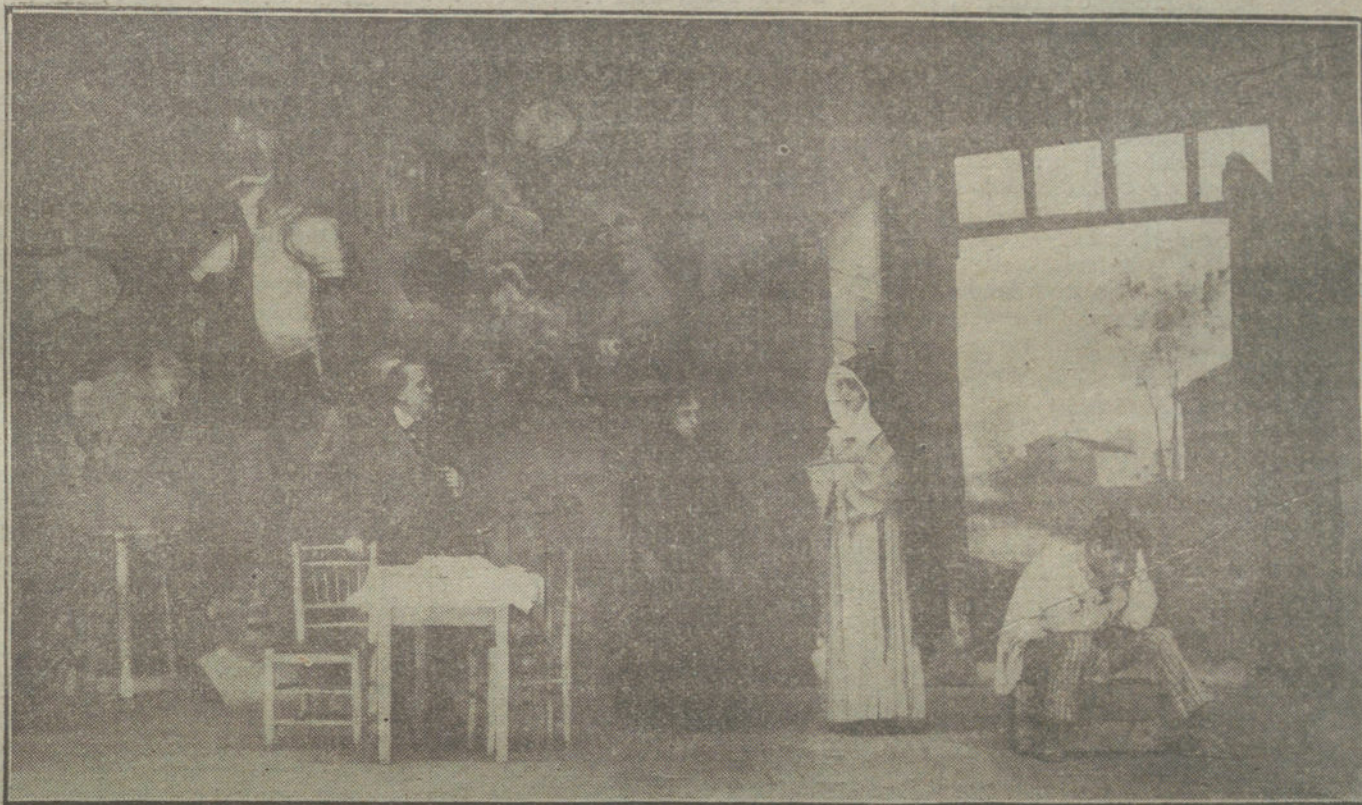
Una escena del drama «Estrazilla», que se ha estrenado esta tarde en el teatro de la Princesa.