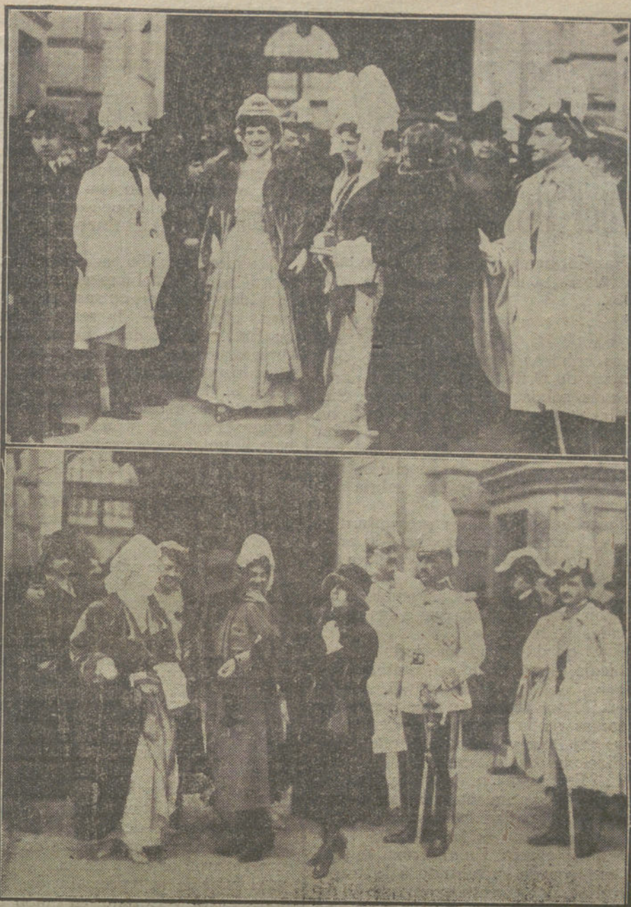
CAPILLA PUBLICA EN PALACIO.—Damas de la Reina y Grandes de España saliendo de la capilla pública, celebrada esta mañana en Palacio.

NO SE DEVUELVEN LOS ORIGINALES GRAFICOS NADA MAS QUE EN EL CASO EN QUE PREVIAMENTE HAYAN SIDO ADQUIRIDOS CON ESA ONDIEION.