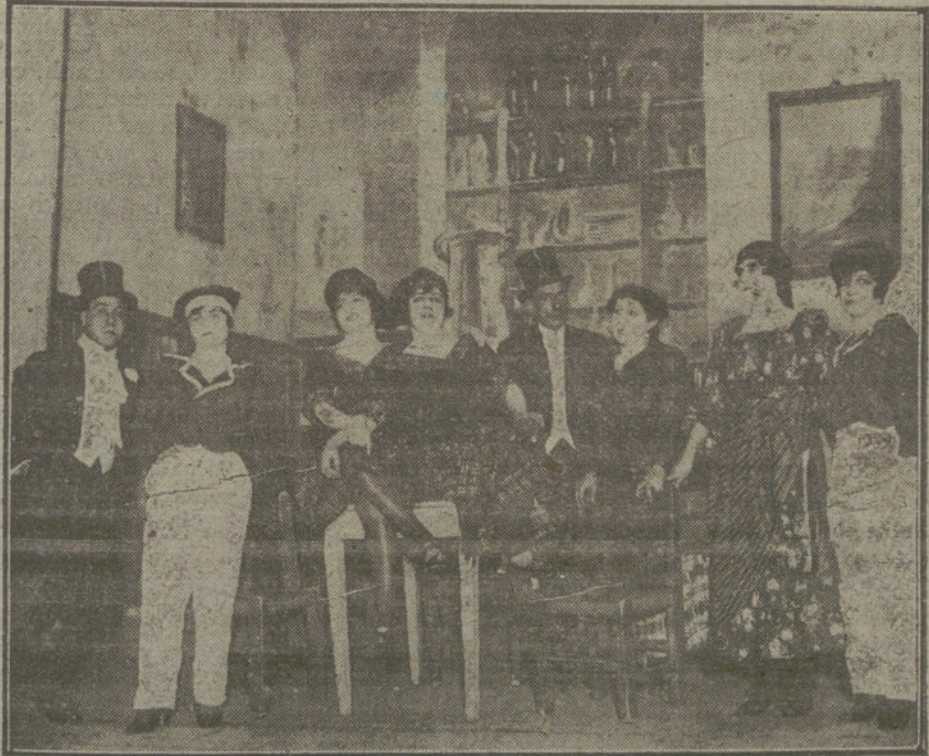
Una escena de «El viaje de los Pinzones», obra estrenada ayer en el teatro Amio.

Lucía S. M. la Reina Doña Victoria un hermoso traje blanco y gris, to-