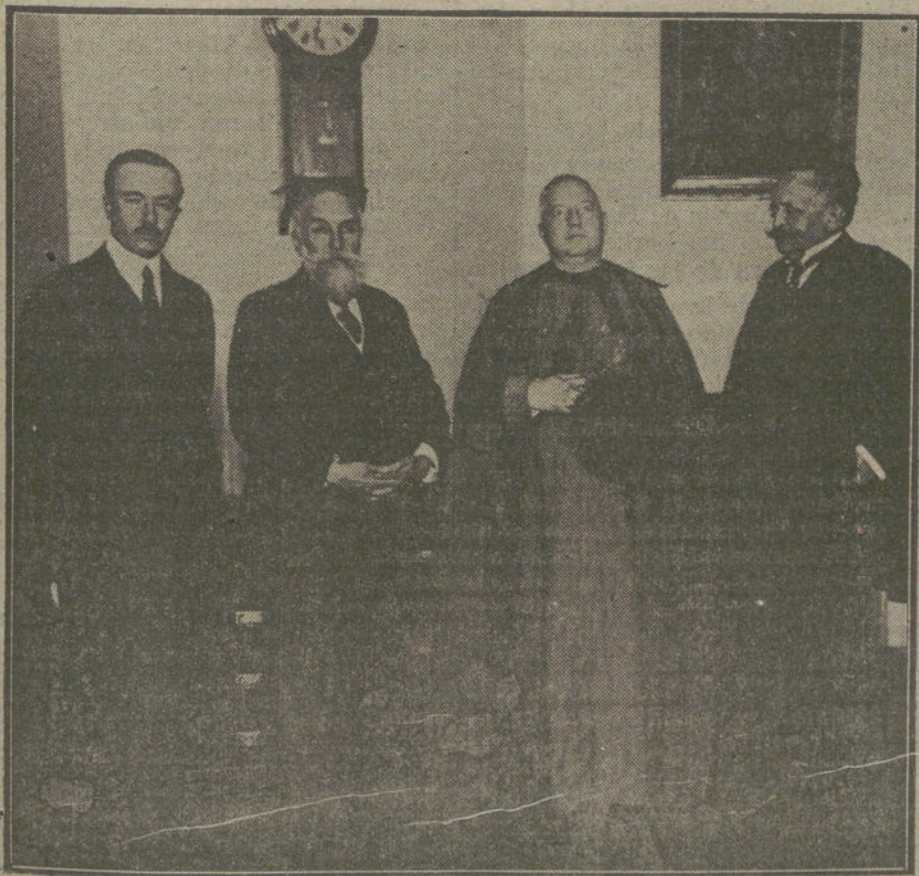
El arzobispo de Tarragona, D. Antolin López Peláez, al terminar su interesante conferencia, dada anoche en el Aláneo.

NUMERO DEL TELEFONO DE LA REDACCION Y TALLERES DE «LA TRIBUNA» (JARDINES. 4. 8 Y 8). 4.444