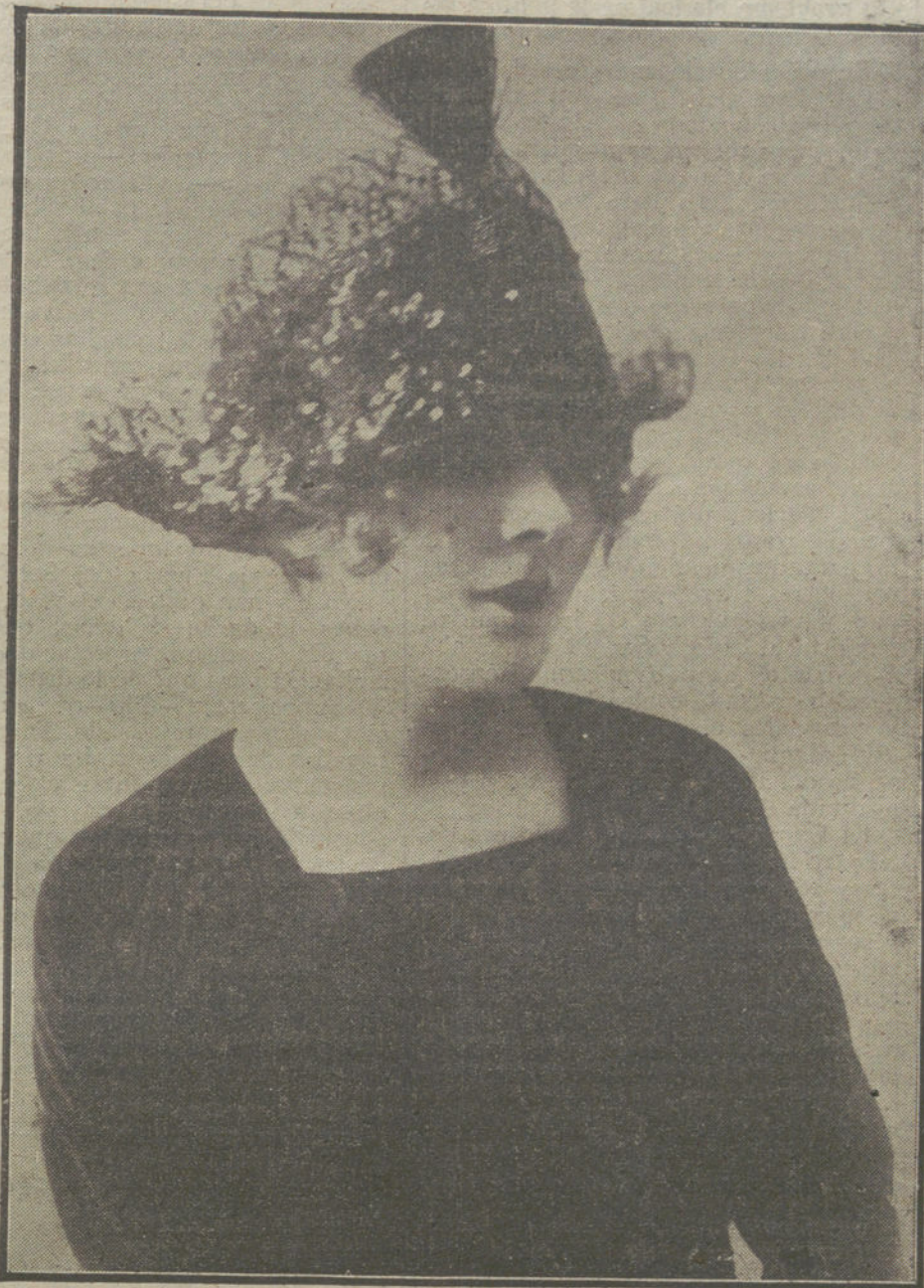
Moderno sombrero, tricornio de azabache y plata, creación de la casa Blanchart.