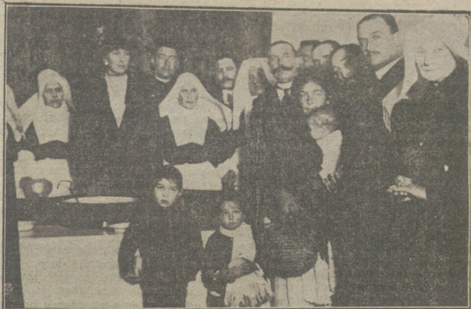
EN EL ASILO DE SAN JOSE.—S. M. la Reina Victoria repartiendo comidas a los pobres. Pequeñuelos saliendo del Asilo con el donativo entregado por la Reina.

Estrenó «Las golondrinas» y llegó al máximo la enfermedad de su cuerpo frágil; sólo en el lívido rostro tenían la vida de la fiebre sus ojos enormes. Quiso acabar «La llama» antes de morir. En Enero de 1915 se puso a trabajar. Desde las ocho de la mañana hasta las diez de la noche, los intermi-