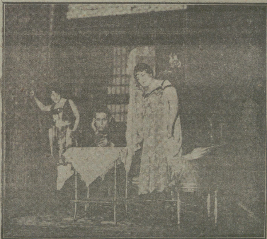
Una escena de «La mano que mata», obra estrenada anoche en el teatro de Cervantes

Creo que esto baste. Estas son las masas en las que se apoya la Rada central ucraniana, y en cuyo nombre hemos venido aquí para hablar. Ahora ha decidido el Gobierno de San Petersburgo recurrir al último medio. El día 1