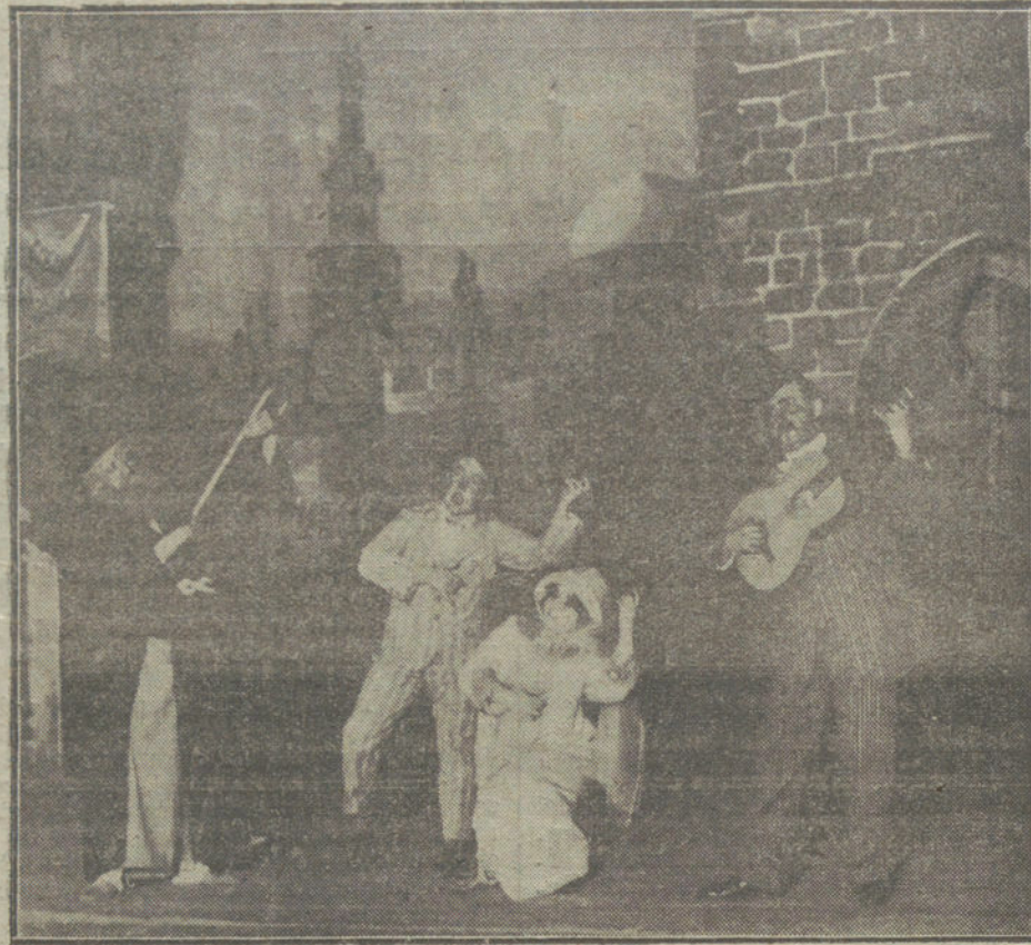
Una escena de «El niño judío», obra estrenada anoche en el teatro de Apolo.

mejorado en Petrogrado. Hoy, lunes, los obreros de Petrogrado han sido provistos de diez vagones de aprovisionamientos, gracias al socorro finlandés.—Chovil.