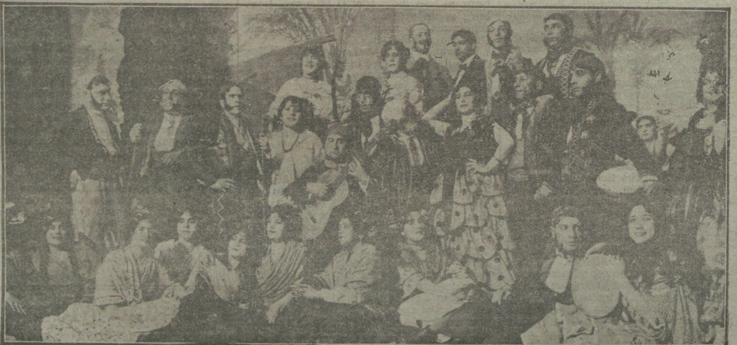
Una escena de «La coronación de la Imperio», representada en el teatro de Romea.

Después de los ex ministros Escaumilis, Triantaphyllacos, Zalo-Costa y Lam-