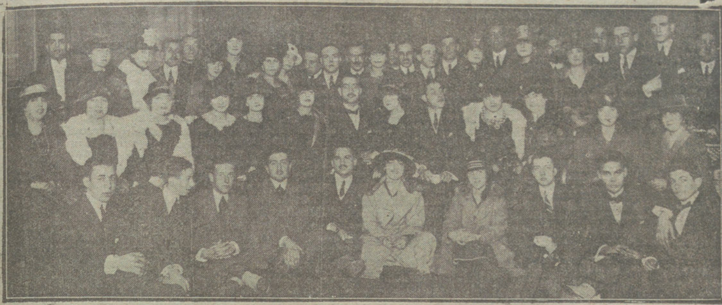
Grupo de concurrentes al té-baile celebrado ayer tarde en el Palace Hotel.

brós, han sido detenidos el ex diputado Anastassopoulos, el ex ministro de Negocios Extranjeros Baltazis, el ex ministro Traldaris, el ex diputado Rhallys, el ex ministro de la Guerra Hadjopoulos, el ex caballerizo mayor del Rey, Zpsiluti, y el ministro Comencindivos.