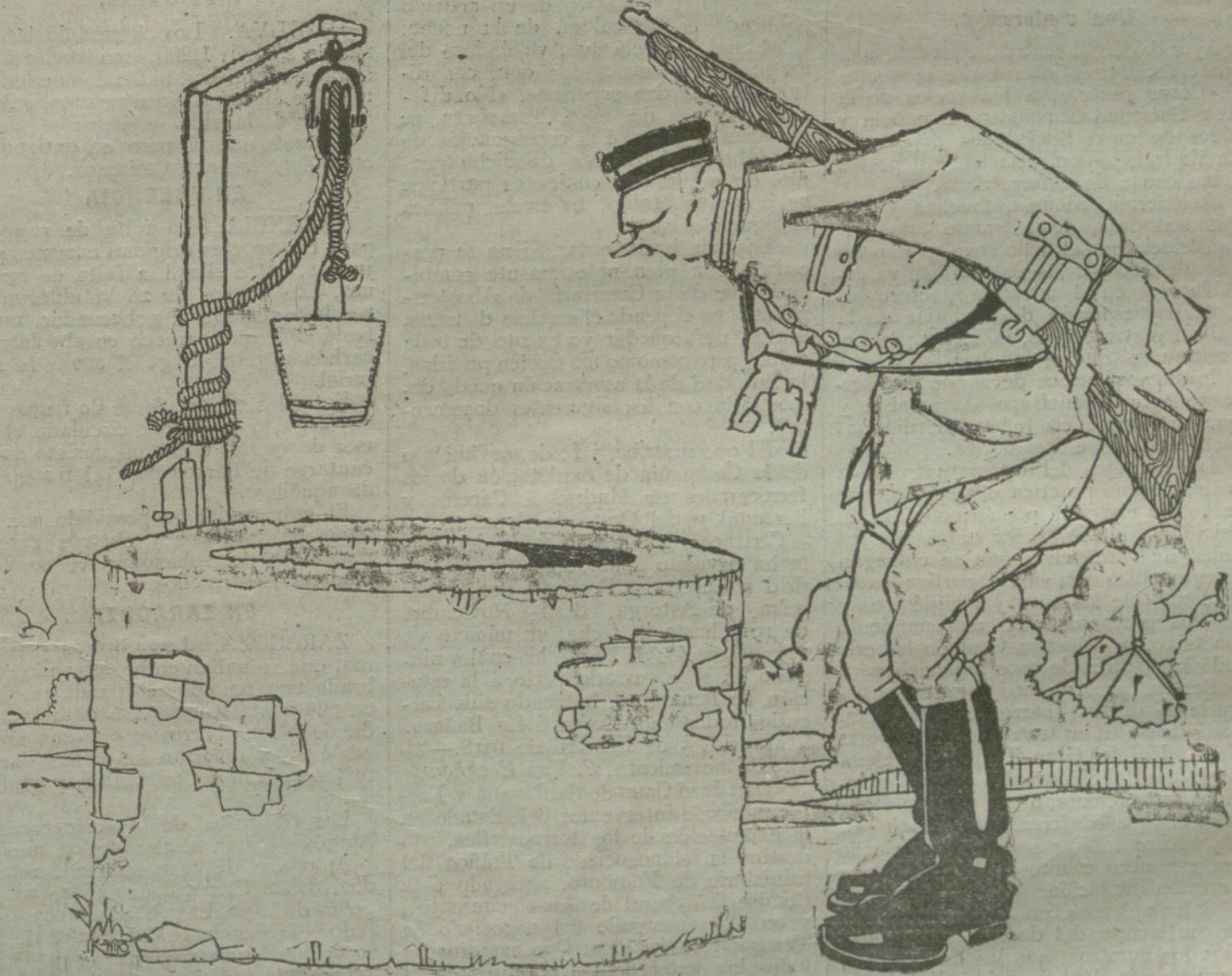
EL QUENTO DEL POZO El francés, desde dentro.—Mira, tú, si me regalas la Alsacia, Lorena te perdono la vida.