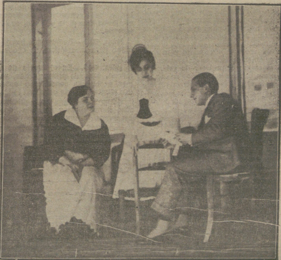
Una escena de la comedia «Pipiolan», que se estrena esta noche en el teatro de Lara.

—Mañana se cumple el quinto aniversario de la muerte del señor conde de Guaqui.