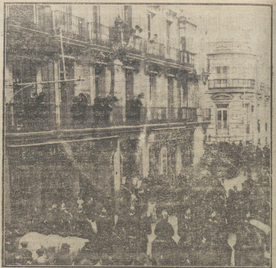
Aspecto de la calle del Barquillo, durante el acto de descubrir la lápida conmemorativa en la casa donde vivió última mente D. Joaquín Costa.