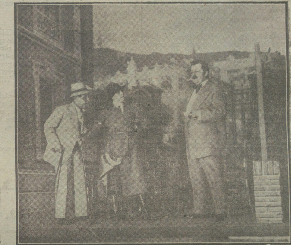
Una escena de «Colonia veraniega», obra que se estrena hoy en el teatro de la Infanta Isabel.

Y el mañana llegó con el tremendo agobio del hambre. Y Dios quiso poner á España, para probarla, en este trance tan difícil, que no sabemos cómo ha de acabar. Y nuestro Marruecos padece ya la escasez que empobrece la vida. El pan es caro y no muy bueno. La carne hace doce días que no se ve en la plaza. El carbón tiene precio altísimo, en esta tierra donde la leña constituye una riqueza. Los huevos son provechosos negocios de acaparadores y exportadores. El pescado es comida de ricos. La caballa perdió su popularidad en los hogares humildes. La harina escasea ya, y nos amenazan con la probabilidad de que falte en absoluto. El aceite—este año de la cosecha asombrosa en Andalucía—cuesta aquí más que en Alema-