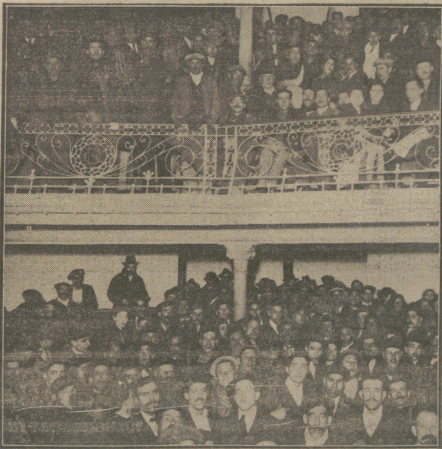
Aspecto del salón grande de la Casa del Pueblo durante el mitin radical celebrado anoche.

El acta, artístico pergamino del Ayuntamiento municipal Sr. Losada, fué firmada por todos los principales concurrentes al acto, que resultó, a la vez, sencillo y solemne.