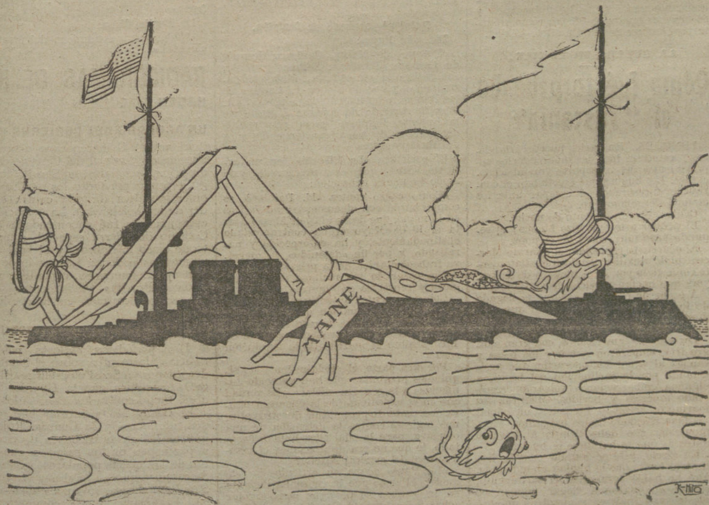
EL VIAJE DE NUNCA ACABAR

Dice el pez: En un barquito de guerra lo he visto yo por aquí, llevaba la mano fuera, por eso le conocí.