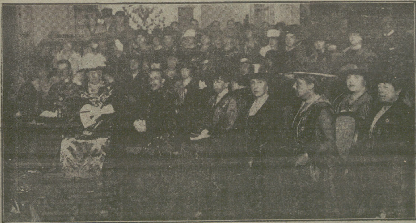
La Familia Real presenciando el festival celebrado ayer tarde en el Ritz a beneficio de la Cruz Roja Española.