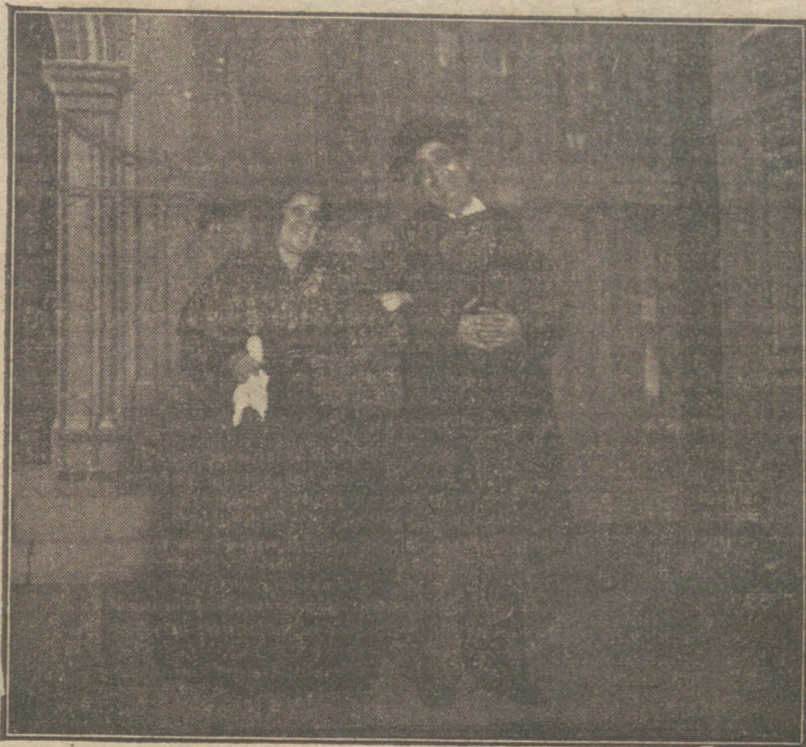
Loreto Prado y Enrique Chicote en una escena de «Las almas buenas», obra estrenada anoche en el teatro Cómico.

El periódico de Londres «Morning Post» cita, al tratar de la cuestión irlandesa, una serie de importantes puntos estratégicos que se encuentran en posesión de Inglaterra, y constituyen la base del dominio marítimo inglés. El diario declara que Irlanda debe, por este motivo, permanecer unida a toda costa con Inglaterra, pues Inglaterra no puede prescindir del Sur y del Oeste de Irlanda, ya que su posesión es tan necesaria para la defensa inglesa como Gibraltar, el cual Inglaterra no puede confiar a los españoles. Por eso tiene Inglaterra que seguir manteniendo la unión con Irlanda, sin consideración a otras cuestiones, como tampoco puede renunciar en el resto del mundo a la