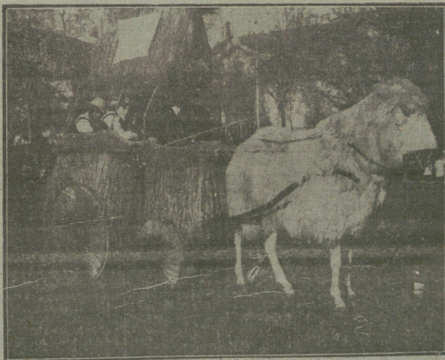
EL CARNAVAL EN MADRID.—«La cabana de mi oveja», coché premiado ayer en el concurso de la Castellana.

España está amenazada, gravemente amenazada por los enemigos de dentro, por el «Heraldo», que, no satisfecho con haber ayudado al Gobierno de Dato y Sánchez Guerra á preparar los