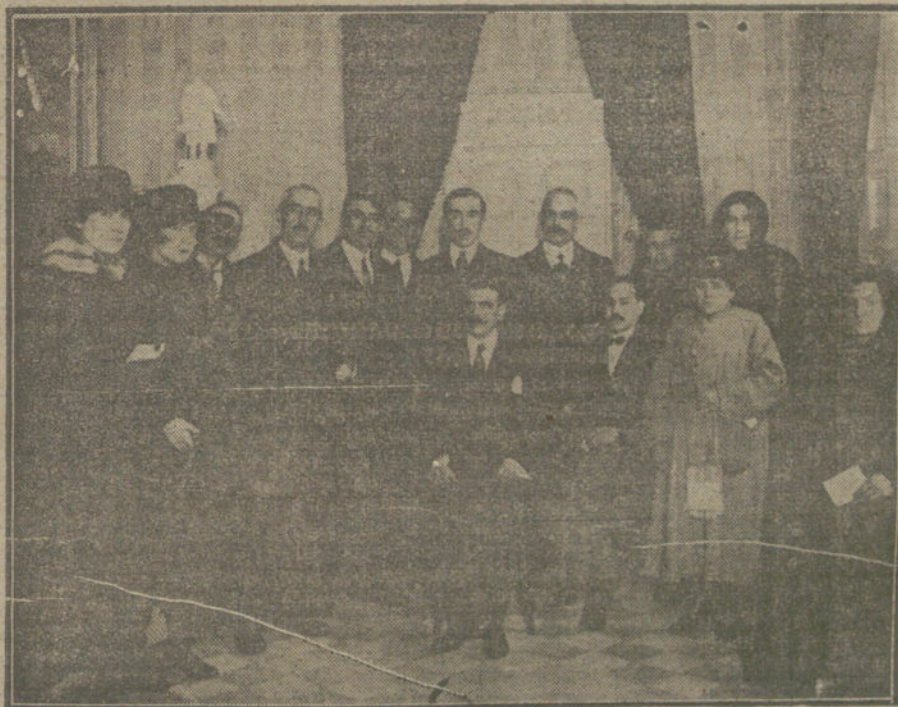
Grupo de concurrentes a la primera sesión de la Asamblea de Defensa del Ayuntamiento de Madrid «letero».

El periódico de Berlín, «Germania», informa sobre la conferencia celebrada por el vicescanciller alemán, Von Payer, al tomar posesión de su cargo, con el canciller conde de Hertling. El resultado fué que también el Gobierno imperial se mantiene firme y unido en lo convenido entre él y los partidos del Reichstag en Noviembre. De todos los partidos de la mayoría, con inclusión de la socialdemocracia, puede decirse lo mismo. Todo político realista, que no considere el gobernar como cuestión de sentimientos, no verá, en tales circunstancias, motivo alguno para un cambio de orientación, sino que más bien debe considerar infructuosos los intentos de los pangermanistas y socialistas independientes de romper la unión de los partidos de la mayoría.