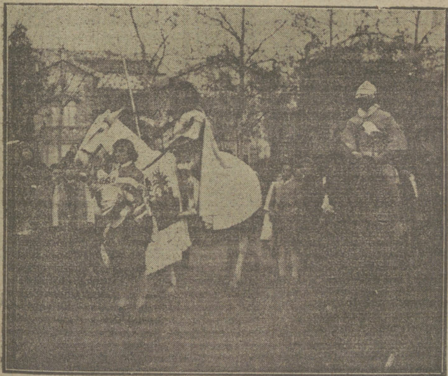
EL CARNAVAL EN MADRID.—«Castellana y su escudero», máscara que obtuvo premio en el concurso de ayer.

—Han llegado de Avilés los marqueses de Ferrera.