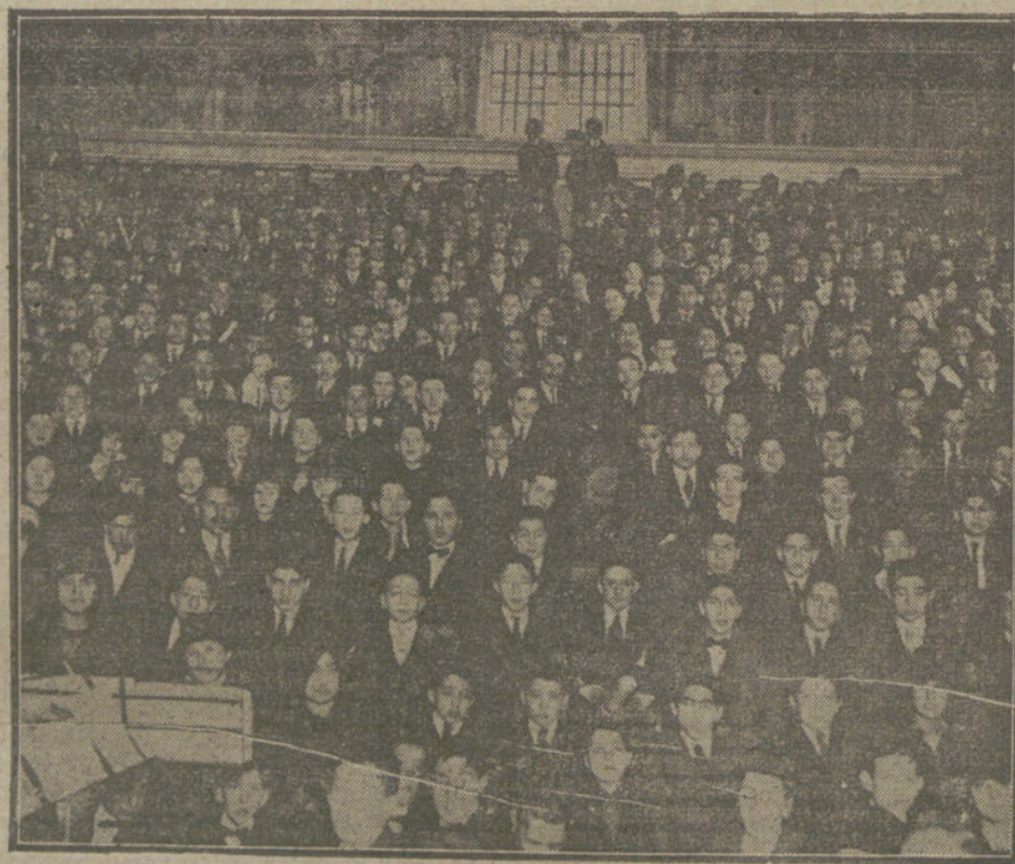
Aspecto del salón del Instituto de San Isidro durante el reparto de premios verificados ayer.

El «Vossische Zeitung» hace resaltar que la firma de la paz abre una brecha en el cerco de hierro con que las calumnias angloamericanas habían rodeado los territorios de la Cuádruple Alianza durante la guerra. La firma de la paz es el reconocimiento de un testimonio veraz, de un pueblo solicitado con afán por Inglaterra y América, y también de que Alemania no es aquel conquistador avaro que se pintó, sino que los intere-