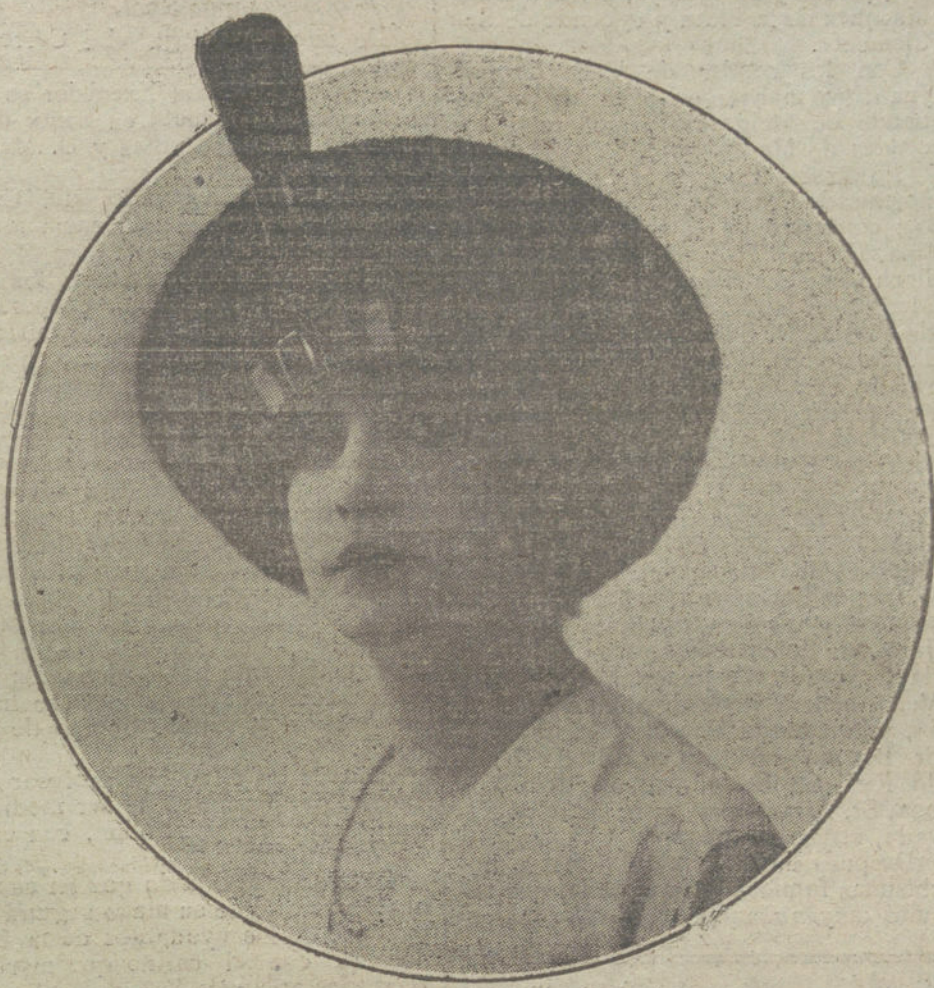
Pequeño sombrero, de extraño tejido de azabache con placas de cristal, modelo de la casa Louis.