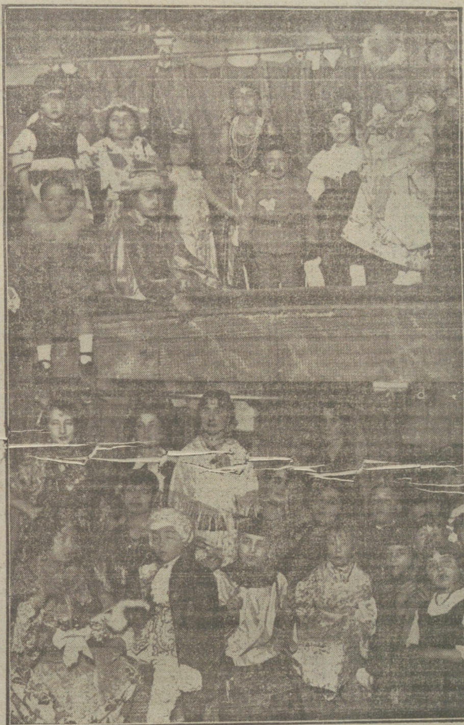
Grupos de niños que asistieron al baile infantil celebrado ayer tarde en el teatro de la Reina Victoria.

«Artículo 1.º Se declara obligatorio el seguro de guerra de la tripulación. En su consecuencia, las entidades colectivas o individuales dedicadas al transporte marítimo, deberán asegurar el personal que constituya la dotación de sus barcos que naveguen bajo pabellón español, ya sean de vapor o de vela, en el Comité del Estado, siempre que contraten con él el seguro de la totalidad o de parte del valor de la nave