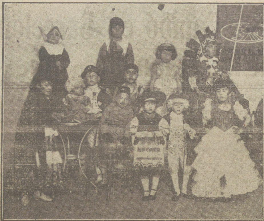
Grupo de niños premiados en el baile infantil organizado por el Círculo de Bellas Artes.

Nuestra tarea requiere un gran trabajo; pero los resultados que de ella podemos esperar son grandes. Nuestro ideal, que antes era una cosa lejana, hoy ya lo vemos a nuestro alcance. Los mayores concursos que podamos rendir a la Patria los hemos de aportar todos ahora, porque en pocos momentos podemos obtener todo lo que habíamos soñado para los ideales de Cataluña. (Ovación que dura largo rato.)