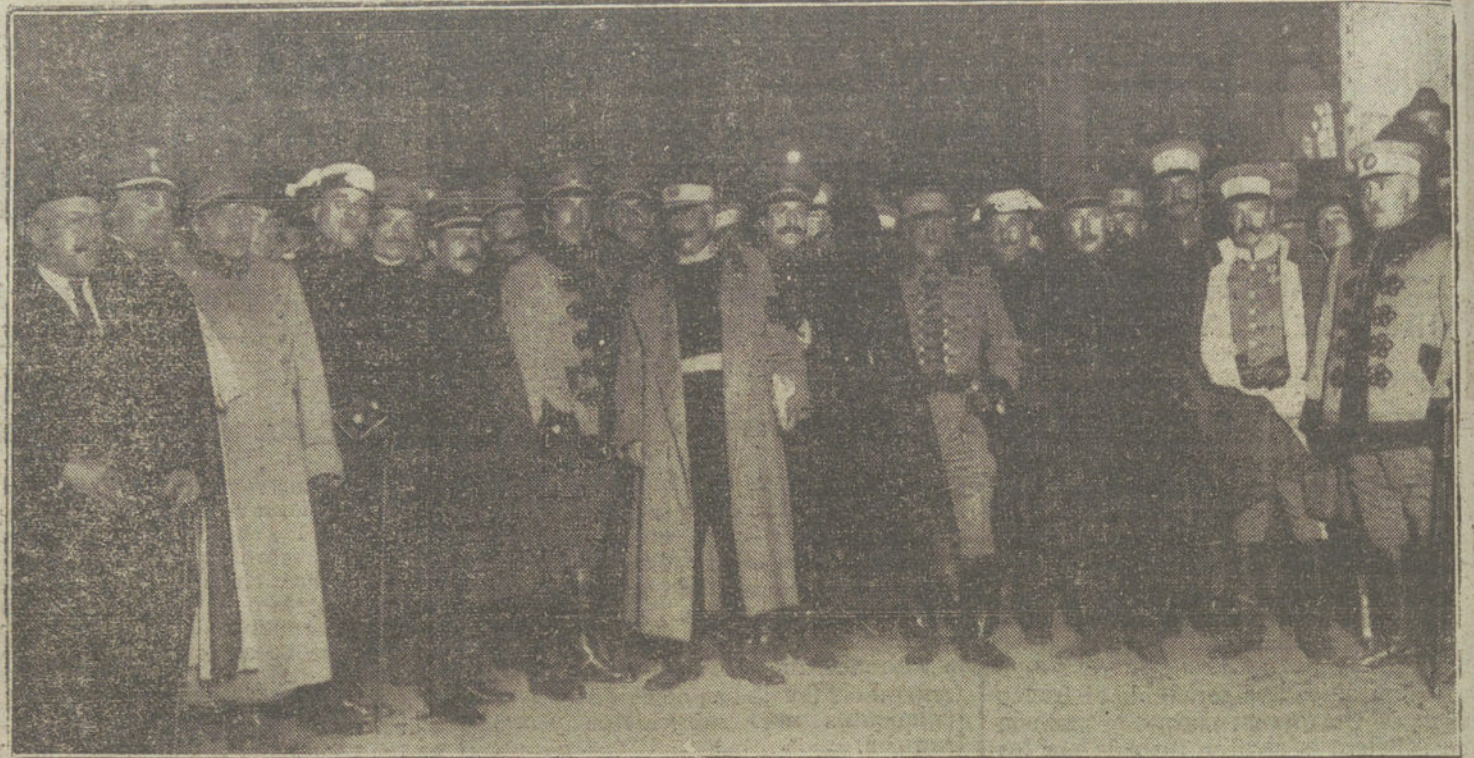
Llegada de la bandera que fue enseña de la Academia General Militar de Toledo, y que figurará en las solemnidades de hoy.

El periódico de Holanda, «Nieuwe Rotterdamse Courant», publica un informe de su corresponsal en Finlandia. Según este, organizaron los jefes bolchevistas en Egipto, durante su estancia en Finlandia, una revolución. El corresponsal tuvo conocimiento de la suerte de 230 soldados rusos que, puestos en libertad en Alemania, se proponían regresar á su Patria por Suecia y Finlandia. En la frontera finlandesa les fueron quitados á estos inválidos todos los víveres por los soldados rusos. Estos vendieron después todo lo robado, y á la protesta de los inválidos