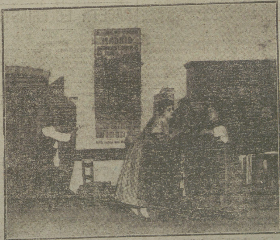
Una escena de la zarzuela de «Sol a Sol», que se estrena esta noche en el teatro de Novedades.

—Restablecida de su larga enfermedad, ha salido a la calle la marquesa de