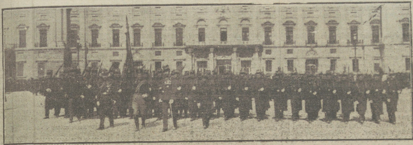
La bandera y las fuerzas que le han rendido honores, desfilando por la plaza de la Armería.

Hoy ha paseado triunfante las calles de Madrid una gloriosa bandera, en cuyo torno se agrupan jefes y oficiales de todas las Armas, Cuerpos e Institutos. Es la bandera de la antigua Academia General Militar, creada por el Rey Don Alfonso XII en 22 de Febrero de 1882, siendo ministro de la Guerra el general Martínez Campos.