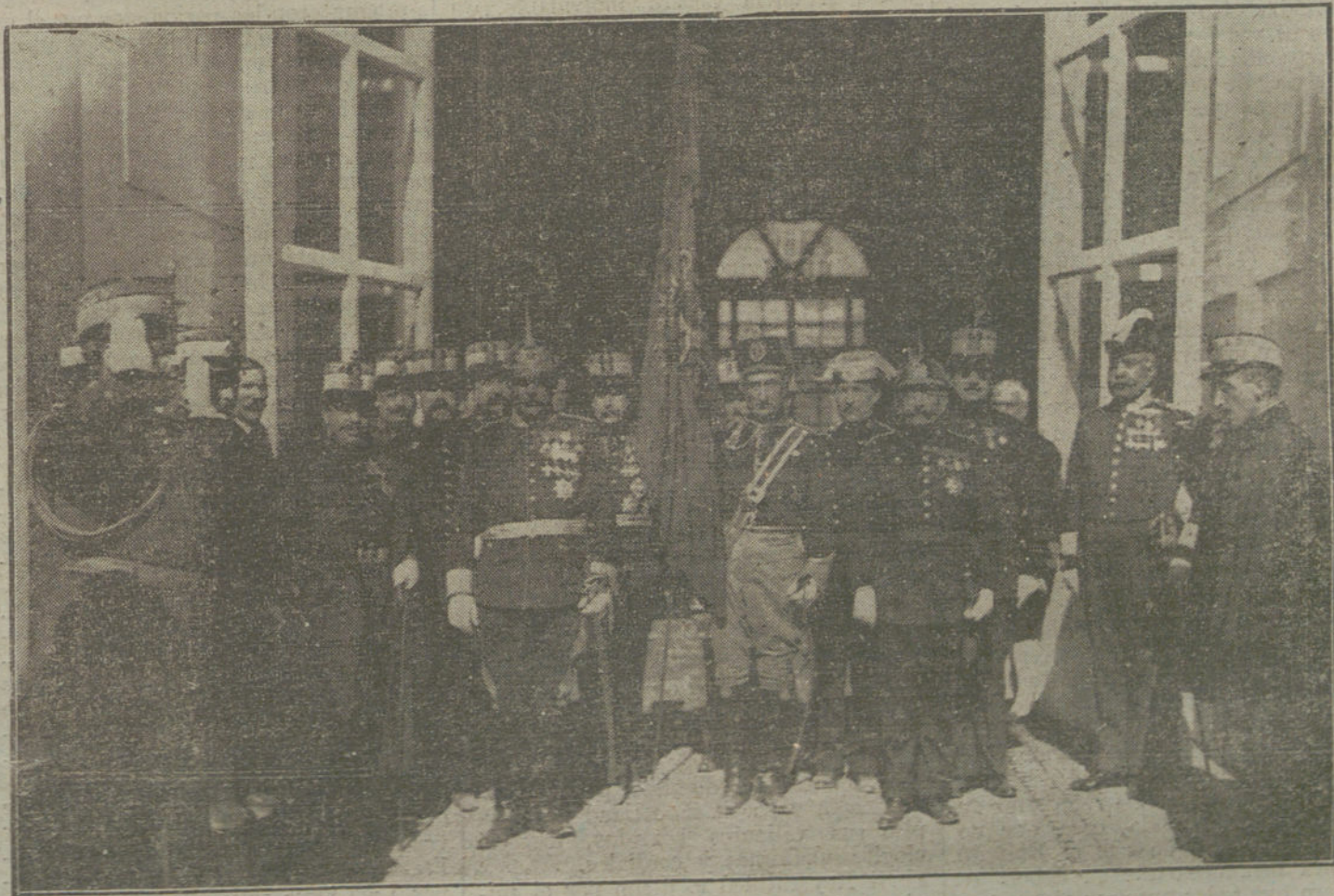
La bandera de la Academia General Militar, escoltada por los jefes y oficiales de todas las Armas e Institutos que cursaron sus estudios en dicho Centro, al ser sacada de Palacio.

La comitiva, con la bandera, hizo su entrada en el Alcázar en la forma mencionada, ascendiendo a las regias habitaciones por la escalera de honor.