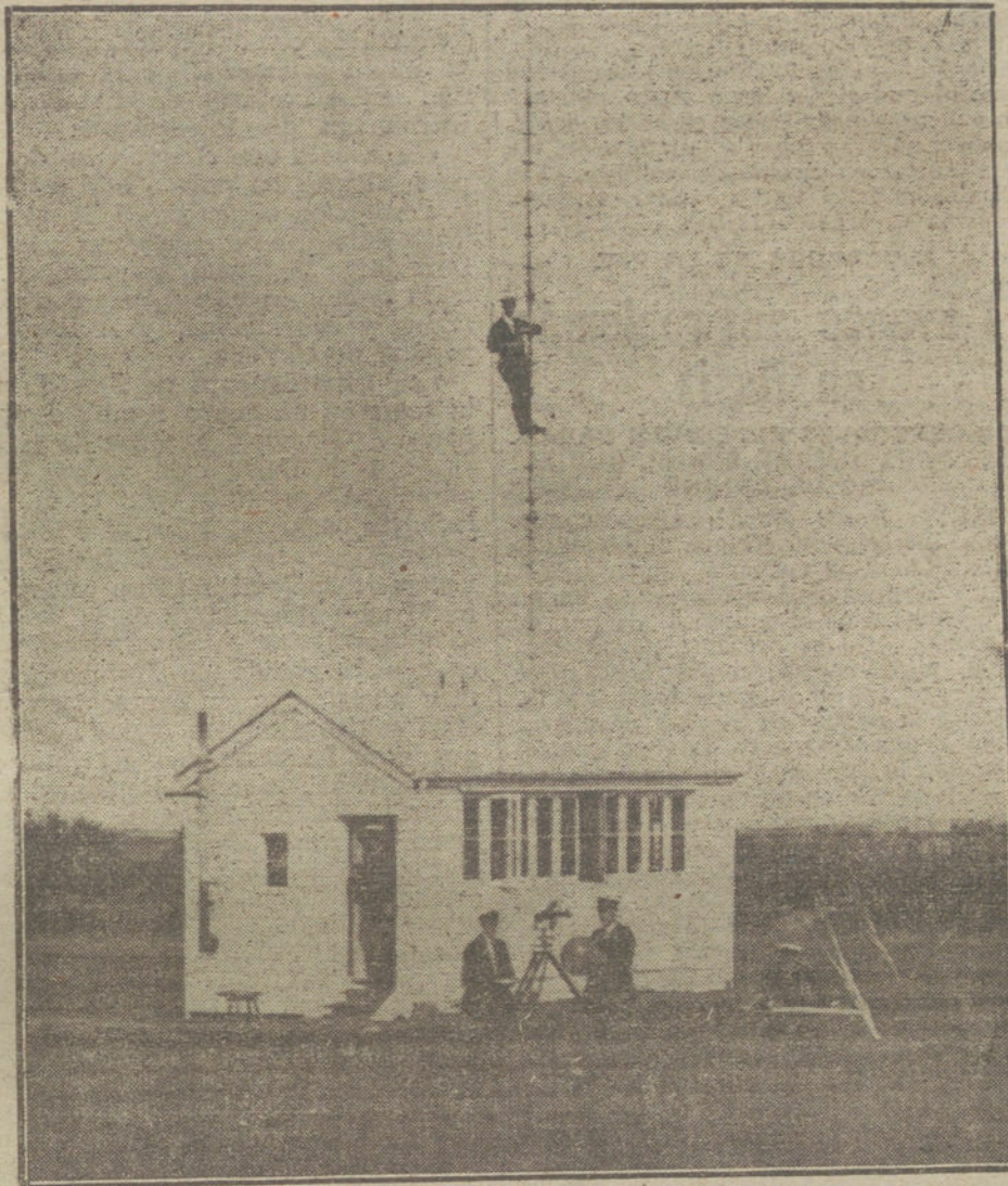
LAS NECESIDADES DE LA GUERRA.—Oficiales norteamericanos montando un observatorio en el frente inglés.

Siendo esta la realidad, y notorio, de contrario, que España se muestra ante el mundo en una situación económica inmejorable, resulta incomprensible el afán de muchos periódicos españoles, empeñados en el viceversa de