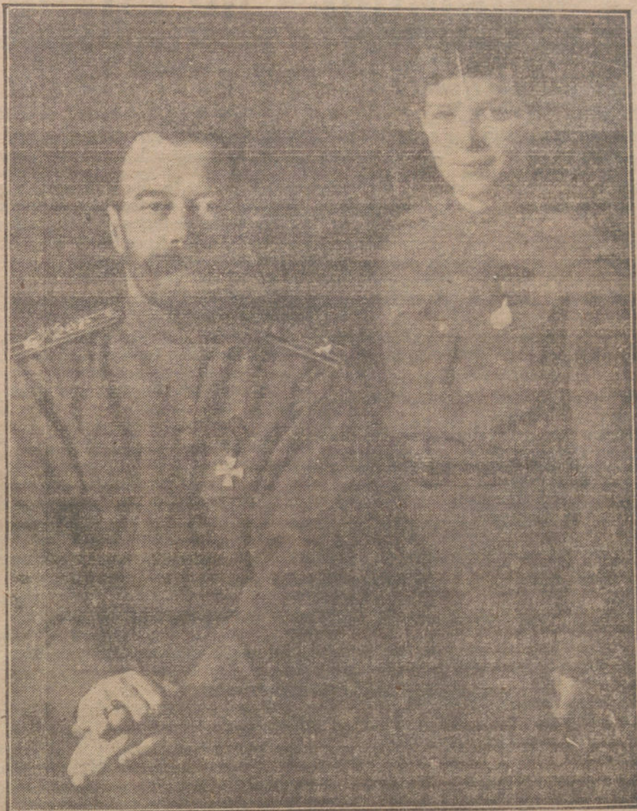
Ultimo retrato del ex Zar de Rusia y su hijo, hecho en el destierro.

PARIS. Telegrafian de Zurich que, según un testigo alemán que acaba de llegar de San Petersburgo, las calles están impracticables; montones de nieve de un metro de altura y boquetes numerosos impiden toda circulación rápida. La luz eléctrica no funciona regularmente. La población elegante ha desaparecido, o está oculta en sus casas. Pero no son éstas seguras garantías, porque las bandas, armadas, penetran en los cuarteles particulares.