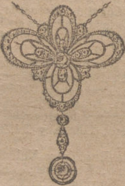
Núm. 4.—Tres brillantes y diamantes. Ptas. 450.