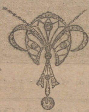
Núm. 1.—Siete brillantes y diamantes. Ptas. 400.

Monturas de platino fino y oro de ley 18 quilates contrastado