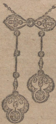
Núm. 6.—Diez brillantes y diamantes. Ptas. 625.