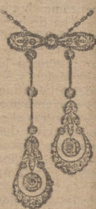
Núm. 3.—Ocho brillantes y diamantes. Ptas. 575.