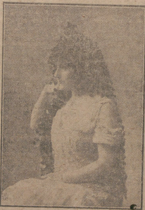
JOSEFINA ROCA, notabilísima primera actriz, que ahora obtiene grandes éxitos en el Poliorama, de Barcelona.

Según el diario «Daily Chronicle» dice con referencia a una noticia de San Petersburgo, manifestó Lenin en una conferencia de los Consejos de obreros y soldados que el seguir ofreciendo Rusia resistencia militar, podría destruir todo lo que alcanzó la revolución. Si Alemania, antes de que Rusia concierte la paz, se entiende con Inglaterra, Francia y América, los imperialistas del mundo entero se unirán para aplastar a la revolución rusa.