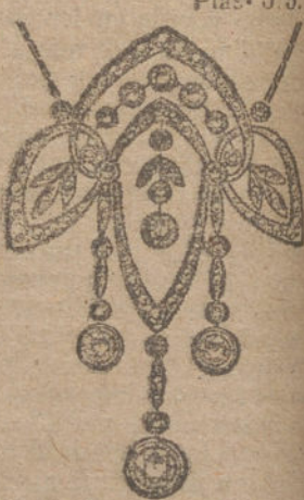
Núm. 5.—25 brillantes y diamantes. Ptas. 1.100.