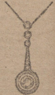
Núm. 8.—Cuatro brillantes y diamantes. Ptas. 750.

Factura de garantía en todas las compras