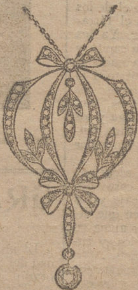
Núm. 2.—Cinco brillantes y diamantes. Ptas. 775.