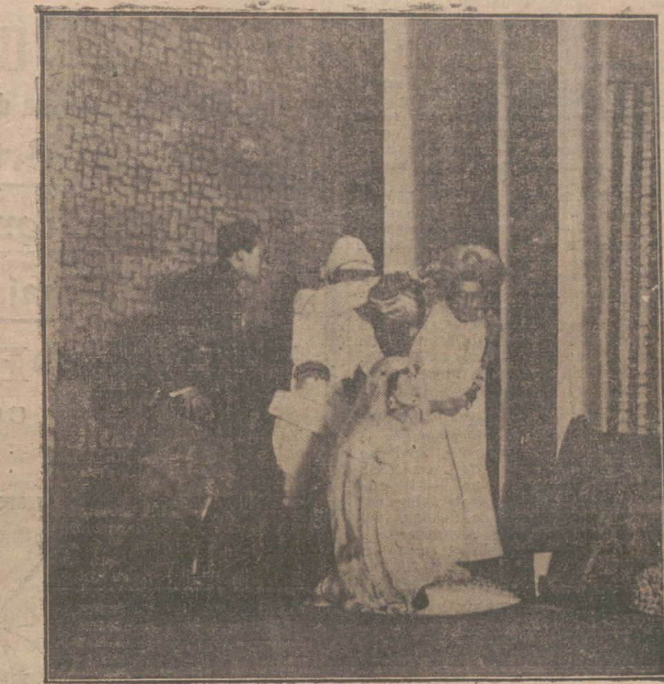
Una escena de «El secreto del idolo», obra estrenada anoche en el teatro de Cervantes.