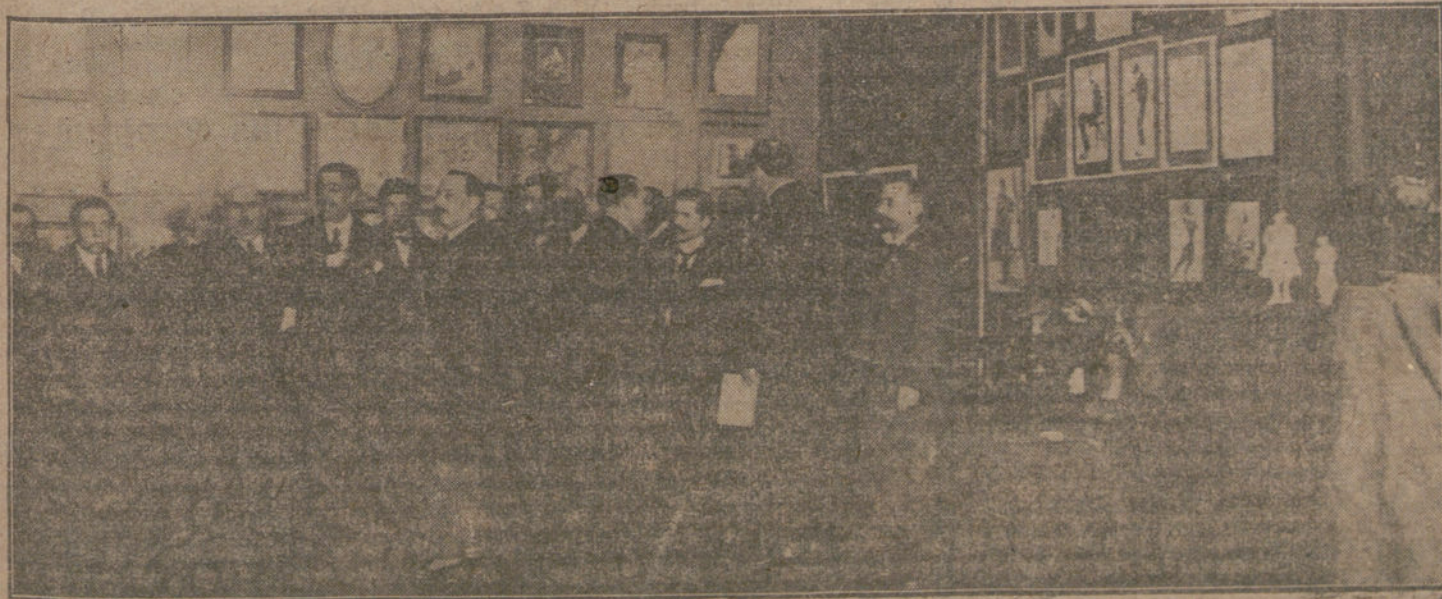
Un aspecto del salón de humoristas, cuya Exposición se inaugura esta tarde.