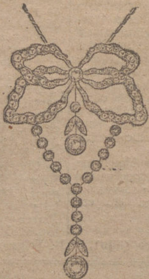
Núm. 7.—18 brillantes y diamantes. Ptas. 1.275.