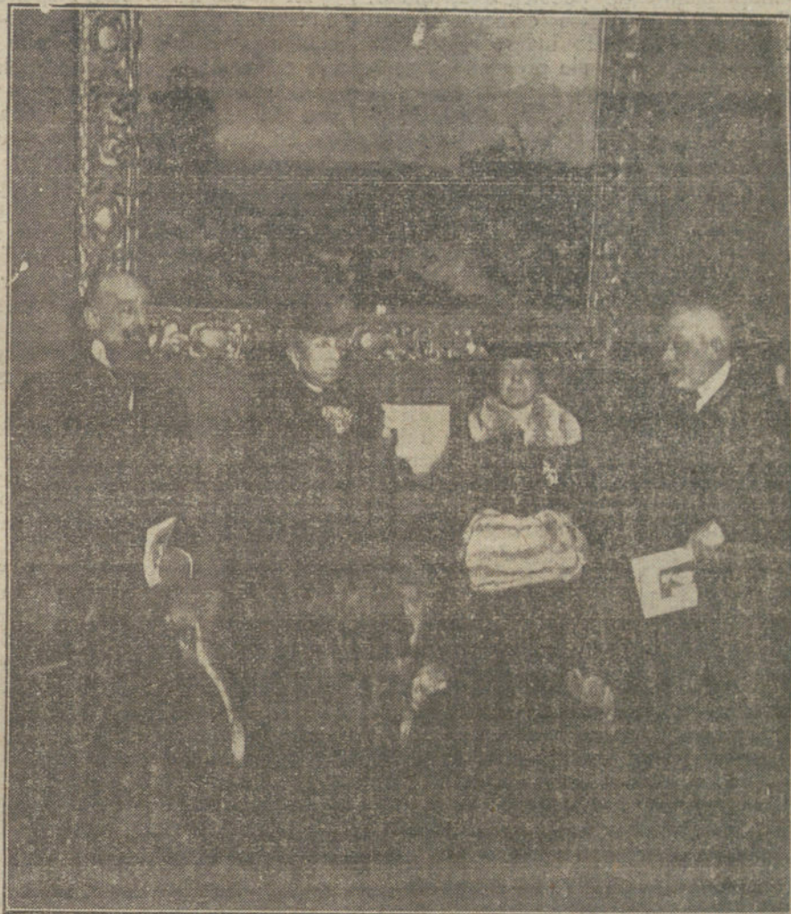
S. M. la Reina Victoria visitando la Exposición del Arte en la taurinomaquia.

Pero observamos que sólo Inglaterra, Francia, Italia y los Estados Unidos gozan en España esta exclusiva preferencia para negociar arreglos comerciales. Y observamos también que esos arreglos comerciales tienden a favorecer en la mayor parte a los aliados, que así se sirven a su antojo de nuestra política económica, como intentan supeditar a su voluntad las claudicaciones de nuestra política exterior. Y observamos asimismo que esos que pudiéramos llamar desarreglos comerciales, buscan