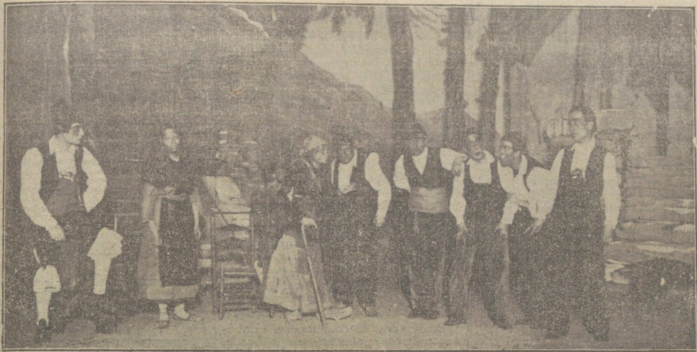
Una escena de «La Niña», que se ha representado esta tarde en el teatro Español, á beneficio de la Asociación de la Prensa.

Lo seguro es que con ello han fortalecido el movimiento, al que consideraban ellos mismos como absurdo y perjudicial. Dudoso resulta lo que han logrado con su ideada influencia, pues para ello parecían estar débilmente representados. Circunstancias de otra naturaleza, especialmente la serenidad y decisión de las autoridades en su intervención, la infructuosidad y decepción, así como la falta de dinero, parece han motivado en mayor medida el término del movimiento.»