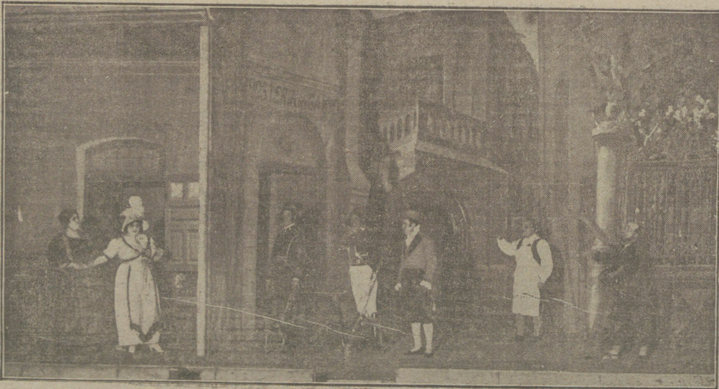
Una escena de «La canción del olvido», que se estrena esta noche en el teatro de la Zarzuela.

El diputado Erzberger, manifestó: «La resolución de Julio del año pasado era impuesta por la situación de entonces, y significa un acto del